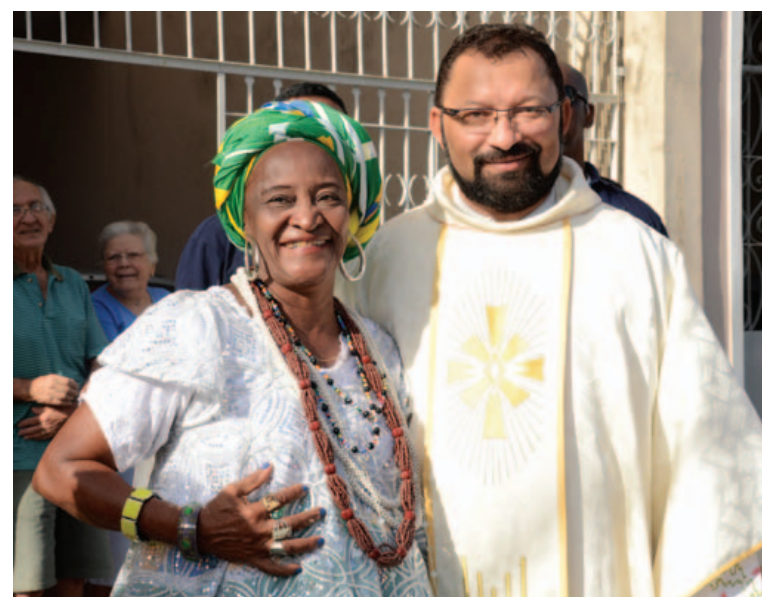
Independência também nas crenças: sincretismo fez-se presente na caminhada cívica de 2 de julho

de independência completou a Bahia nesta quinta-feira