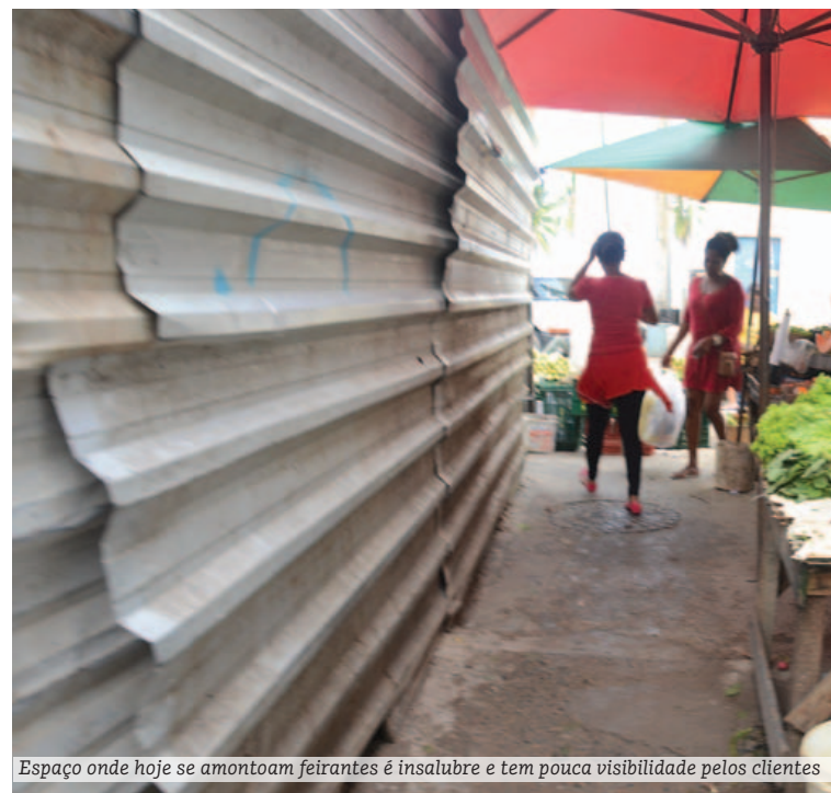
Espaço onde hoje se amontoam feirantes é insalubre e tem pouca visibilidade pelos clientes