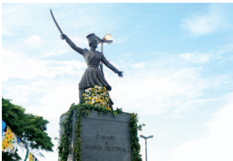
Maria Quitéria foi uma das mulheres homenageadas no desfile cívico de 2 de julho

Além delas, a ex-presidente do Instituto Geográfico e Histórico da Bahia, Consuelo Pondé, que faleceu no último mês de maio, recebeu diversas homenagens durante a festa.