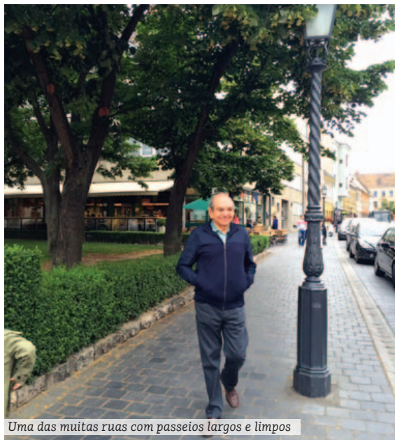
Uma das muitas ruas com passeios largos e limpos