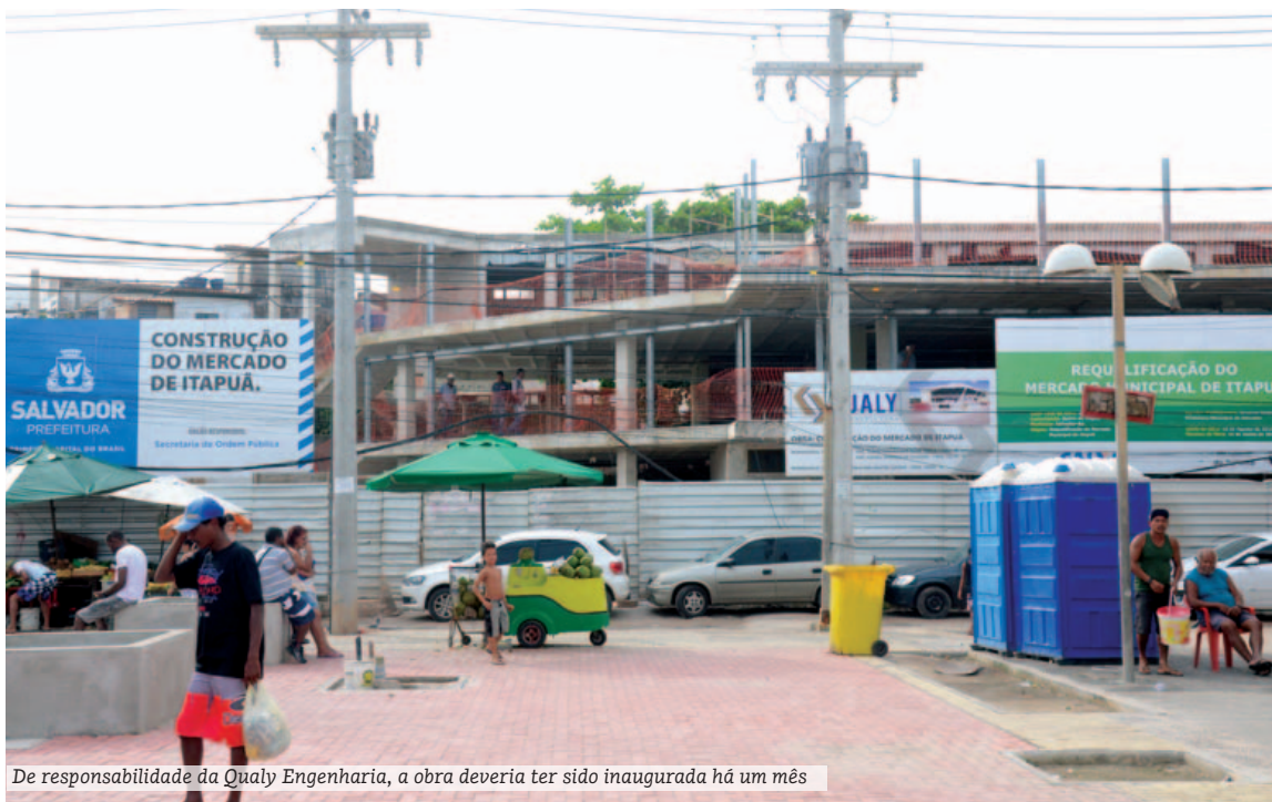
De responsabilidade da Qualy Engenharia, a obra deveria ter sido inaugurada há um mês