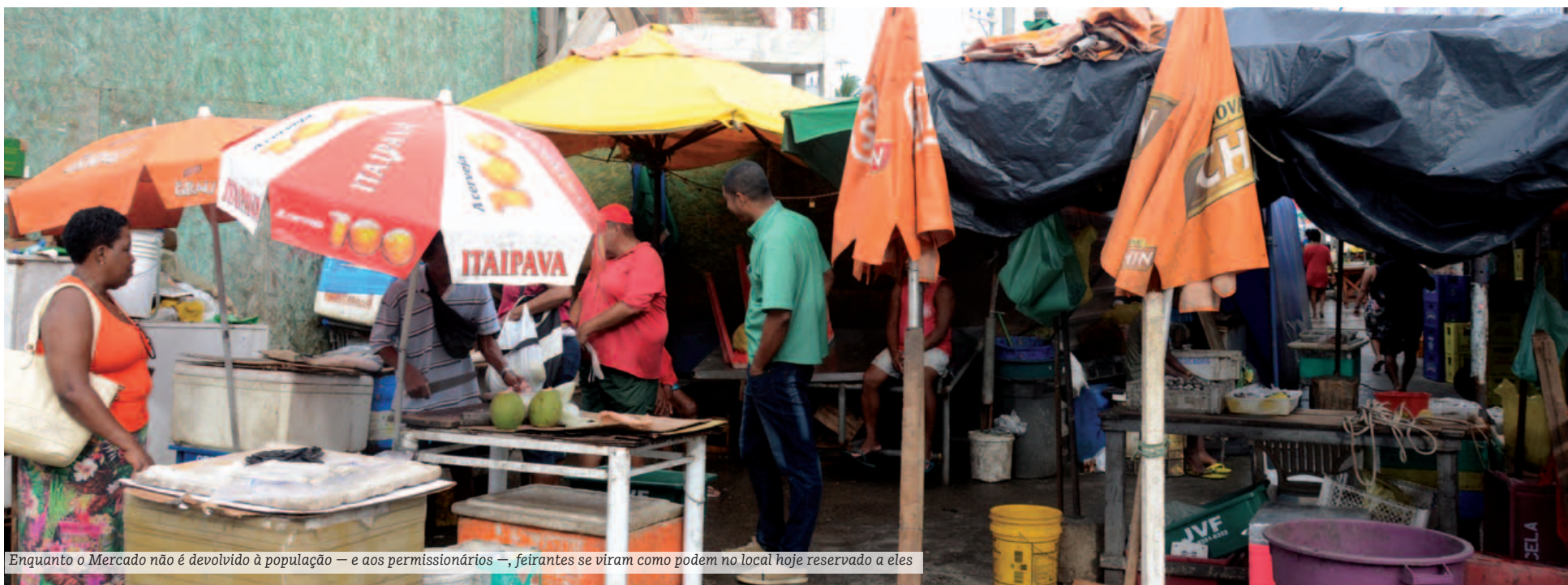
Enquanto o Mercado não é devolvido à população — e aos permissionários —, feirantes se viram como podem no local hoje reservado a eles