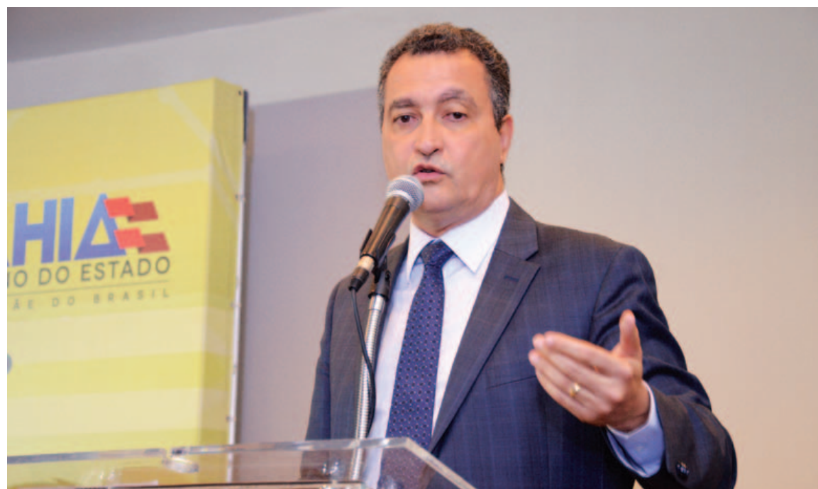
Rui Costa prometeu se debruçar sobre o assunto Irdeb depois do São João. Este mês de julho, então, será de muitas reuniões na governadoria