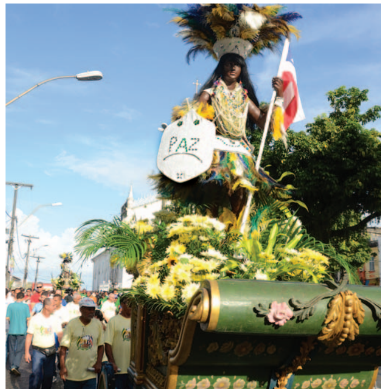
Estampando dizeres de paz, a caboça foi seguida pelas comitivas políticas e pelo povo