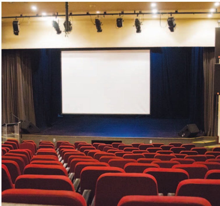
Imponente, estrutura do Irdeb poderia ser muito melhor utilizada em prol dos baianos

“É assim em todos os países que alcançaram o desenvolvimento. E não é assim nos países apegados ao atraso. Basta verificar os custos das manutenções das TVs abertas da Bahia e comparar com a TV Educativa. A quantidade de profissionais que trabalham lá é uma barbaridade. A relação custo-benefício com o Irdeb não justifica sua manutenção. Para manter-se é preciso que haja uma mudança radical”, disse.