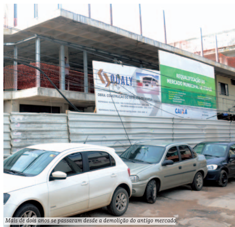
Mais de dois anos se passaram desde a demolição do antigo mercado