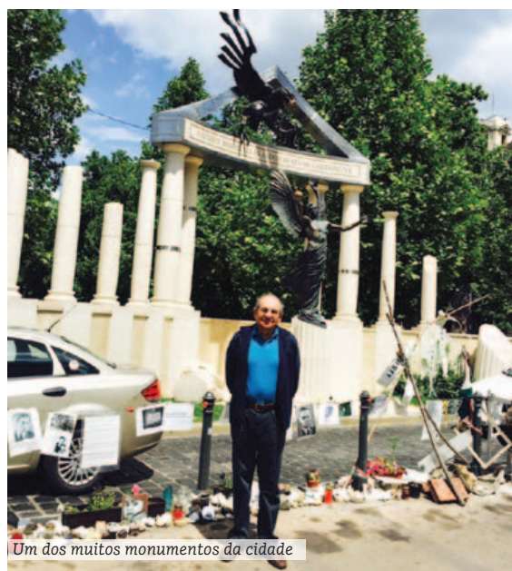
Um dos muitos monumentos da cidade