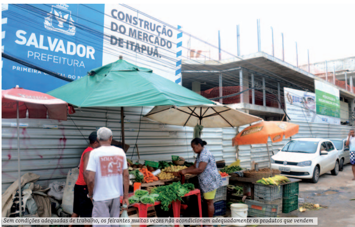
Sem condições adequadas de trabalho, os feirantes muitas vezes não acondicionam adequadamente os produtos que vendem