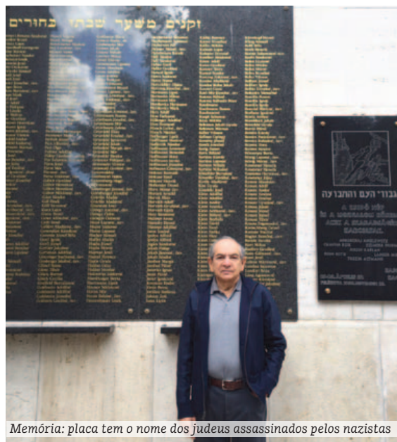
Memória: placa tem o nome dos judeus assassinados pelos nazistas

“Não tem um problema de assalto. Nada. Não tem um buraco na rua”