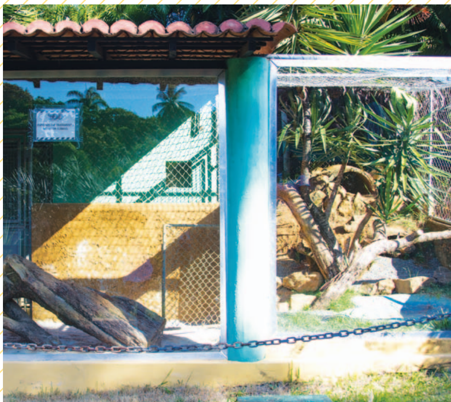
Em 2014, até quando os recintos estavam em bom estado, o Zoológico justificava a falta de animais com um aviso de manutenção.