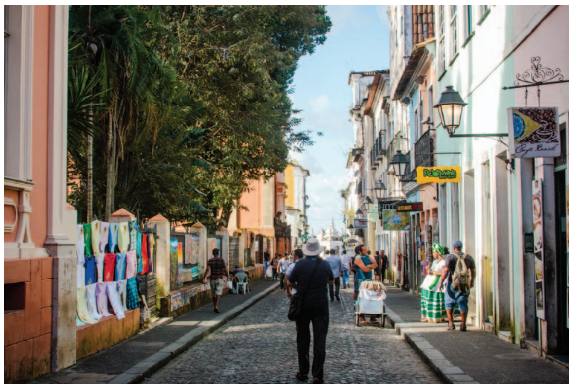
Ações para transformar o Pelourinho em polo de shows e espetáculos deve fortalecer a economia local e viabilizar a criação de empregos

de reais serão investidos pelo governo do estado em obras no Centro Antigo