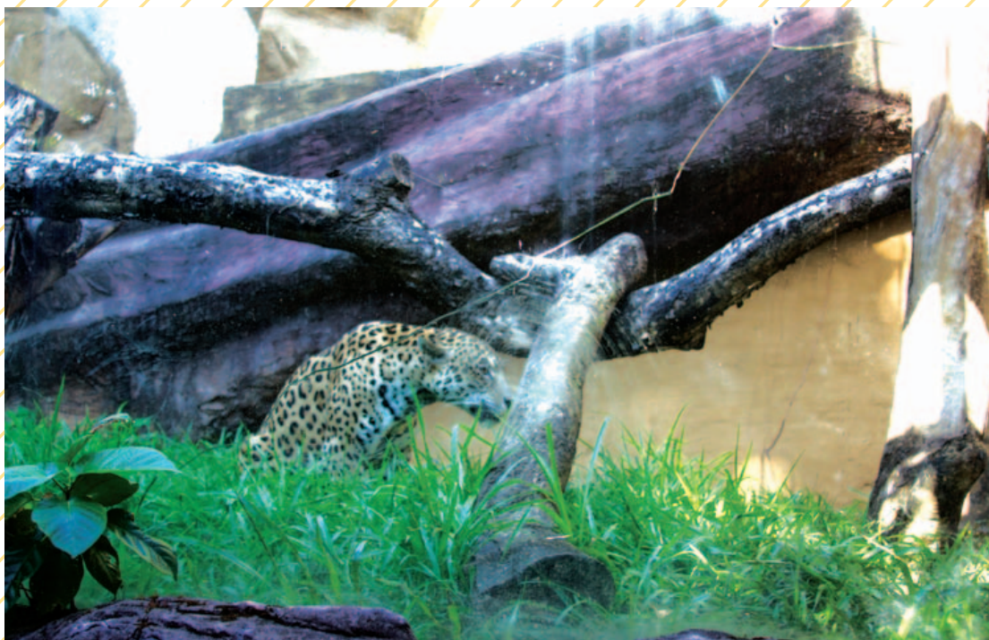
Espaço que abriga onças-pintadas estava com o vidro trincado, o que, já no ano passado, assustava os visitantes.