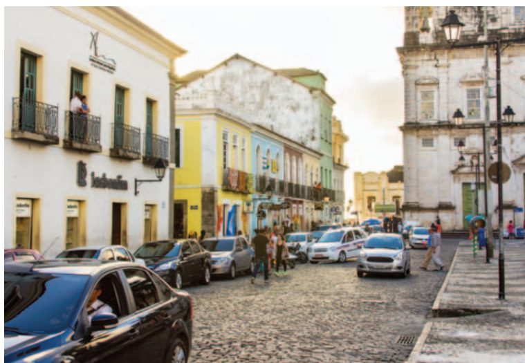
Prefeitura anunciou novas áreas de Zona Azul e entrada de táxis no Pelourinho

Segundo o governador Rui Costa, um dos principais focos da revitalização do Pelourinho é a geração de postos de trabalho. “Eu quero buscar emprego para o povo. Em qualquer lugar do mundo, o que sustenta o Centro Histórico é a economia. Não pode ser presépio. Está em execução o Hotel Fasano. Teremos emprego para as pessoas que moram no centro. Vamos construir mais vagas de estacionamento. O diferencial de Salvador é a cultura do povo”, disse.