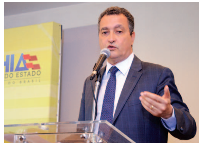
O governo da Bahia afirmou que não vai deixar os terceirizados ficarem sem seus salários

Sobre a confusão que resultou na prisão de dois membros do Sindilimp, o governo justificou que membros do sindicato espalharam combustível nas dependências do colégio e ameaçaram atear fogo no local caso não fossem atendidos em seus pleitos.