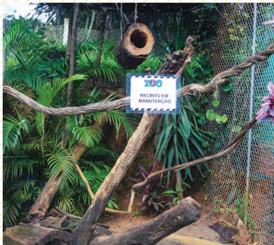
Mais de um ano depois, a situação é semelhante: várias jaulas sem defeitos aparentes com aviso de manutenção. É disfarçar?

Texto Bárbara Silveira barbara.silveira@jornaldametropole.com.br