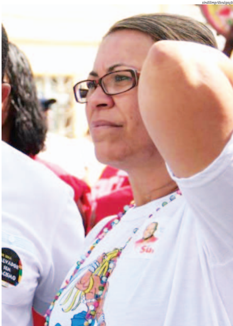
Presidente do Sindilimp foi presa durante manifestação do sindicato em frente a um colégio

De acordo com o Sindilimp, a categoria não consegue estabelecer um diálogo com o governo. “A gente quer mostrar que esses trabalhadores terceirizados (...) precisam levar o pão para casa, e isso não está acontecendo. Algumas empresas pagaram salário, mas e o benefício e a assistência médica?”, disse a coordenadora.