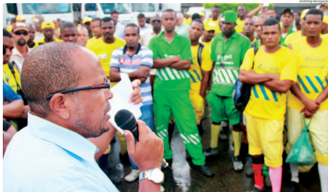
Nas últimas semanas, manifestações do Sindilimp têm acontecido em vários colégios e em aparições públicas do governador Rui Costa