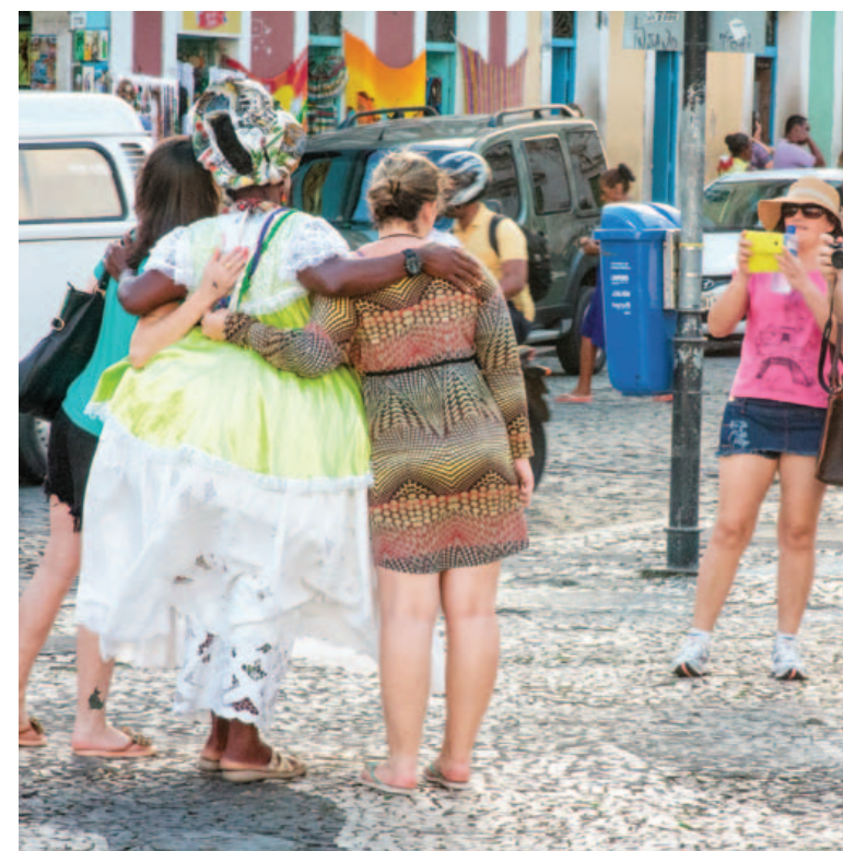
Estímulo à chegada de mais turistas no Centro Histórico passa pela revitalização da área

ra. Aposto que tanto a Prefeitura quanto o governo vão se empenhar para fazer o melhor para todos”, elogiou o artista.