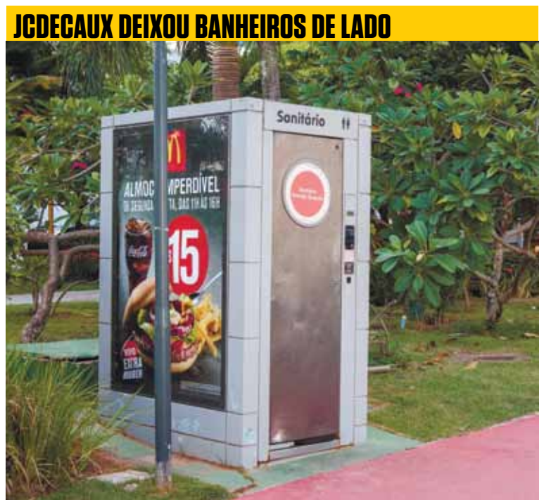
Com o aval do Município, JCDecaux julgou que ponto de ônibus seria mais útil que banheiro