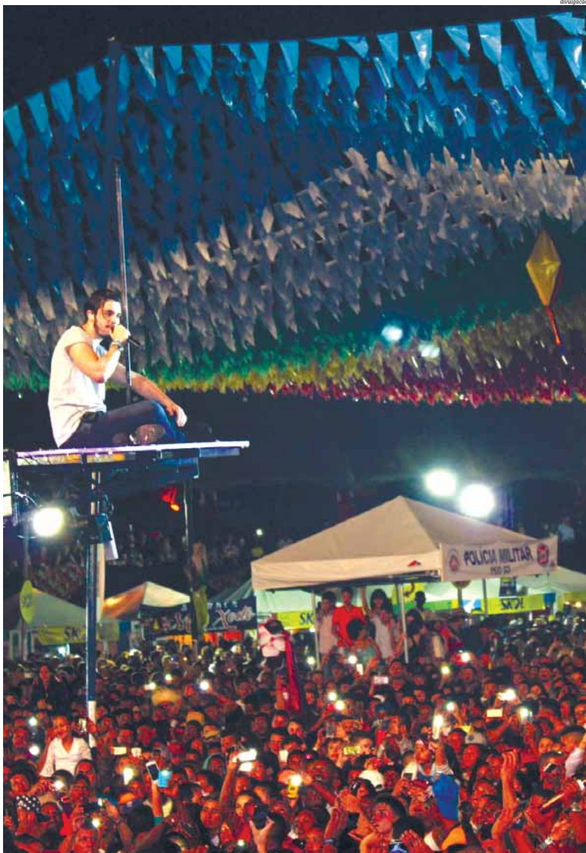
Santo Antônio de Jesus vai realizar uma das maiores festas de São João da Bahia enquanto moradores reclamam de aumentos abusivos