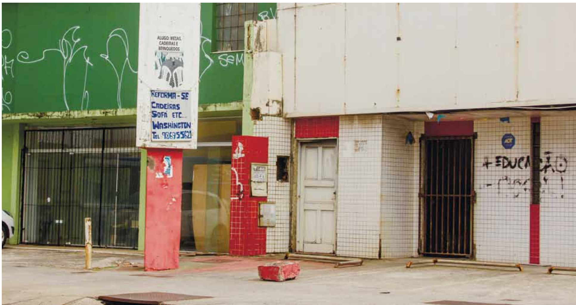
Se quem já vivenciou os prósperos dias da Avenida Manoel Dias fica preocupado, os comerciantes recém-chegados na região vivem um misto de esperança e preocupação; lojas fechadas aumentam a cada dia no local

Planejada para ser a Av. Oscar Freire baiana, Av. Manoel Dias tem comércio fraco e violência constante