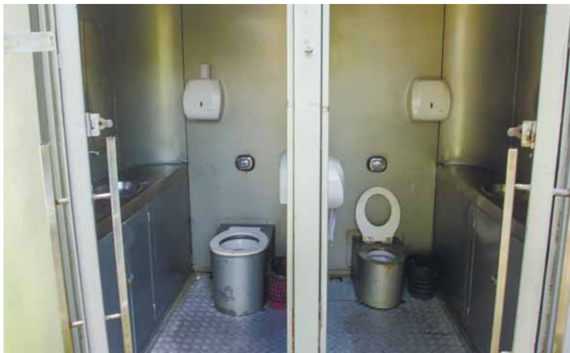
Únicos sanitários fixos instalados em Salvador, unidades do Campo Grande oferecem estrutura bem diferente dos banheiros químicos