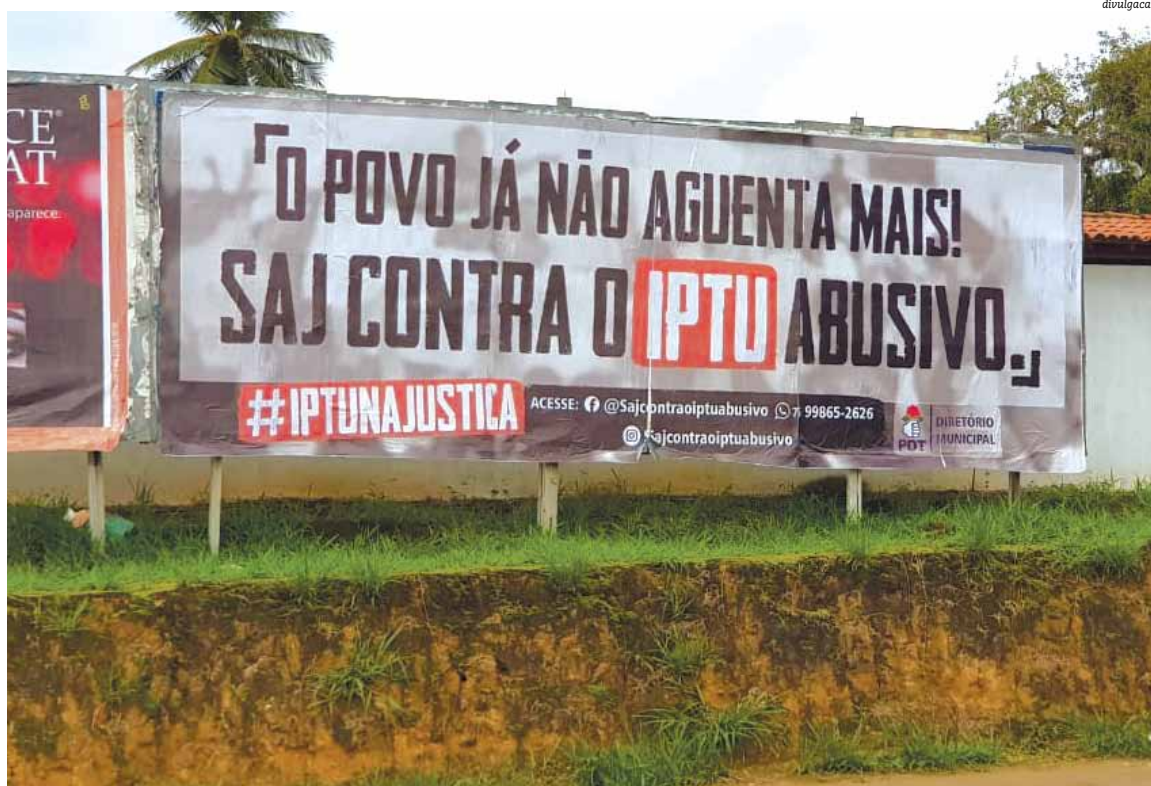
Campanha conseguiu fazer a prefeitura recuar e prazo para o pagamento do IPTU foi adiado, mas população quer mais

lor que seria o justo. Só que esse valor ainda era alto, então reduzimos em 50% e colocamos um redutor. Por exemplo, o cidadão que pagava R$ 10 de IPTU, esse ano só vai pagar R$ 14. O justo, segundo a consultoria, era pagar R$ 100”, disse.