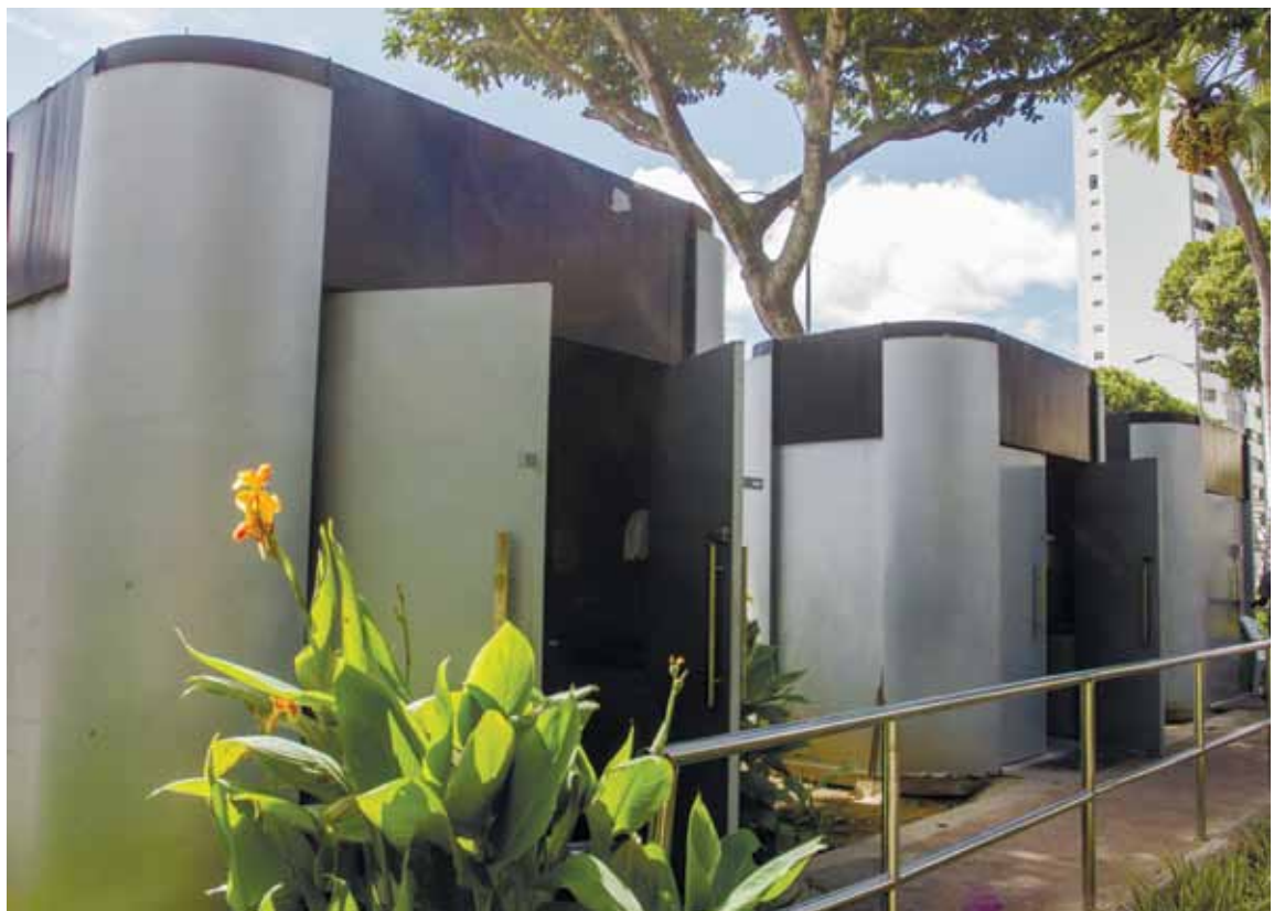
Em 2016, secretária garantiu que orla, praças e pontos turísticos receberiam os banheiros fixos, como os da Praça do Campo Grande

9,6 MILHÕES é o preço do contrato anual da prefeitura para aluguel de banheiros.