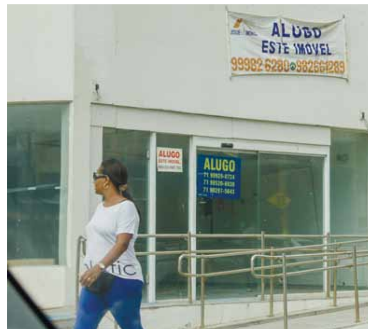
Nem mesmo as agências bancárias estão resistindo a crise que afeta a via há alguns anos