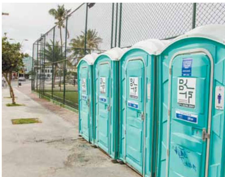
Alvo de reclamações, banheiros químicos mudam a orla da cidade e dividem opiniões

O aluguel de banheiros químicos tem feito o município gastar um montante considerável. Somente em 2018, a prefeitura pode pagar mais de R$ 17 milhões pelo serviço — sendo R$ 9.695,560,00 do lote 2 do contrato com a BF Serviços Ambientais e mais R$ 7,7 milhões pagos pelo aluguel dos equipamentos durante o Carnaval. “A Semop ressalta que o valor é pago por demanda, não necessariamente usa-se o teto máximo, e o serviço inclui transporte, instalação e higienização”, disse sobre os mais de R$ 9 milhões do contrato.