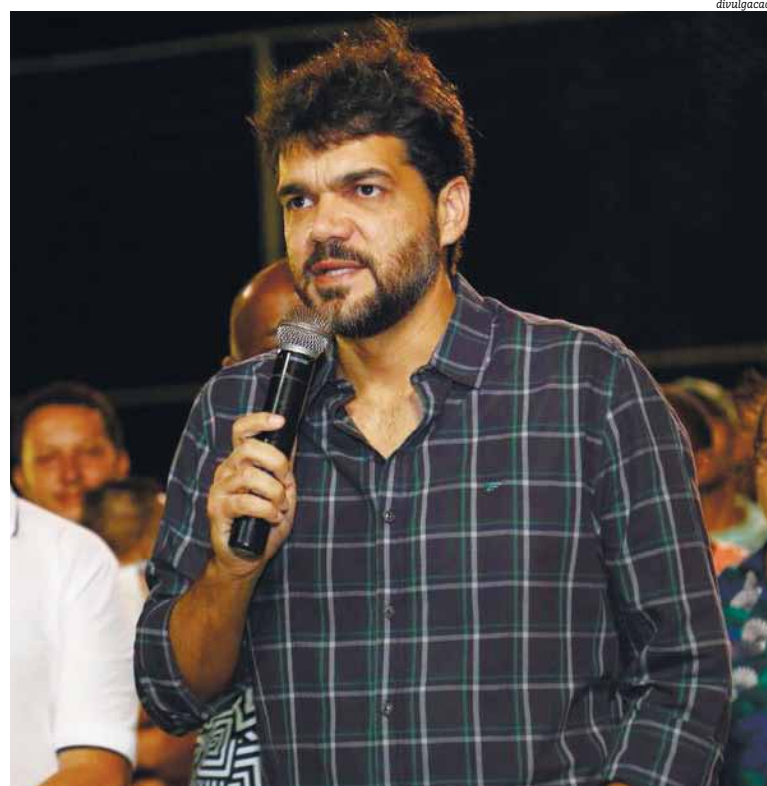
Prefeito de Santo Antônio nega que o aumento do IPTU tenha relação com o São João