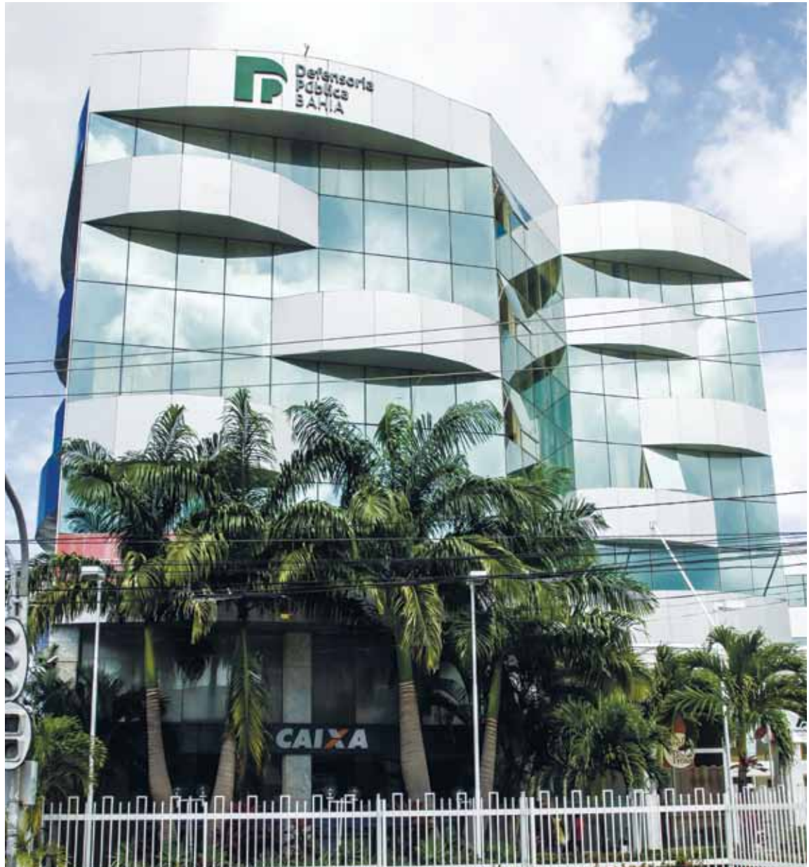
Associação reclama da falta de diálogo com a categoria, que cobra aumento no quadro de Defensores Públicos desde 2006