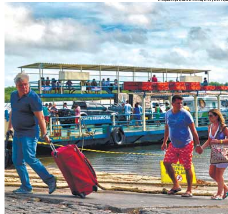
Sul da Bahia está entre os destinos mais procurados no estado, segundo levantamento