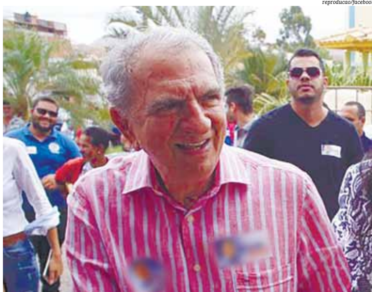
Reinaldo Braga descarta aposentadoria nos próximos anos e vislumbra futuro político

O deputado não teme ser vítima da tal “renovação política”. “Para mim, não muda muita coisa. Na política tudo tem seu tempo. Eu estou nessa luta”, completou.