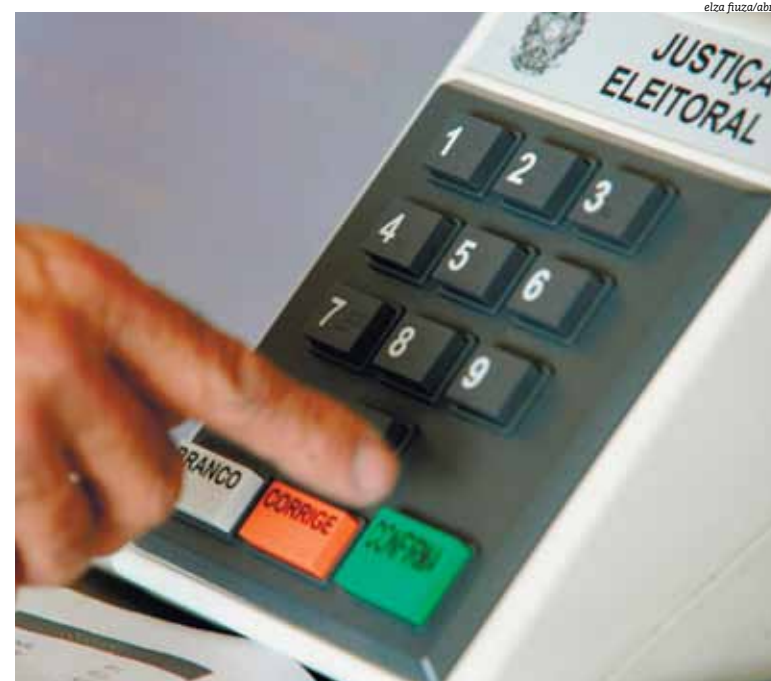
Renovação tem sido a plataforma de campanha de muitos candidatos em 2018

Nem mesmo o descrédito da popular com a política, para o professor, vai ser fazer romper com a falta de novos nomes. “As pessoas passam dois anos xingando os políticos e no ano da eleição atuam como um BA-VI. É uma distorção”, avaliou.