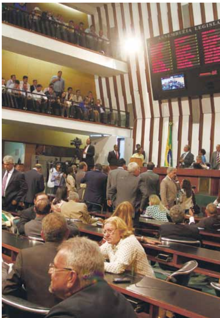
Se depender dos atuais deputados, índice de renovação na Assembleia será baixo

De acordo com a AL-BA, PT e DEM são os partidos com maior número de parlamentares em busca da renovação do mandato: são oito legisladores em cada uma das legendas. Terceira maior força no Parlamento baiano, o PSD, que tem nove parlamentares, registrou a candidatura de sete deputados que buscam a continuidade dos mandatos.