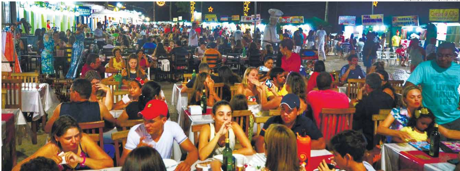
Alta procura tem feito a cidade de Porto Seguro investir no setor de serviços; terceiro maior parque hoteleiro do país, a cidade acumula cerca de 50 mil vagas de leitos em hotéis e pousadas e aproximadamente 500 empreendimentos