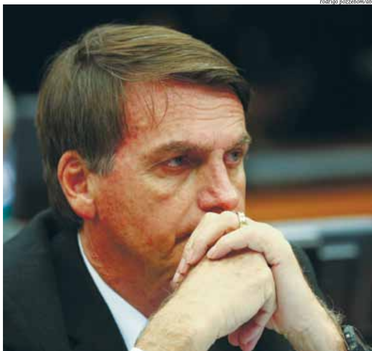
Candidato do PSL à presidência tem alta taxa de rejeição entre as mulheres

Na opinião do presidenciável, o crescimento do adversário Jair Bolsonaro (PSL) nas pesquisas é fruto da cultura do ódio vivida pelo país atualmente. “O Brasil está sem governo há algum tempo. De 2014, quando esse ódio se instalou, o lado que perdeu não reconheceu a derrota. Faz quatro anos que ninguém presta serviço em Brasília [...] Esse mundo de ódio produziu uma candidatura como a de Bolsonaro , que nunca administrou um botequim dos pequenos. Nada. São 28 anos fazendo nada. Não tem uma iniciativa desse cidadão e quer ter como experiência governar o Brasil na pior crise”, ressaltou.