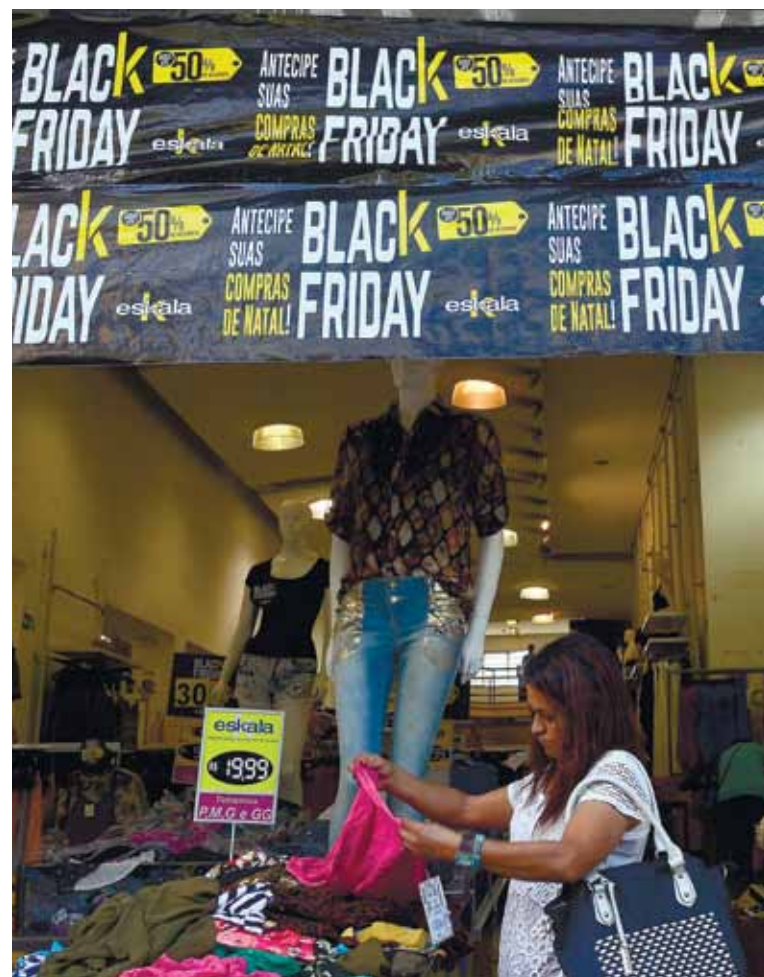
Preço alto pode vir mascarado até mesmo na cobrança do frete de entrega em residências