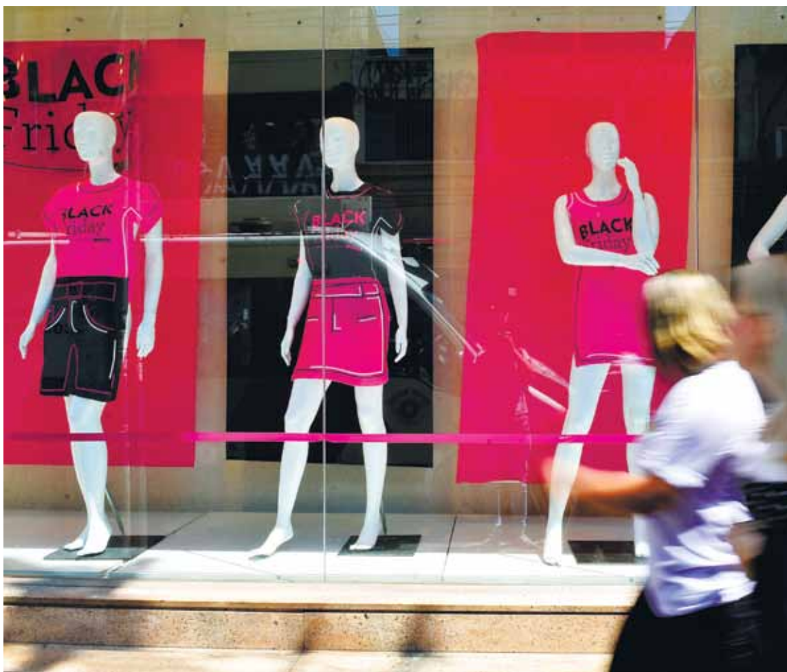
Consumidor precisa de atenção para fugir de pegadinhas maliciosas na hora de comprar produtos nas lojas físicas e na internet

da observação. De acordo com ele, as penas para quem é flagrado em irregularidades geram mais constrangimento do que dor de cabeça. “É uma pena de pouco potencial ofensivo. A pessoa passa por um constrangimento mesmo. Não chega a ficar preso por flagrante”.