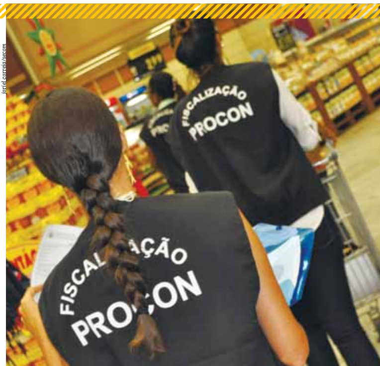
Internet também terá autuações, garantem órgãos de fiscalização e defesa do consumidor

Fraude em redes sociais pode ser denunciada