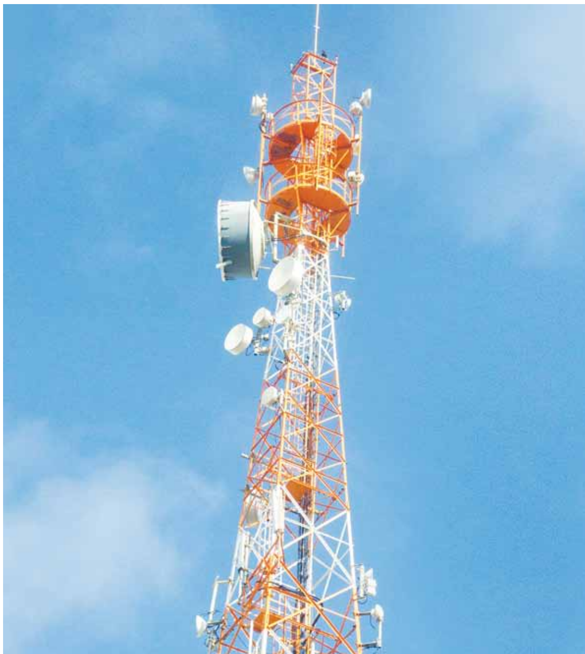
Telefônica está em recuperação judicial, dá muita dor de cabeça a quem contrata e ainda amarga o posto de empresa com maior número de reclamações

No terceiro trimestre de 2018, a Oi amargou um prejuízo de mais de R$ 1,3 bilhão. A perda é 70 vezes maior do que a registrada no mesmo trimestre do ano passado, quando o estrago somou R$ 19 milhões.