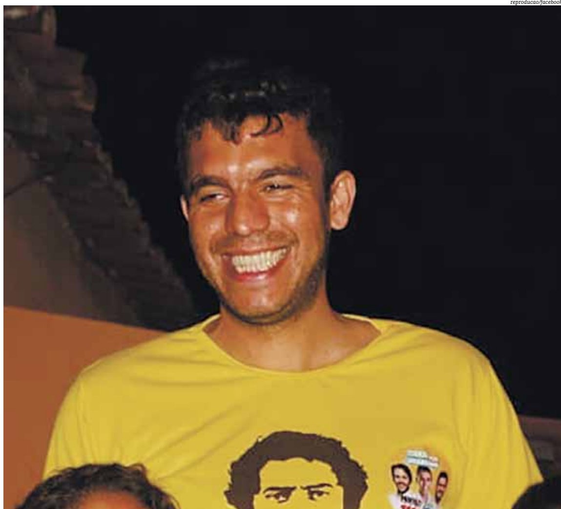
Vice-prefeito tentou ficar no cargo e promoveu gastos acima do aceitável para uma cidade pobre e com mais de 31 mil habitantes