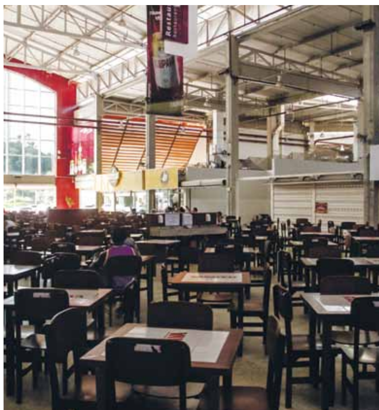
Praça de alimentação fica vazia mesmo às 12h, horário que deveria estar cheia de clientes

Comerciantes são penalizados por atrasos