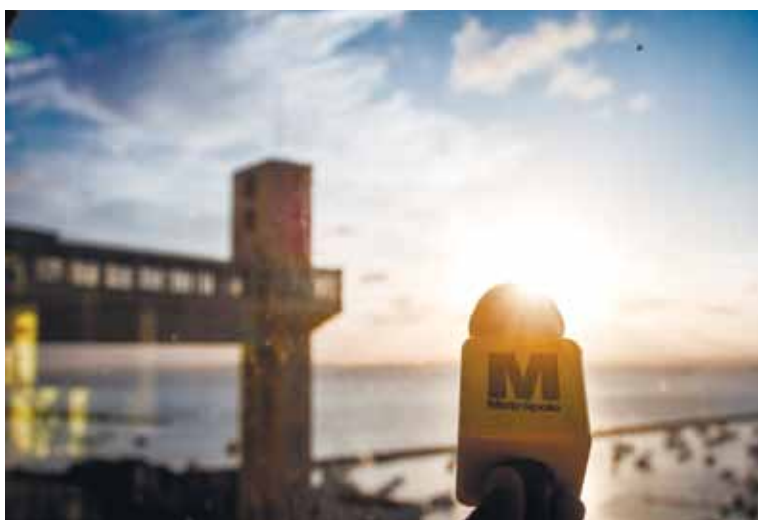
Pensando nos próximos anos, Metrôpole dá uma nova cara à sua programação diária