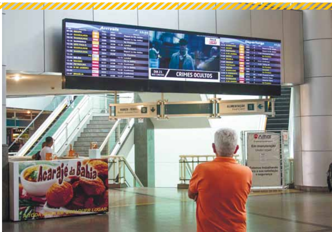
Atrasos e cancelamentos seguem padrão dentro da média, segundo diretor-presidente da Vinci Airports, que administra o aeroporto

de uma das UPIs. Um acordo estabelecido entre a Latam e a gestora norte-americana Elliott no processo promete transferir US$ 35 milhões para o maior credor da Avianca e sua holding, a título de compromisso de adquirir a UPI B, que detém 13 autorizações de decolagens e pousos no aeroporto de Guarulhos, outras cinco no Santos Dumont e nove em Congonhas.