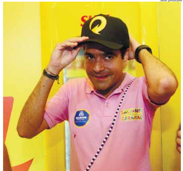
Gestão municipal nega qualquer irregularidade em contrato que foi válido por 3 anos