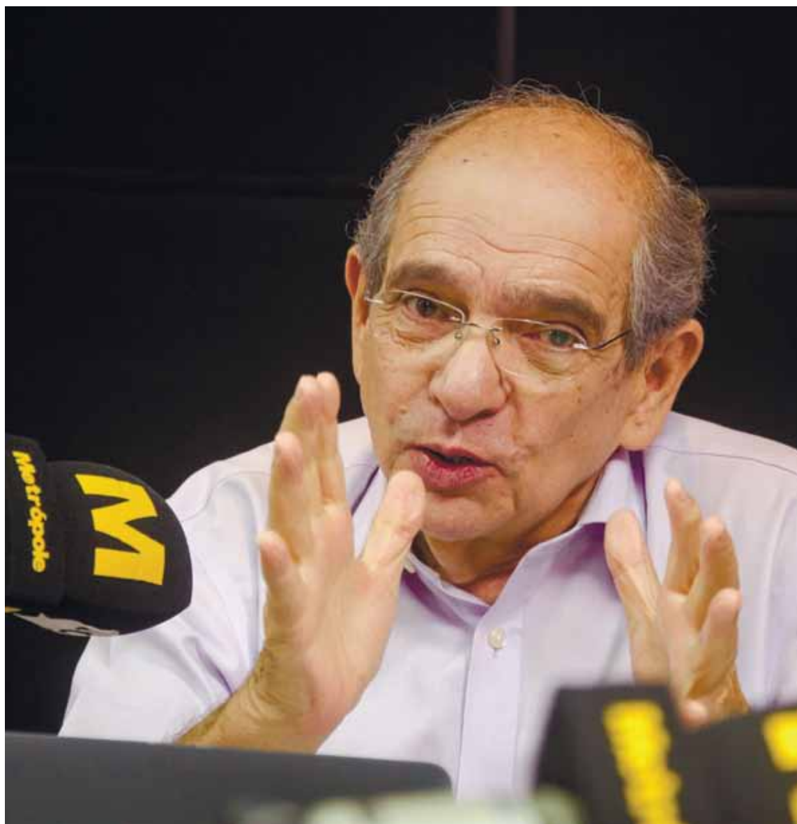
Comandado por MK, horário das 11h recebe convidados de relevância para a sociedade, do jeito que só a Rádio Metrôpole sabe fazer