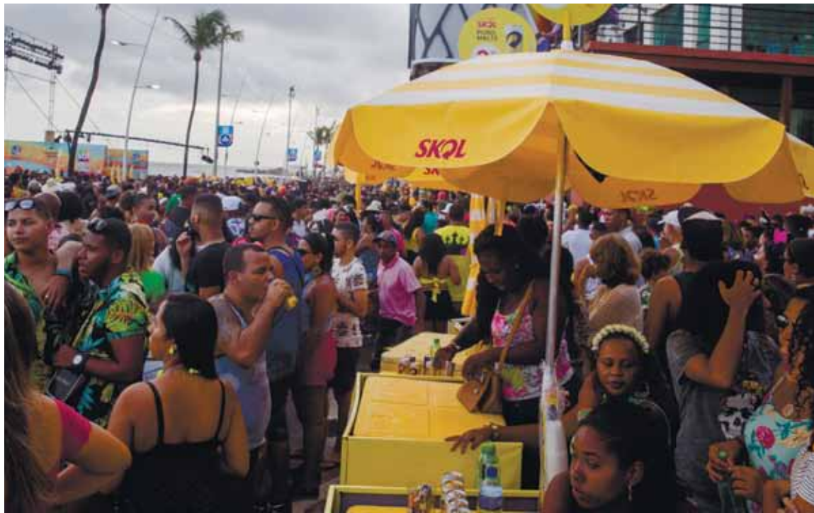
Marca da Skol, um dos produtos da Ambev, é única autorizada a aparecer todo circuito oficial da festa que é uma das mais populares do mundo

3 ANOS é a validade do contrato da gestão municipal com a Ambev