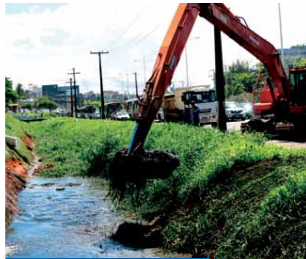
LIMPEZA DE 20 CANAIS