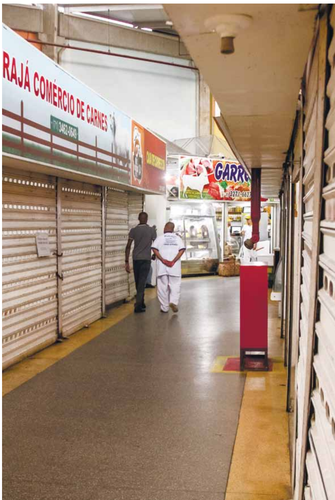
Boxes fechados passam aspecto de abandono ao local, que em outros tempos já foi muito movimentado e badalado na capital baiana