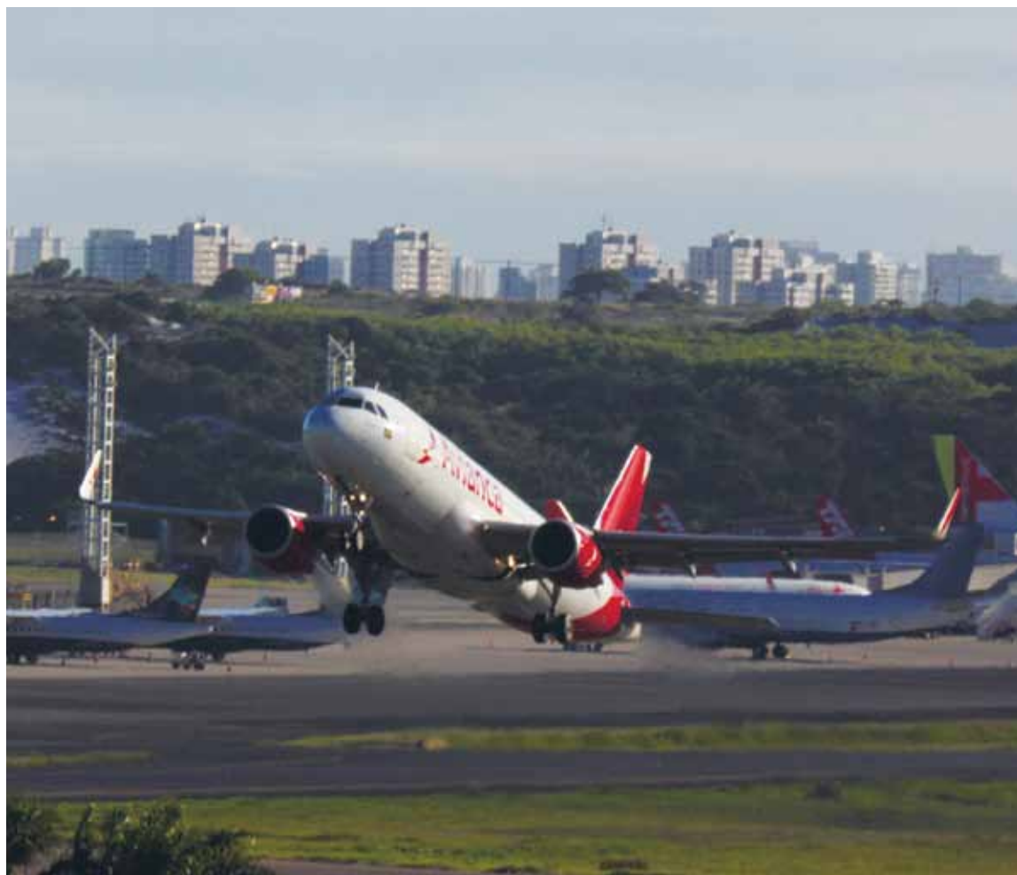
Em crise, aérea chegou a ter aeronaves arrendadas pela Justiça por conta das dívidas e dos atrasos de pagamentos aos funcionários

Na última sexta-feira (5), o pedido foi aprovado. Serão criadas seis subsidiárias, batizadas de Unidades Produtivas Isoladas (UPI). Cada uma dessas unidades terá um grupo de horários de pousos e decolagens nos aeroportos de São Paulo e Rio de Janeiro. No entanto, de acordo com a Agência Nacional de Aviação Civil (Anac), ainda não foi enviado nenhum pedido da empresa para emissão dos Certificados de Operador Aéreo (COA). A autorização é essencial para o plano de recuperação judicial.