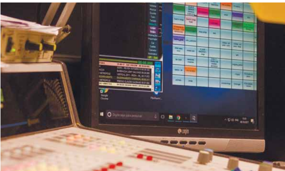
Das ondas do rádio para as telas: transmissão do YouTube ganha mais um reforço e terá o Sintonia exibido ao vivo, das 14h às 15h

Metrôpole estreia programa novo na próxima semana