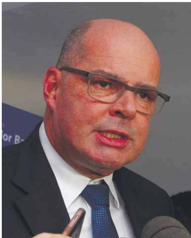
Aeroporto de Salvador mantém compromisso de informar aos passageiros sobre os voos

“Voos programados seguem de forma regular”