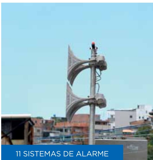
11 SISTEMAS DE ALARME