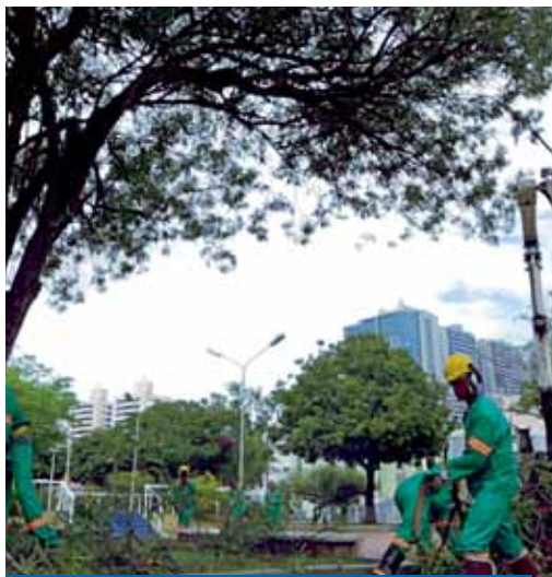
6.000 PODAS DE ÁRVORES