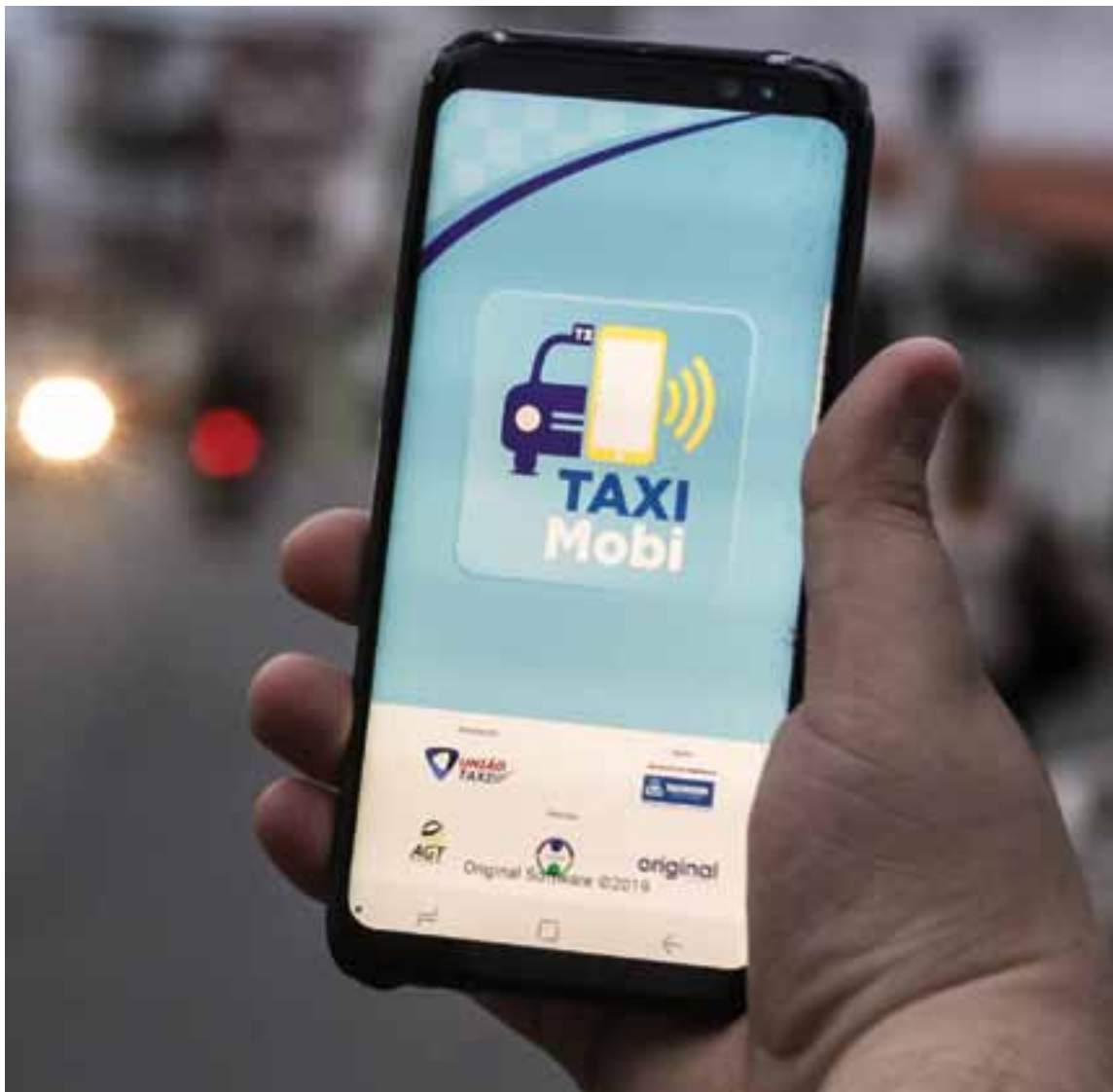
Táxi Mobi está disponível em lojas Android e Apple Store; motorista que adere paga apenas R$ 10 por mês para manutenção de serviço