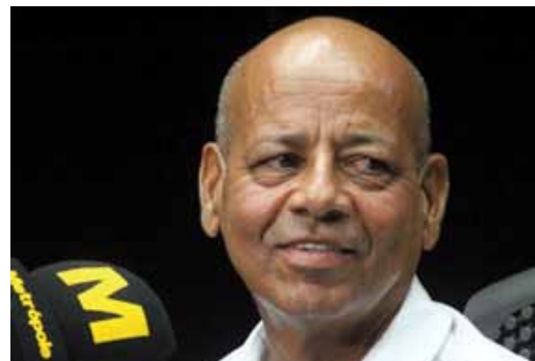
Representante dos guardadores aprovou criação de aplicativo para integrantes do sindicato

“Quando teve o chamamento público, os guardadores ficaram aterrorizados. Agora eles estão mais tranquilos, sabendo que vamos participar da renovação”, apontou.