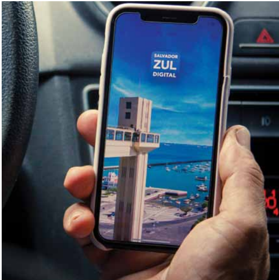
Hoje, mais de dez aplicativos para Android e iPhone possibilitam que cidadão pague online pela cartela da Zona Azul em Salvador

tão passando por um processo de validação com o sistema bancário para garantir maior segurança às transações. De acordo com Müller, até o final do mês, os cartões já serão aceitos. Segundo a Transalvador, até outubro deste ano, o papel não existirá mais para o registro do estacionamento rotativo. “O equipamento é muito similar a uma máquina de cartão de crédito e estará ligada à Transalvador. O usuário não precisa colocar o papel no parabrisa do veículo. Ao comprar, a informação já vai para a Transalvador. Quando a fiscalização chega, já está sabendo”, afirmou Müller. A solução tecnológica impediu também o desemprego de guardadores de carro.