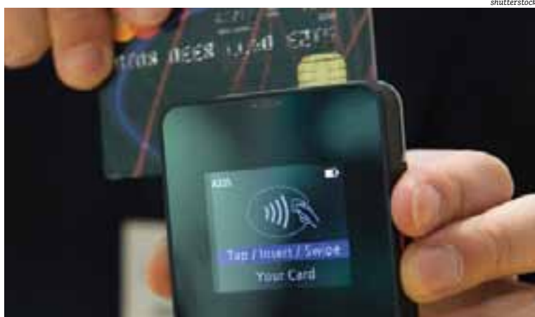
Redes de máquinas disputam mercado, mas falham na operacionalização do serviço