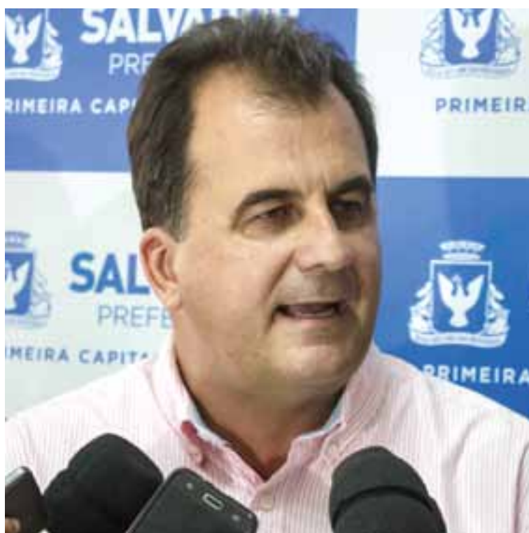
Para Mota, com investimento da prefeitura, aplicativo deve ter retorno melhor para motorista