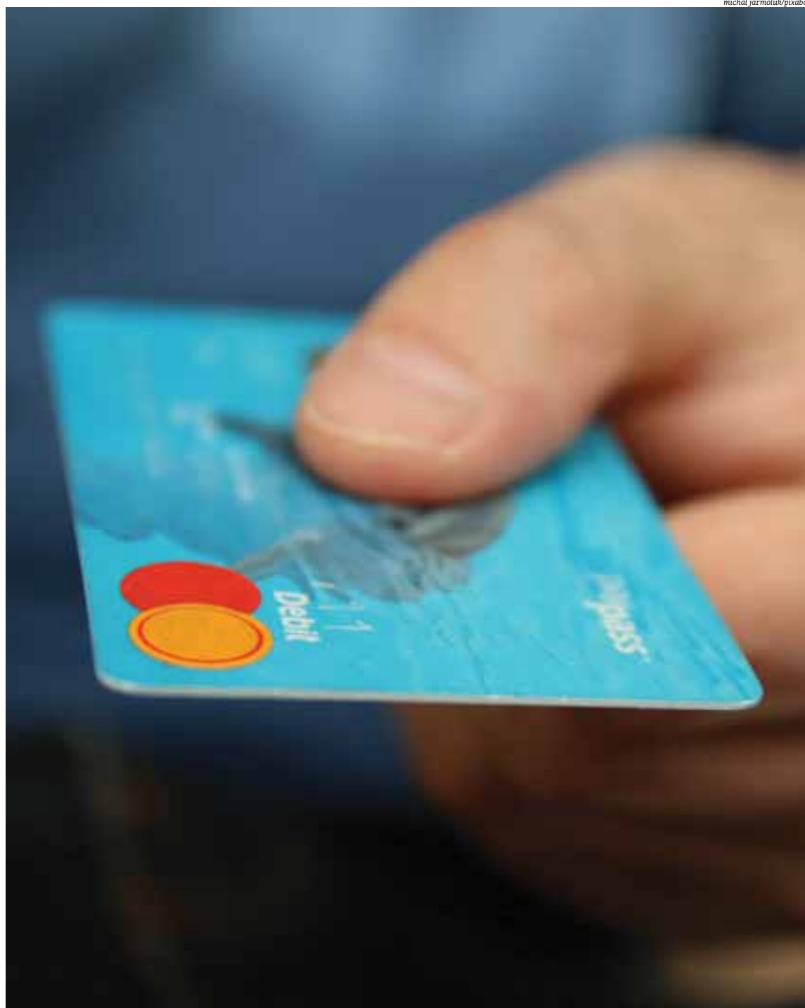
Utilizado por grande parte da população, cartão magnético traz facilidade, mas pode também mascarar os custos para o empresário