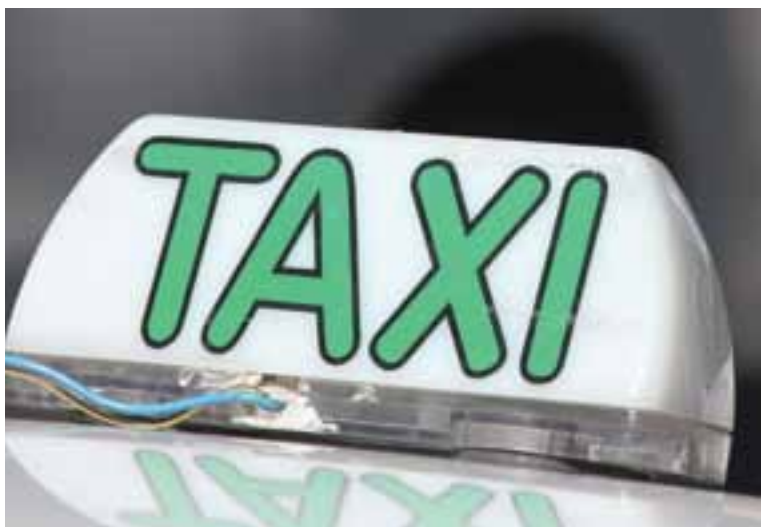
Taxistas amargam crise, mas esperam que situação melhore com avanço tecnológico