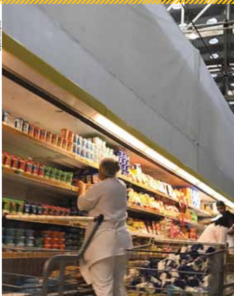
Varejo é principal beneficiado por uso de “dinheiro de plástico”; setor também sofre com erros

Somente nos dois primeiros meses deste ano, de acordo com levantamento realizado pela plataforma Finanças 360º, empresários do setor conseguiram recuperar um total de R$ 11,5 milhões em vendas efetuadas e não repassadas. Carneiro explica que, desde o microempresário, todos podem ser vítimas dos erros. “Nossa taxa de identificação de divergência é de 78%. Então é algo bastante relevante no final”, ressalta.