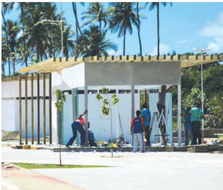
Novos quiosques começaram a ser instalados na praia de Piatã, que já foi revitalizada

Apesar da grande espera, a opinião do baiano não foi levada em consideração pela Prefeitura na hora da escolha do modelo dos quiosques, que só foi apresentado no final de agosto. Questionado sobre a falta de diálogo, o secretário de Cultura e Turismo garante que não havia a necessidade de consultar a opinião pública. “A licitação foi feita no ano passado, foi escolhido um modelo que se adaptasse bem a Orla(...) Para esse tipo de projeto não há diálogo com a população, é uma decisão da prefeitura”, afirma.