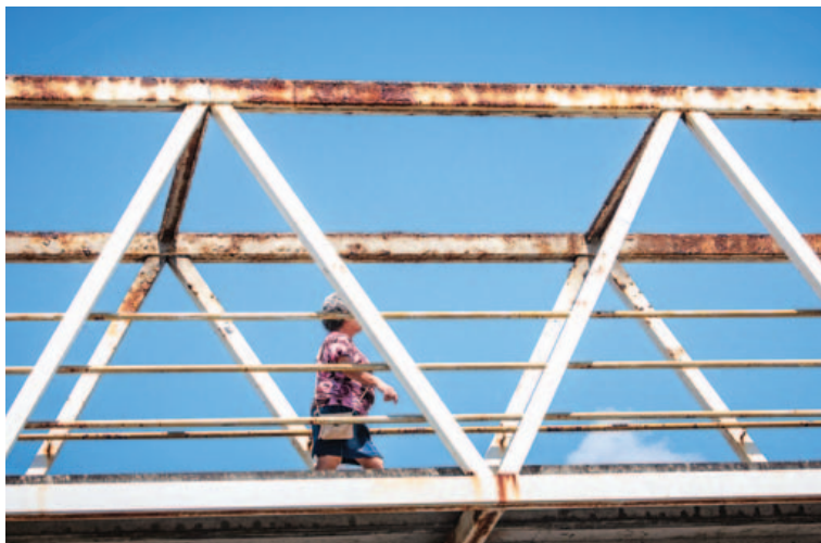
Passarela em frente ao Hiper Bompreço da Estrada do Coco também acumula reclamações