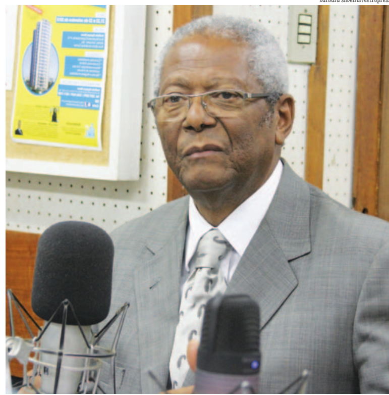
Brito argumentou ser juridicamente impossível o pedido de mudança no regimento da Casa