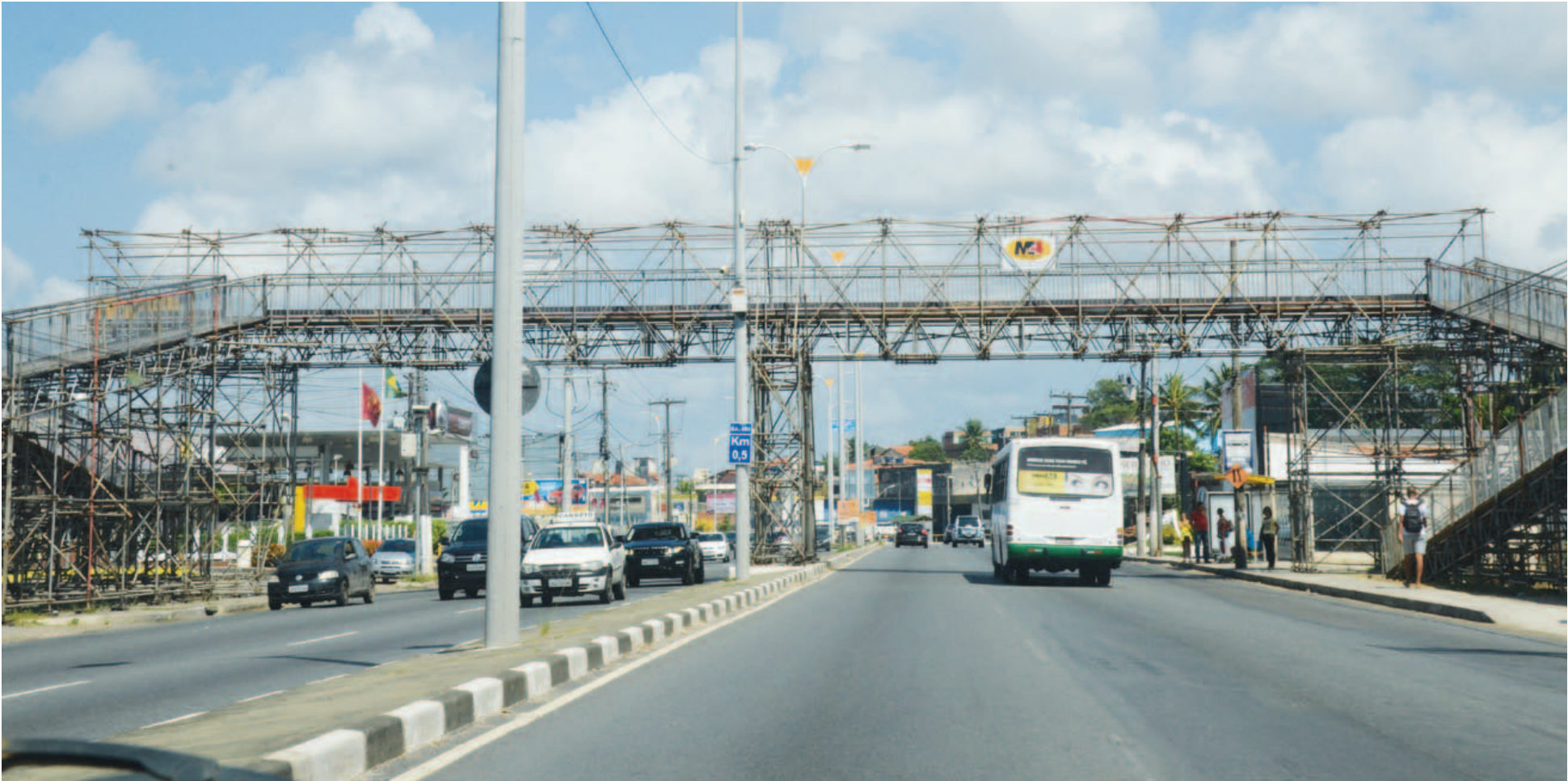
Passarela provisória foi construída para ser uma solução momentânea para a travessia de pedestres na BA-099, mas foi ficando, ficando e, segundo a prefeitura de Lauro de Freitas, não tem prazo para ser substituída tão cedo

Com passarela provisória e outra deteriorada, não está fácil ser pedestre na cidade de Lauro de Freitas