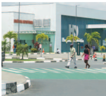
Segundo o secretário, saúde tem sido uma das prioridades do governo de Rui Costa

financeiro às equipes médicas e hospitais, até o investimento em equipamentos. De acordo com o secretário, a verba será usada também para custear exames e medicamentos de alto custo na capital e interior do estado. “Com determinação e trabalho todos os desafios podem ser superados”, afirmou.