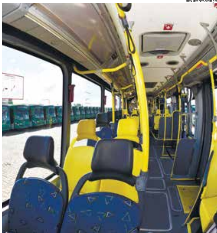
Na avaliação do MP, município tem déficit de 33 ônibus no sistema de transporte urbano

De acordo com o MP, a capital baiana possui um déficit de 33 veículos no sistema de transporte.