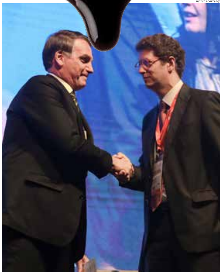
Responsável por acionar plano de emergência, ministro do Meio Ambiente fez pouco caso