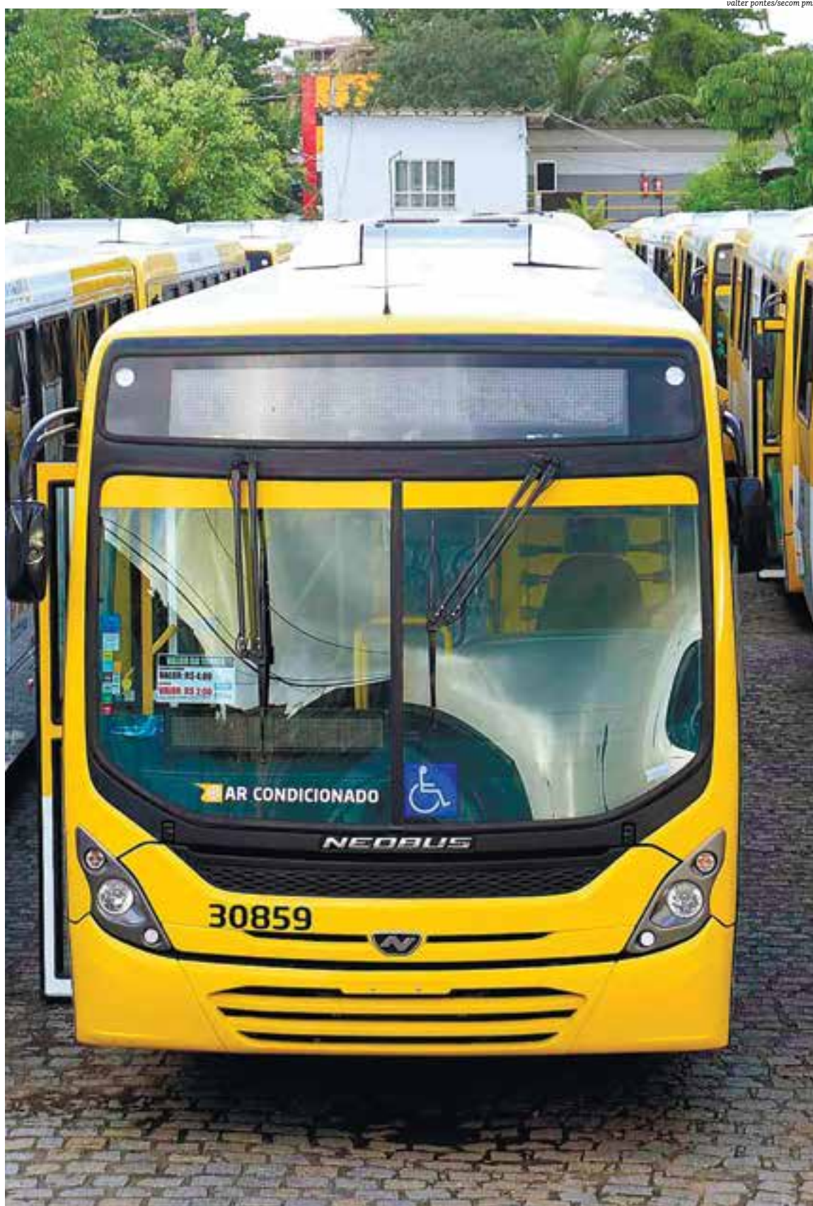
CSN pede novo prazo e atrasa mais uma vez a entrega dos 81 ônibus com ar-condicionado na cidade; MP critica demora para cumprimento

dos Serviços Públicos de Salvador (Arsal) e da Câmara Municipal. Após uma nova tentativa, a empresa pediu um novo prazo para a entrega completa dos 81 ônibus com ar-condicionado. Nova frota deveria rodar até o fim do ano, mas o atraso já está consumado.