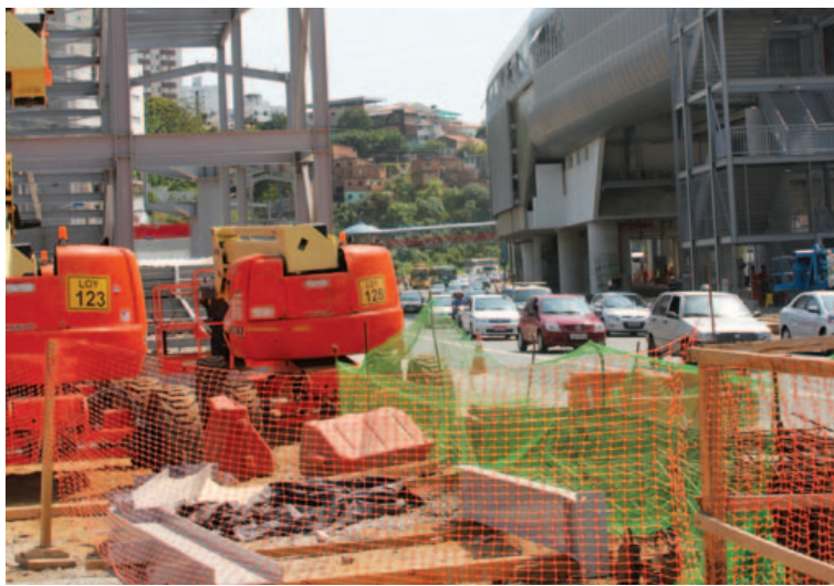
Segundo subsecretário, Prefeitura não abrirá mão das passarelas de Lelé em hipótese alguma

“Já comunicamos à CCR que a Prefeitura não aprovará, em hipótese alguma, a montagem desse tipo de passarela. Tomamos como surpresa quando fomos procurados pela CCR. Todas as passarelas são no padrão de Lelé. Disso a Prefeitura não abre e não abrirá mão”, declarou.