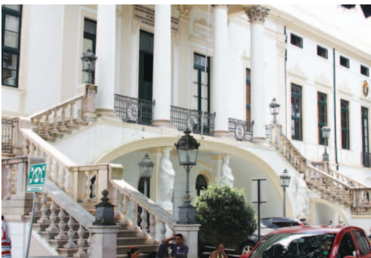
Santa Izabel afirma estar com a imagem maculada pela denúncia e vai processar médico

“Este médico vai ser processado. O Hospital Santa Izabel está sendo sua imagem maculada, então temos o direito de questioná-lo judicialmente. Não resta outra opção porque ele nunca nos procurou. Não há nenhuma evidência disso”, afirmou.