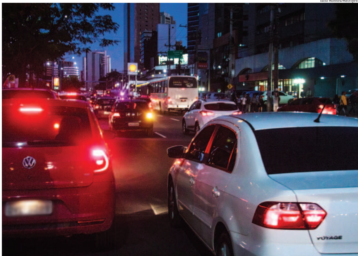
Salvador terá menos um modal para melhorar a situação do trânsito, uma vez que o esperado BRT não deve mais sair

No momento, porém, Dilma enfrenta uma greve em várias universidades federais. Algumas delas, como a Universidade Federal da Bahia, já passam dos quatro meses com os professores em greve.