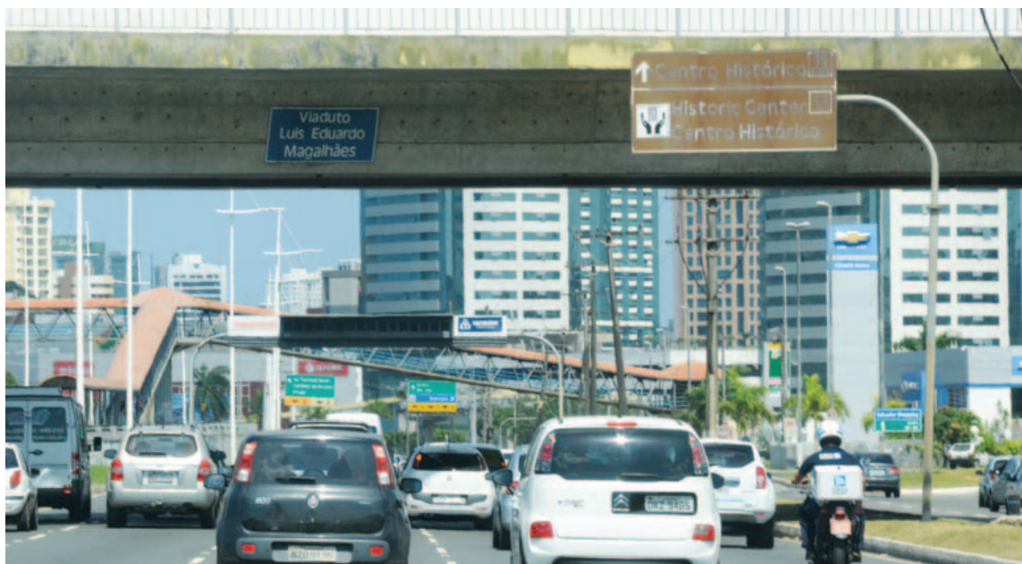
Quase sempre apagadas, placas não só não cumprem a função de orientar como ainda deixam a cidade mais feia e com aspecto sujo