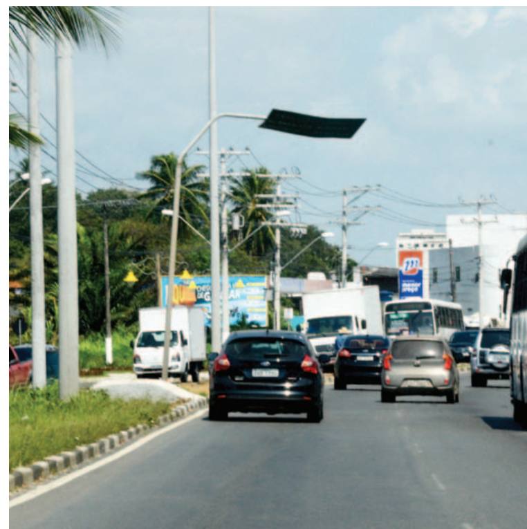
É comum ver em Salvador placas de sinalização e orientação viradas, sem servir para nada