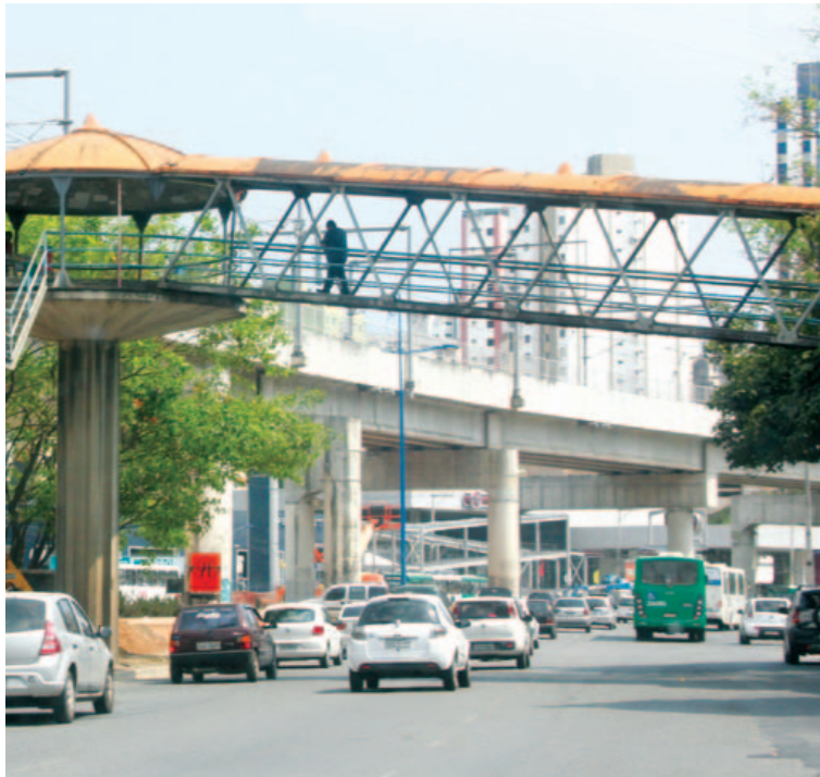
Tecnologia das passarelas criadas por Lelé inspirou outras cidades Brasil a fora

“A posição da Prefeitura é muito clara: esse tipo de diálogo que a CCR alega estar tendo com a Prefeitura, do nosso ponto de vista, é para achar uma solução que seja de viabilizar o modelo padrão de passarela que é, de fato, utilizado na cidade. E esse modelo é o de Lelé, que conseguiu unir arte e tecnologia ao mesmo tempo”, disse.