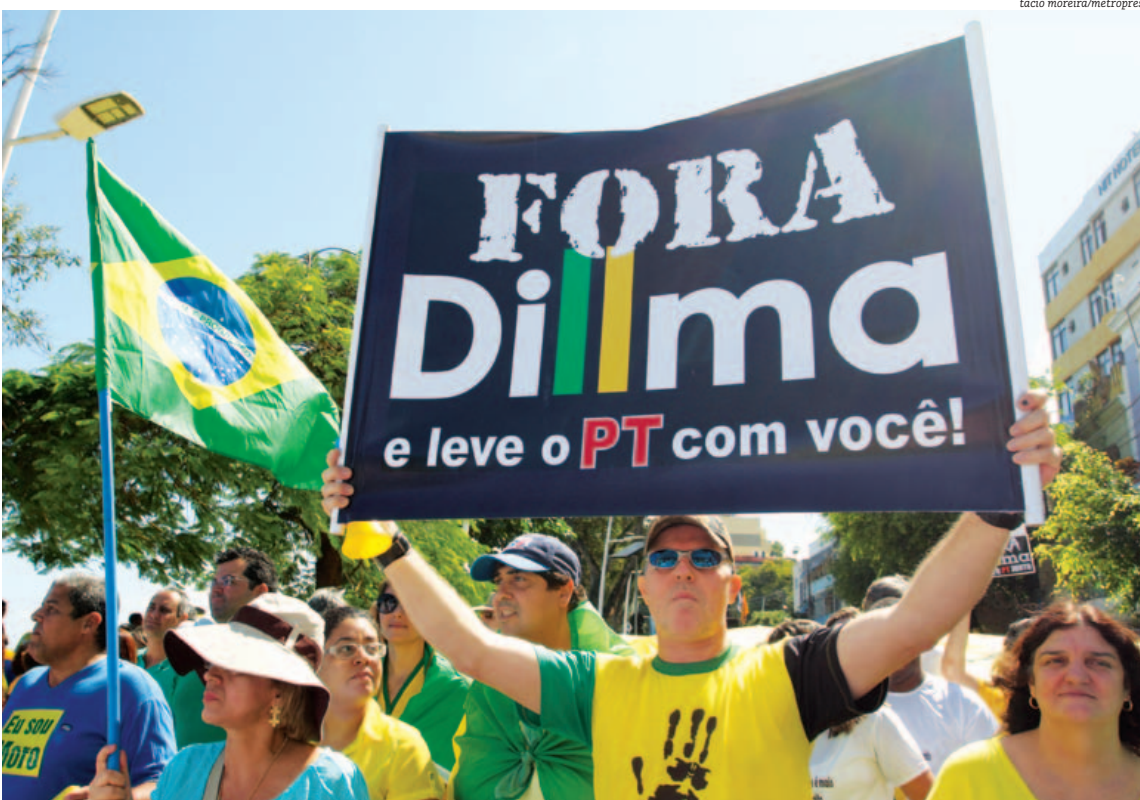
A presidente comentou sobre os movimentos que pregam sua saída e citou “variantes golpistas” contrárias aos ideais democráticos

faz um serviço para a democracia tentando encurtar a chegada ao governo. O único método para chegar ao governo é o voto nas urnas. Portanto, a democracia brasileira é forte o suficiente para impedir que variantes golpistas tenham espaço no cenário político”, destacou.