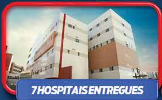
7 HOSPITAIS ENTREGUES