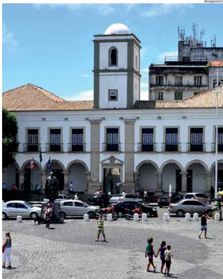
Renovação de quadros da Câmara caiu drasticamente ao longo dos últimos anos de eleição

foi batida. Na eleição municipal de 2004, a renovação na Câmara Municipal de Salvador foi de cerca de 43%. Na eleição seguinte, em 2012, com a ascensão de ACM Neto ao posto de prefeito, 56% dos integrantes da Casa foram modificados. Na reeleição de Neto, a renovação caiu drasticamente para 35% dos quadros.