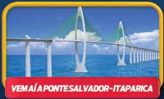
VEM AÍ A PONTE SALVADOR-ITAPARICA