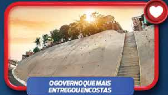
O GOVERNO QUE MAIS ENTREGOU ENCOSTAS