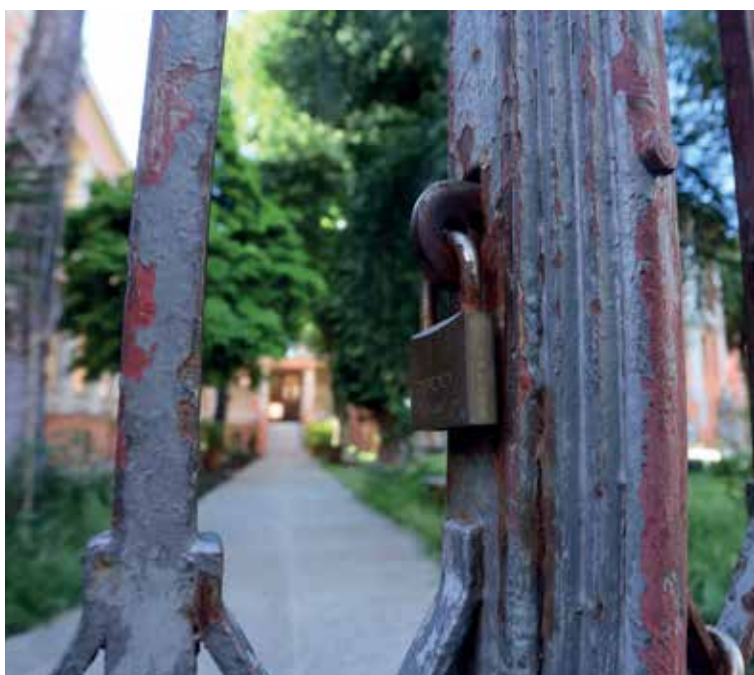
Portão vive fechado e público é impedido de acessar área que guarda vasto material histórico

De acordo com apuração do MPF, o imóvel encontra-se em péssimo estado de conservação, demandando reparos emergenciais, bem como reforma completa, o que levou o órgão a ajuizar ação civil pública, em 2017, para evitar o seu arruinamento. Na sentença, assinada em 24 de outubro, a Justiça Federal determina que o Iphan apresente, no prazo de 120 dias, projeto para execução das obras de conservação de restauração dos imóveis, o qual deve ser elaborado em conjunto com a Ufba e executado. Determina, ainda, que sejam realizados serviços emergenciais no prazo de 60 dias, sob pena de multa de R$ 5 mil por dia de descumprimento.