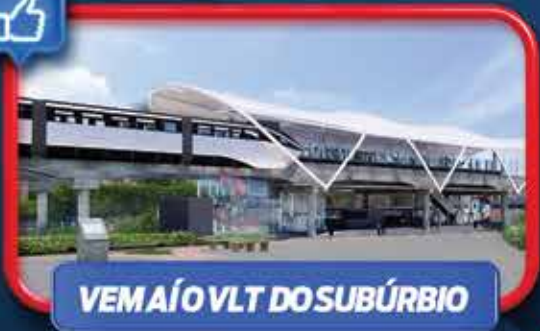
VEM AÍ O VLT DO SUBÚRBIO