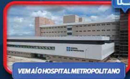
VEM AÍ O HOSPITAL METROPOLITANO