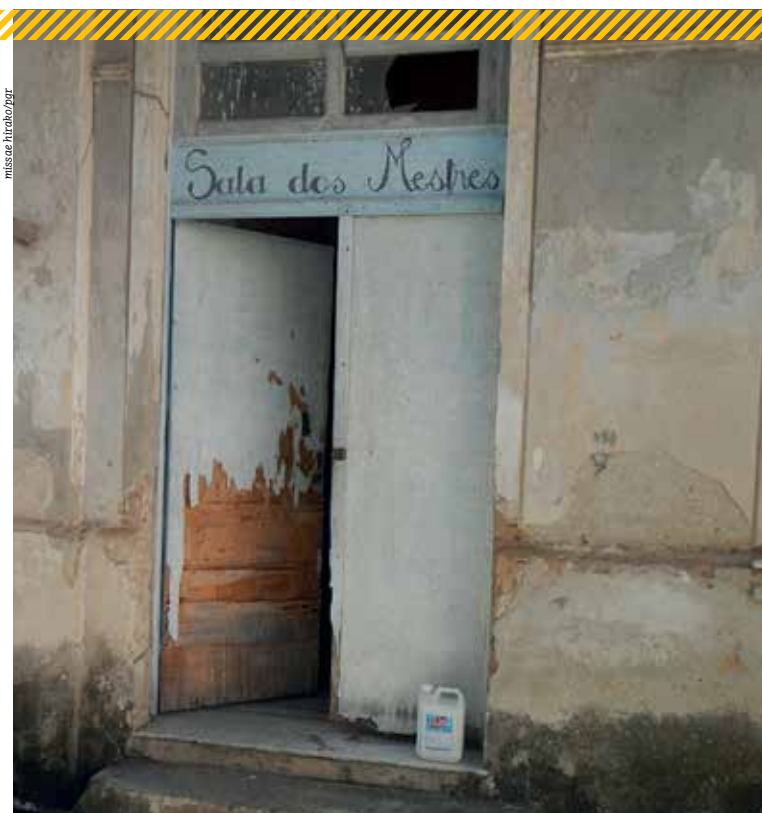
Porta da Sala dos Mestres é retrato claro do descaso do Poder Público com espaço

Situação é precária, aponta Procuradora da República