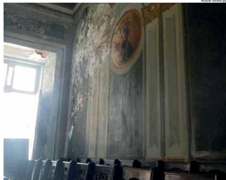
Salão Nobre amargou anos e anos de descaso antes de reforma que resolveu situação

Prado Valadares, Pirajá da Silva e Gonçalo Muniz. Além disso, os salões da faculdade serviram de palco para acirradas discussões, agitados debates e até mesmo lutas armadas, que marcaram decisivamente os rumos tomados pelo contexto social e político nacional - como na Guerra do Paraguai, na Guerra de Canudos e na Segunda Guerra Mundial.