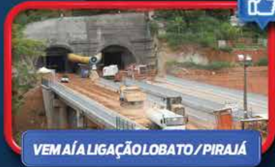
VEM AÍ A LIGAÇÃO LOBATO/PIRAJÁ