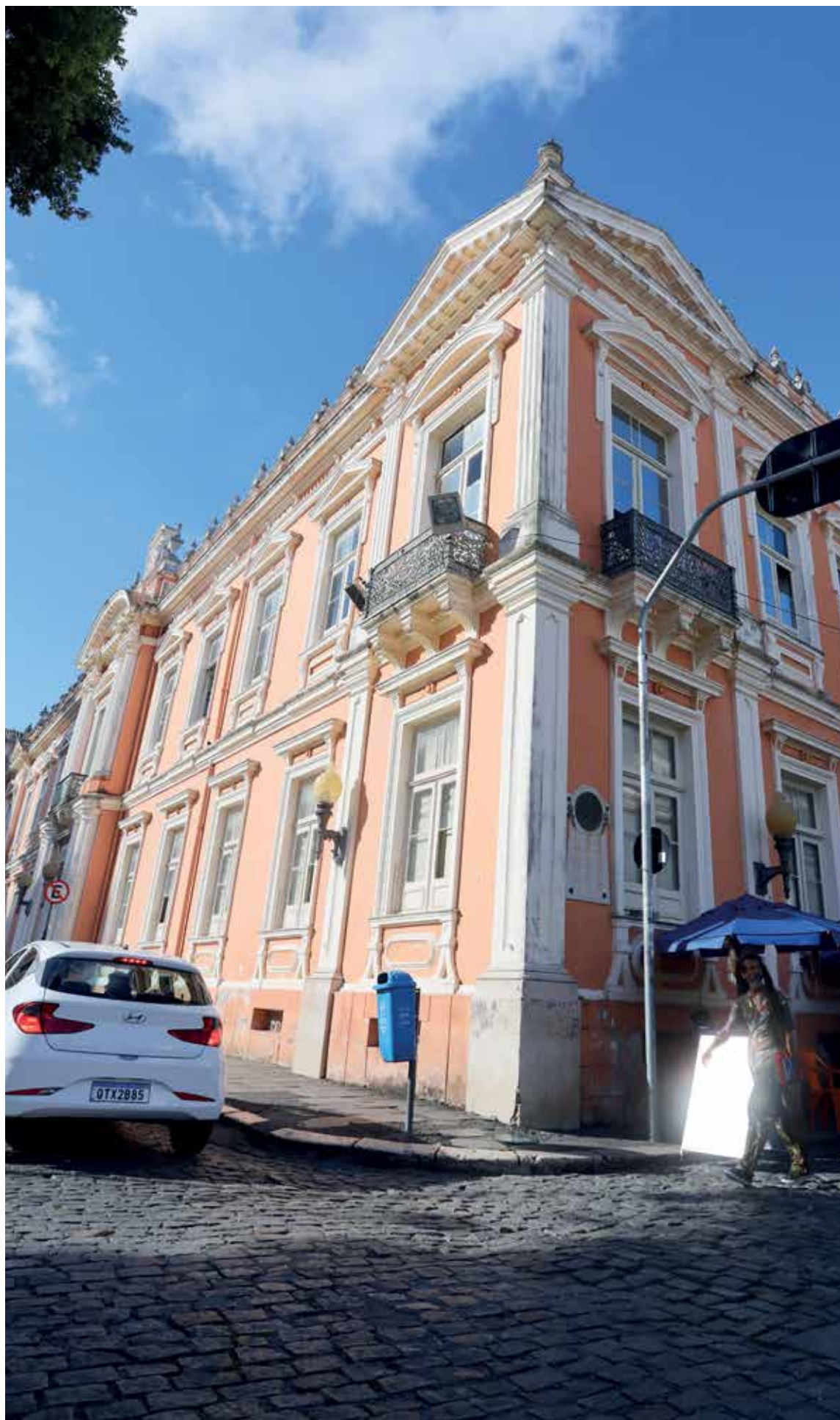
Prédio no Terreiro de Jesus tem aparência boa, mas interior preocupa diversas autoridades que cuidam do patrimônio histórico da cidade

“Nossa intervenção foi no sentido de manter a história do local”