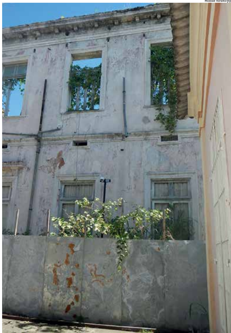
Vegetação já tomou conta de local, que aguarda que Iphan cumpra decisão judicial

Marco na construção do saber e da história do Brasil, o prédio situado no Largo do Terreiro de Jesus é tombado pelo Instituto do Patrimônio Artístico e Histórico Nacional (Iphan) – não que isso garanta muita coisa, tendo em vista o estado de miséria atual. O processo foi concluído em dezembro de 2015. O tombamento reconhece o valor histórico do edifício e a história do ensino da medicina no país, além de seu valor artístico e arquitetônico. O atual edifício foi construído em 1905 após o incêndio do prédio anterior, o Colégio dos Jesuítas, que fora sede da primeira Faculdade de Medicina do Brasil, criada em 1908.