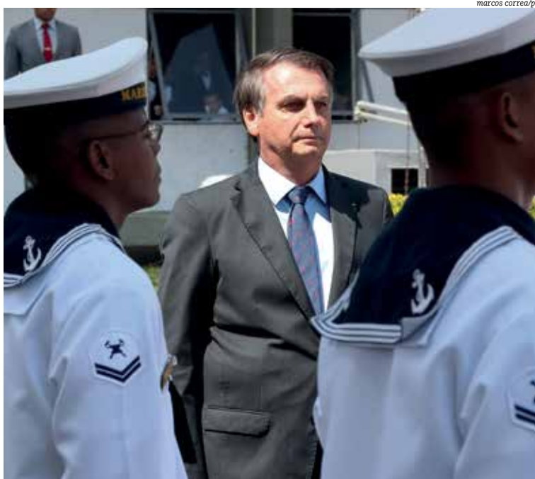
Governo federal tenta resolver situação do INSS com convocação de militares do Exército