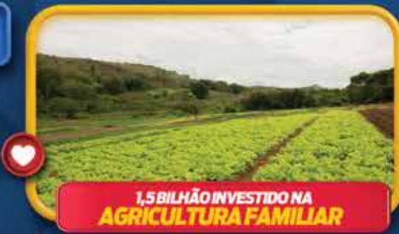
1,5 BILHÃO INVESTIDO NA AGRICULTURA FAMILIAR