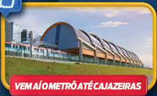
VEM AÍ O METRÔ ATÉ CAJAZEIRAS