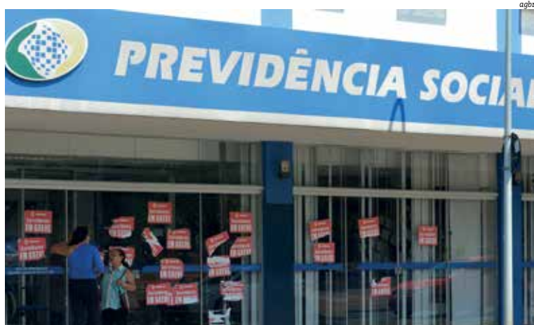
Enquanto crise não é solucionada, fila de pedidos no INSS ultrapassa 2 milhões de pedidos

Outras reportagens que mereceram destaque foram as que apontaram o caos no INSS, provocado pela política governamental do ministro da Economia, Paulo Guedes, e a que relatou o caos autorizado pela portaria do Instituto do Patrimônio Histórico e Artístico Nacional (Iphan), que fez novas determinações em uma área que vai das imediações do Yacht Clube da Bahia ao Cristo da Barra, podendo gerar um prejuízo de R$ 400 milhões no município.