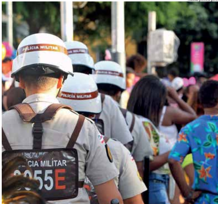
Atuação da Polícia Militar no Carnaval de 2020 foi exaltada por comandante-geral

Brandão disse ainda que o fato de a polícia abordar uma grande quantidade de pessoas negras ocorreria porque a maioria da população na Bahia seria negra. “Apesar de que, na Bahia, grande parte da população é negra. Esse negócio de ‘abordar preto’. Nós abordamos grande quantidade de pessoas negras, como eu, moreno, preto, não sei a forma como a pessoa, define. Porque muitas das pessoas mais escuras cometem delitos. Por isso que você vê: ‘Nos presídios só tem pessoas pretas’. Ô, a Bahia é preta? É diferente. Vê no Rio Grande do Sul, em Santa Catarina, você vai ver lá”, disse o comandante da PM-BA.