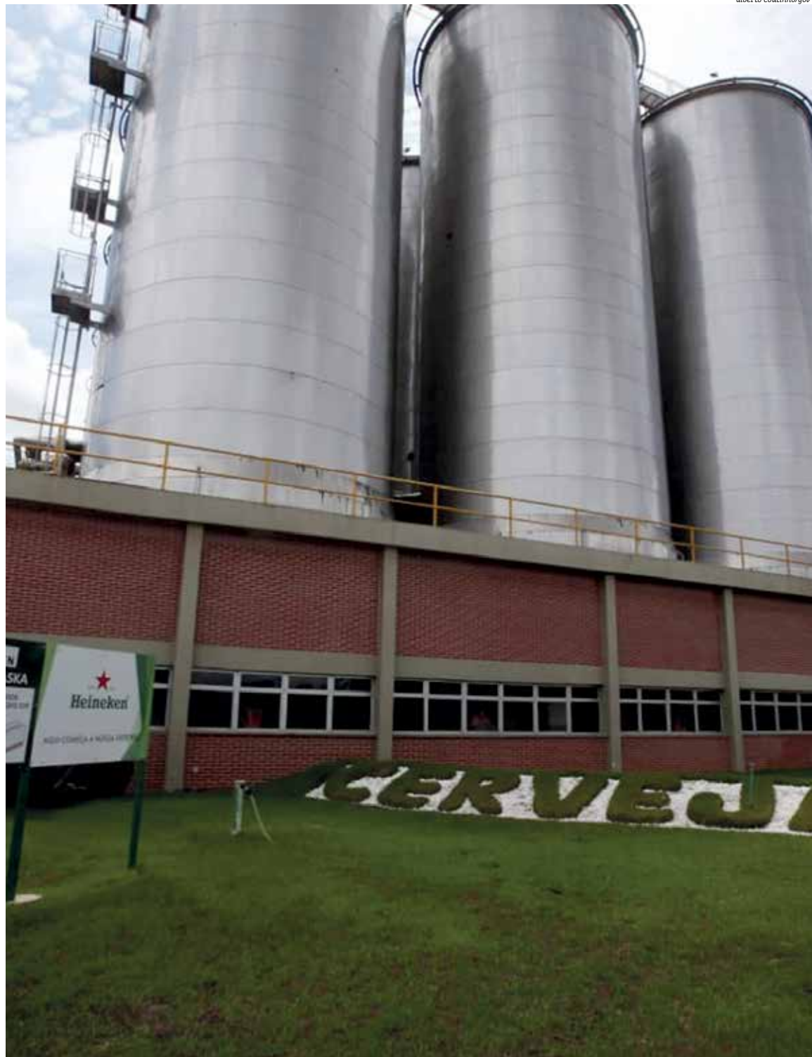
Sede da empresa em Alagoinhas ajuda a movimentar economia da cidade e é a maior fábrica da empresa no Norte/Nordeste do país