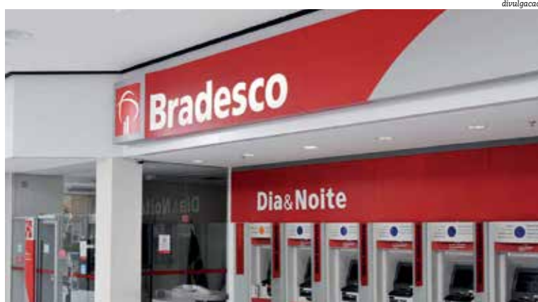
O Banco Bradesco foi a segunda instituição financeira do país em lucro: R$ 22,6 bilhões

O maior lucro entre os grandes bancos em 2019 foi o do Itaú, que registrou ganhos de R$ 26,583 bilhões em 2019. O Bradesco registrou um lucro líquido R$ 22,6 bilhões no ano passado, ficando com a segunda posição no ranking. Já Banco do Brasil reportou lucro líquido contábil de R$ 18,16 bilhões e o Santander teve lucro de R$ 14,181 bilhões.