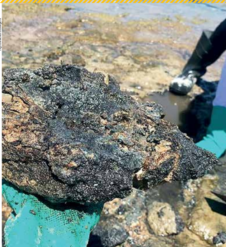
Preso nas pedras, óleo endureceu e remoção dificultou trabalho de voluntários nas praias

listas e ONGs, não houve uma conclusão definitiva de onde o óleo partiu originalmente. No Congresso, foi instalada uma Comissão Parlamentar de Inquérito (CPI) para apurar os responsáveis. Apesar dos debates, ninguém foi indiciado ainda.