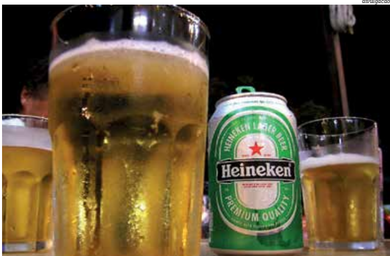
Cervejaria tem mais de R$ 200 milhões em investimentos; processo pode criar problemas