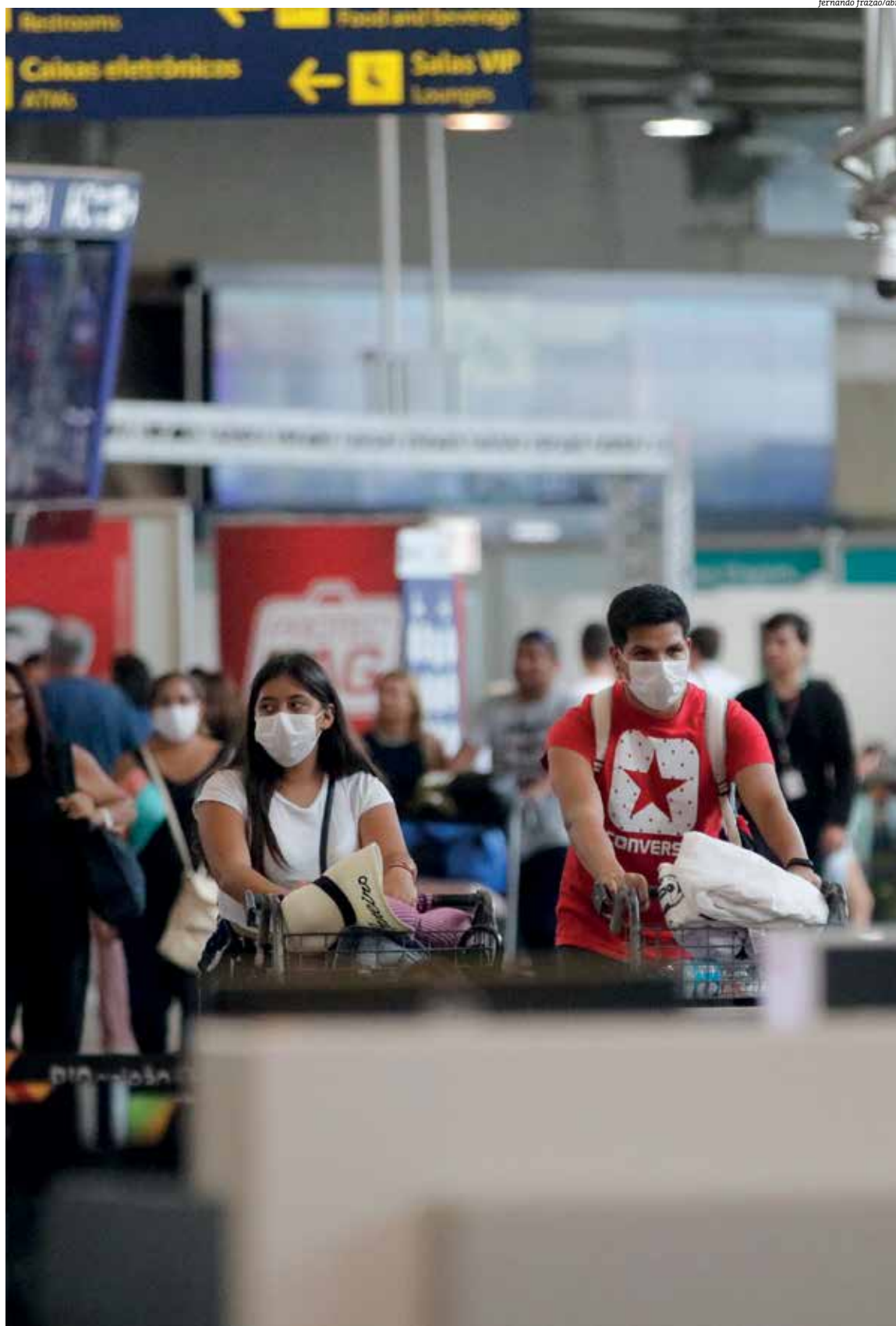
Passageiros transitam por aeroportos com máscaras por medo de contágio da doença, que já matou mais de três mil pessoas só na China

Vigilância em Saúde da Bahia (Cievs-BA) em conjunto com os centros municipais. O diagnóstico do coronavírus é feito com a coleta de materiais respiratórios. Em caso de suspeita, é necessária a coleta de duas amostras, que serão encaminhadas com urgência para o Laboratório Central de Saúde Pública (Lacen-BA).