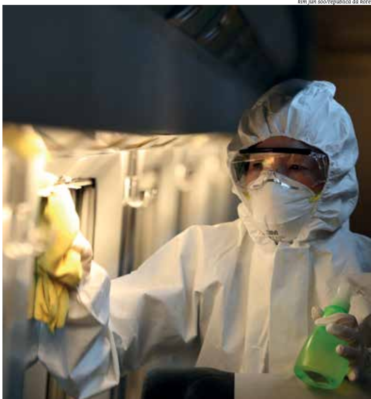
Autoridades asiáticas tentam conter epidemia, que já atingiu níveis globais de contágio