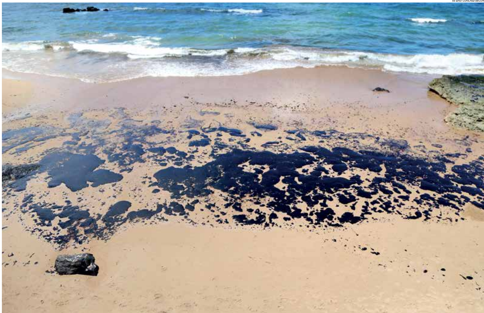
Manchas de óleo que surgiram em Salvador foram recolhidas, mas fragmentos continuam surgindo em menor quantidade nas praias soteroportanas; voluntários continuam atuando

O maior desastre ambiental do país ainda deixa marcas no litoral do Nordeste. Após começar a surgir em outubro do ano passado, o óleo continua causando estragos em praias da Bahia. Em todo o estado, meses depois do surgimento, o material pode ser visto em meio às pedras e algas, como é o exemplo de Itacimirim. No último final de semana, voluntários do grupo “Guardiões do Litoral” retiraram manchas de óleo da praia que, somadas, contabilizaram 2 toneladas de óleo. A substância já se encontrava presa às pedras, comprometendo o alimento e a vida de peixes e crustáceos. Segundo o grupo, também foram registradas manchas de óleo na praia do Farol da Barra e em Serra Grande, próxima a Itacaré.