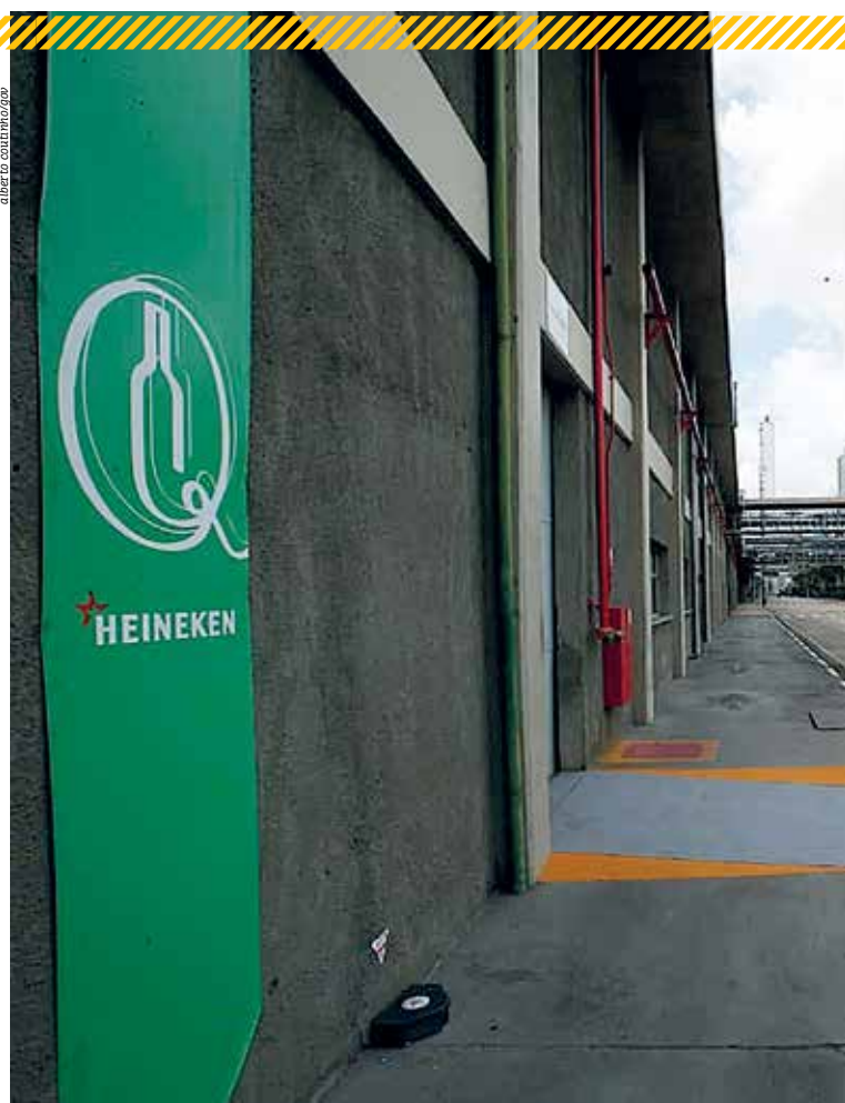
Companhia chegou ao Brasil em maio de 2010, após a aquisição de cerveja do Grupo Femsa

Em 2017, adquiriu a Brasil Kirin Holding S.A (Brasil Kirin), tornando-se o segundo player no mercado brasileiro de cervejas. O grupo gera mais de 13 mil empregos e tem 15 unidades produtivas no país.