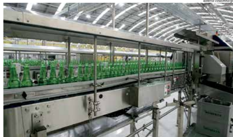
Além de cerveja, empresa produz também água, refrigerantes e sucos em fábrica na Bahia