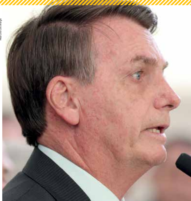
Bolsonaro rompe com Moro e diz que ex-ministro preferiu própria biografia ao invés do país

Presidente acusa ex-juiz da Lava Jato de mentir contra ele