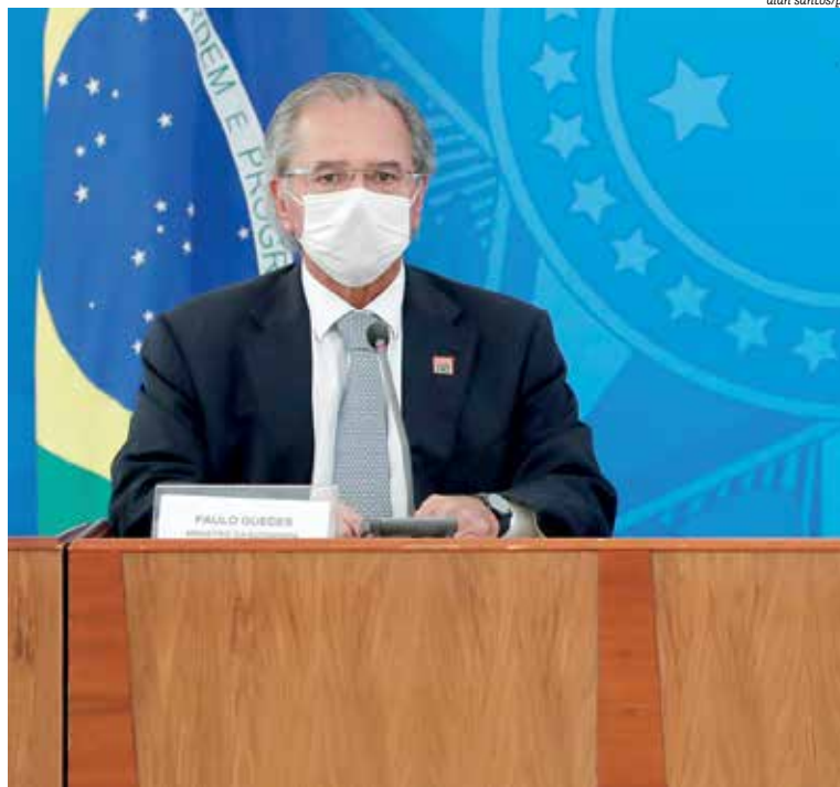
Ministro da Economia, Guede é alvo de críticas de Xico Sá: ‘Não salva o Brasil’

Para o escritor, a pandemia deixará lições para o Brasil. “Vai ser uma grande lição esse debate entre estado mínimo e estado master que a pandemia veio trazer. Mostra, na cara, que quem vai salvar o pobre, é o Estado, o SUS. Não vai ser, hora nenhuma, a turma de Paulo Guedes, a Faria Lima, que vai salvar o problema. Quem começou a lucrar em plena pandemia foi o sistema bancário”, acrescentou. Para ele, o SUS é o grande destaque. “Não é essa turma que está salvando. É a grande conquista da Constituição de 88, onde FHC fez o marco institucional e o governo Lula começou a botar dinheiro”, disse.”