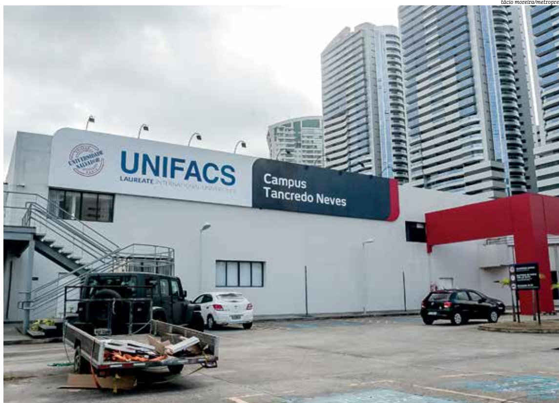
Uma das mais caras da Bahia, universidade tem recebido diversas reclamações ao longo dos anos; pandemia incrementou repertório