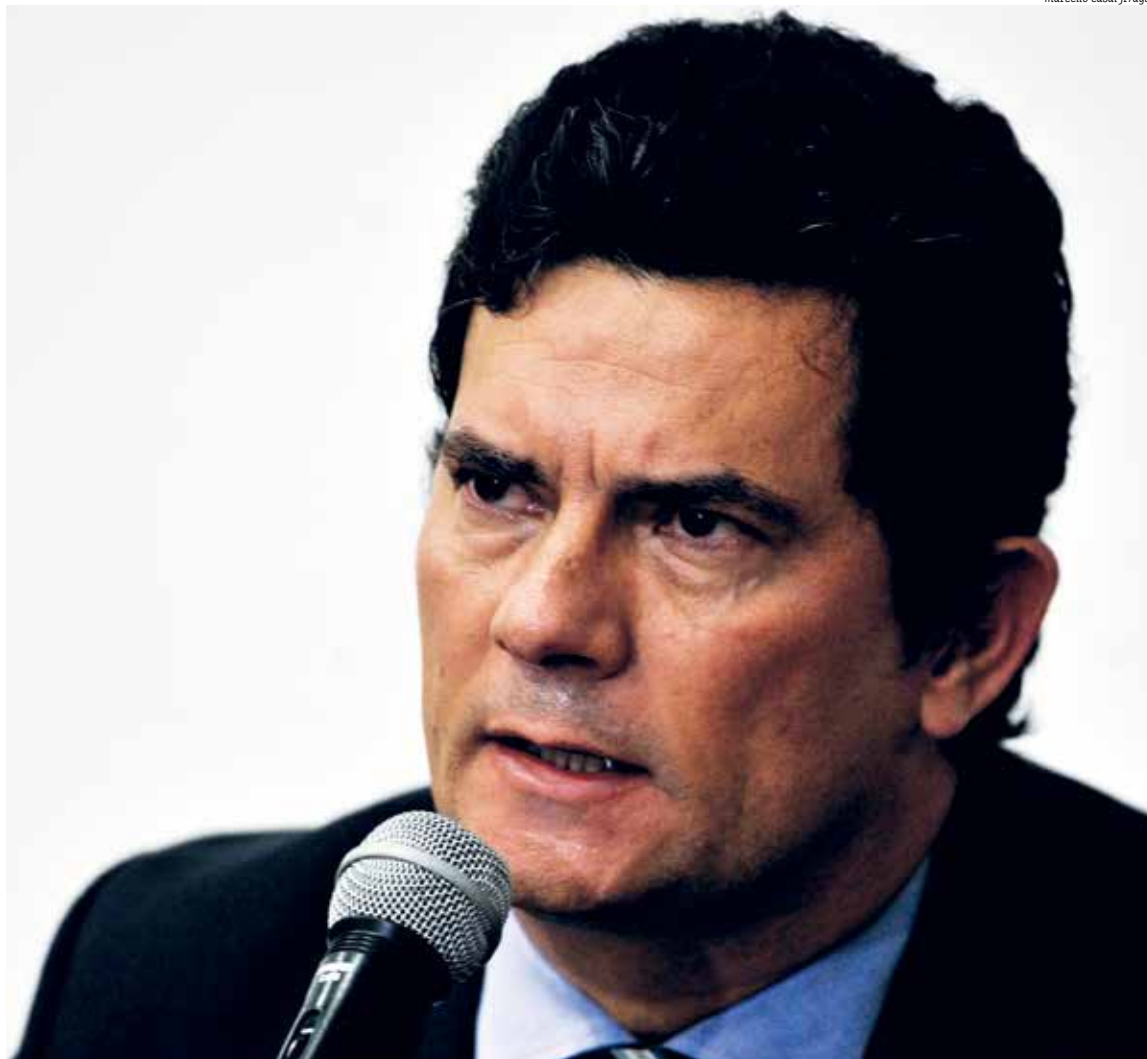
Ex-juiz da Lava Jato aponta interferência do presidente na PF e tentativa de blindar filhos de investigação por suspeitas de corrupção