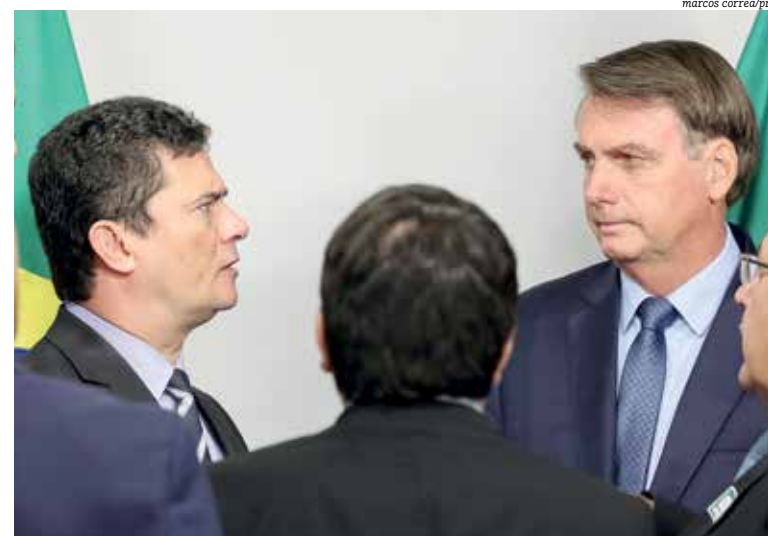
Anunciado como superministro, Moro deixa governo com série de embates com presidente

leixo da diretoria-geral da PF. O inquérito que vai investigar o caso foi aberto pelo ministro Celso de Mello, decano da corte, a pedido do procurador-geral da República, Augusto Aras, após as falas do ex-juiz de Curitiba. Com isso, Moro prestará depoimento com as informações sobre a suposta interferência do presidente e, posteriormente, será definido se um processo vai ser aberto ou não.