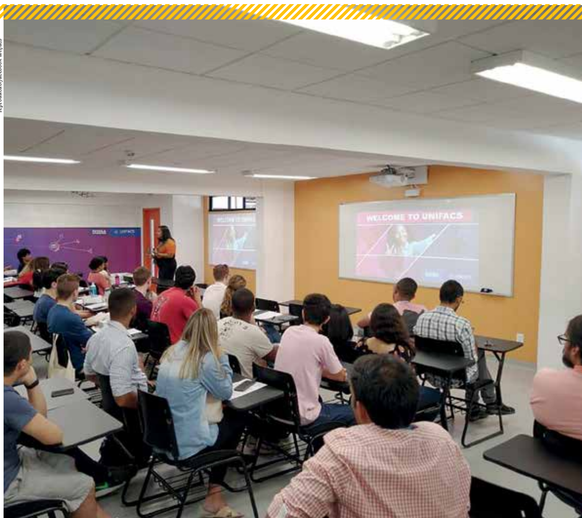
Com pandemia do novo coronavírus, instituição passou a ter aulas apenas online; mudança não foi bem recebida por alunos

Unifacs acumula queixas de alunos durante pandemia