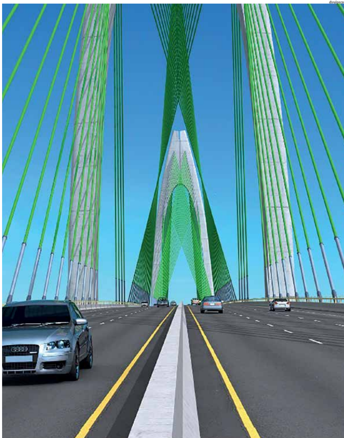
Projeção da Ponte Salvador-Itaparica é a coisa mais palpável que existe do projeto vendido pelo governo baiano a investidores