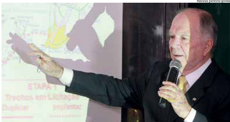
Vice-governador mantém otimismo, mesmo com tudo indicando que “vai entrar água”