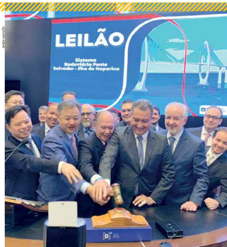
Leilão da ponte Salvador-Itaparica na Bolsa de Valores foi momento de euforia na Bahia