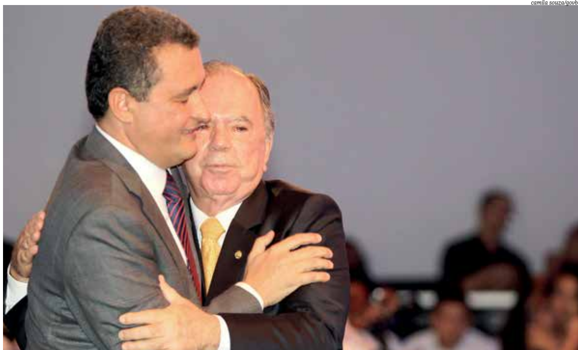
Leão acredita que pode ser governador -- cita também o senador Otto Alencar -- e projeta entregar equipamento que ainda está no papel

é o tempo que deve demorar as obras, se elas saírem do papel