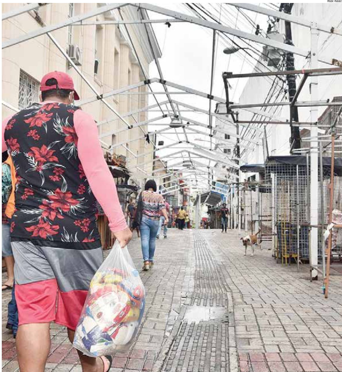
Avenida Joana Angélica tinha alta movimentação e, por isso, registrou mais de 15 casos somente nos primeiros dias deste mês