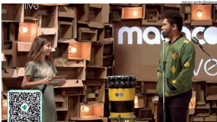
Distanciamento social é uma das premissas da Macaco Live; segurança e diversão na casa