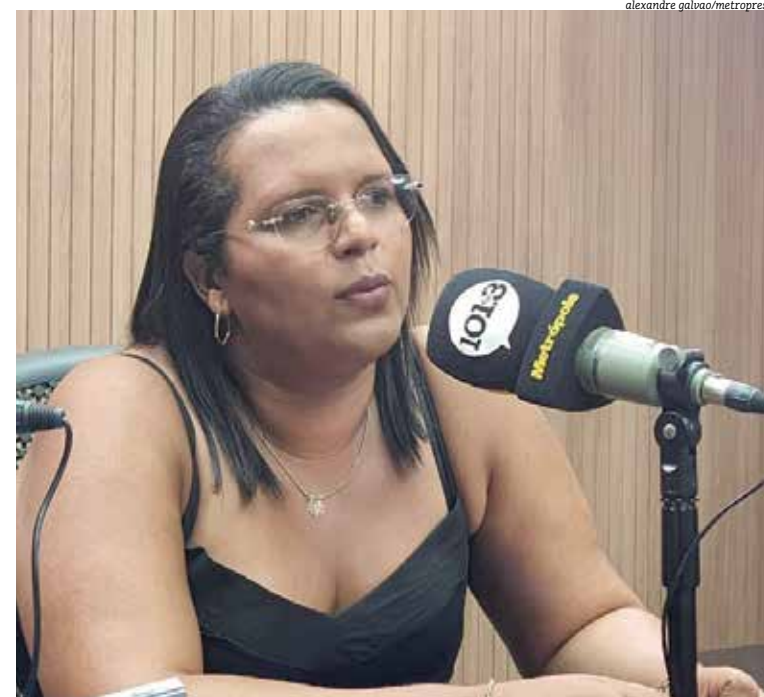
Cidades do interior começaram a se preparar para ter benefício com ponte ainda incerta

tão procurando espaços para fazer suas aquisições. Além disso, tem uma comissão já preparada nosso governo ja preparada para discutir junto ao governo”, afirmou ela. A gestora disse ainda que está discutindo a aprovação do PDDU na Câmara Municipal da cidade.