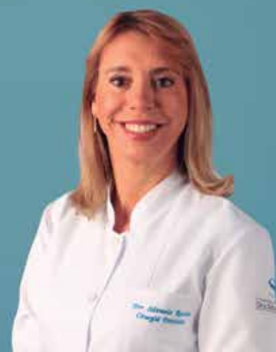
RESPONSÁVEL TÉCNICO: DRA. SILVÂNIA ROCHA - CROBA 14011