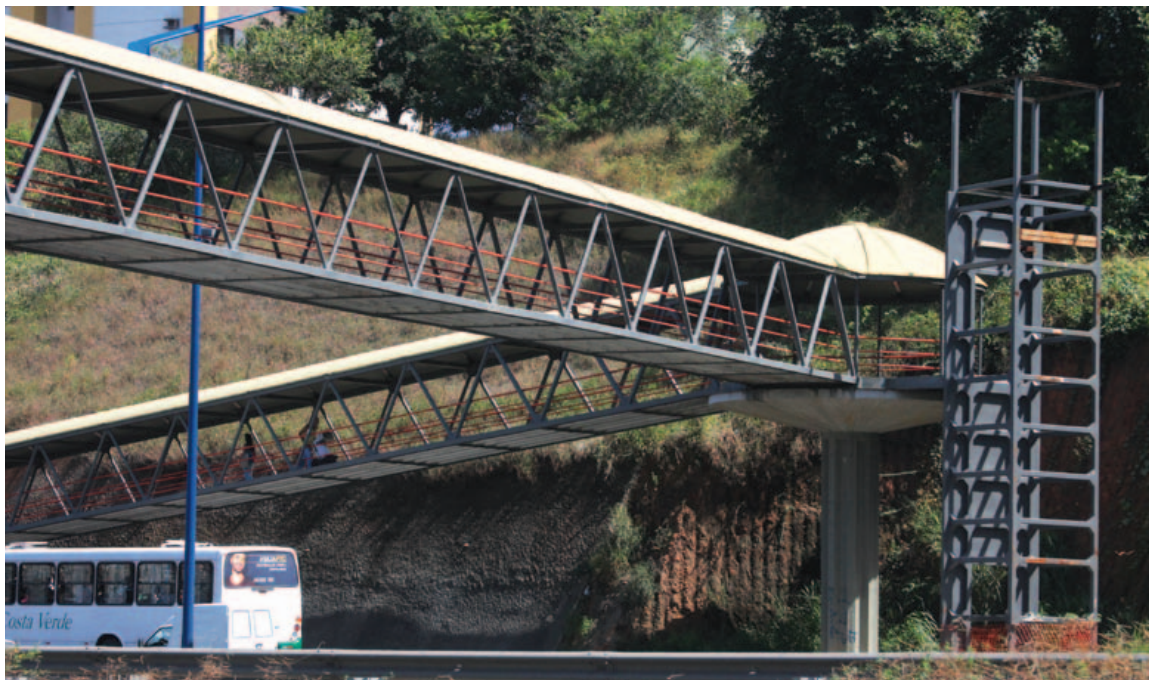
Cercados por redes de proteção, alguns dos vãos de elevadores viraram depósito de lixo ou moradia improvisada para sem-teto

a Companhia, a instalação está na fase final de testes. “Outros quatro elevadores também previstos para a Av. Heitor Dias estão com toda infraestrutura concluída, restando apenas a fabricação de parte da estrutura em aço inox e da proteção em polícarbonato”, disse, por intermédio de nota.