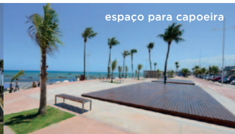
espaço para capoeira