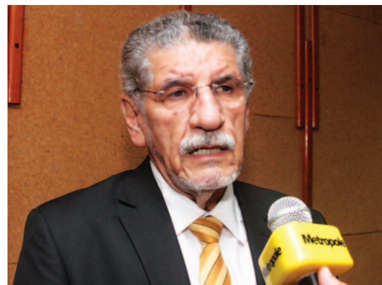
Deputado ligado a Vitória da Conquista classifica como inaceitável situação do presídio local