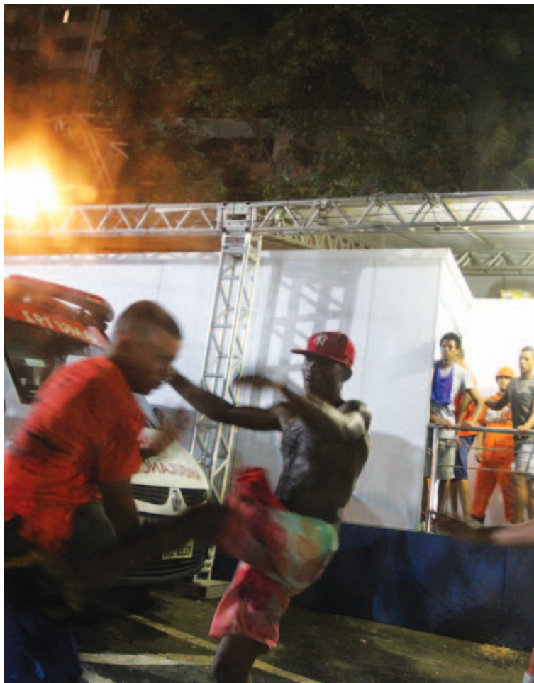
Violência no Carnaval virou fonte de divergência entre governo e Prefeitura

“Validamos tudo no Conselho do Carnaval. Eram do conhecimento do governo e da polícia todas as mudanças que estavam sendo feitas. Informamos à SSP e eu avisei que faria o lançamento do Carnaval antecipadamente, e ninguém se opôs. O governo se calou. Depois veio a reação, e eu não entendi. O governador não precisava ter feito a cobrança pública, e eu não sou irresponsável de fazer o Carnaval sem segurança pública”, disse.