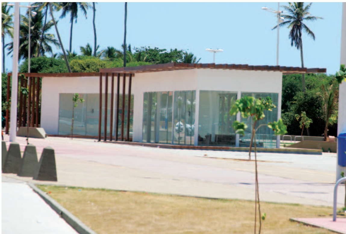
De acordo com a Prefeitura de Salvador, os primeiros quiosques da Orla ainda não estão funcionando porque a Coelba ainda não fez ligação

traz inúmeros prejuízos. “A falta de energia acaba desligando os semáforos que precisam de energia para funcionar”, reclama. Na última segunda (4), o núcleo de trânsito de Salvador ficou sem funcionar por causa da Coelba. “Ficamos sem imagem de câmeras, sem informações de vias”, conta.