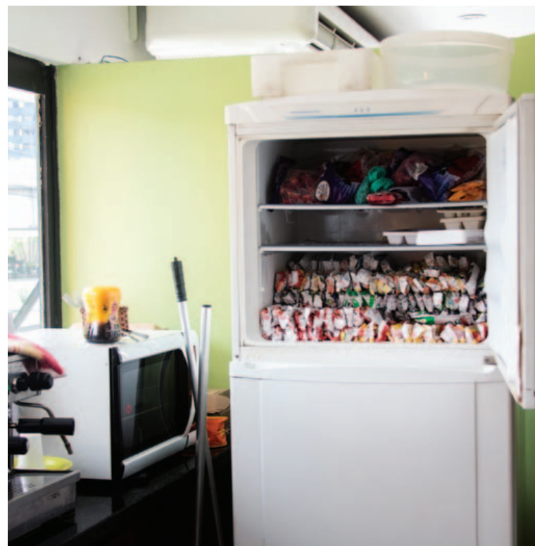
Em pontos comerciais, o prejuízo está na geladeira: sorveterias sofrem com a Coelba