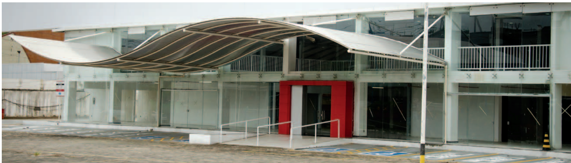
Após quase dois anos de atraso nas obras, Shopping da Gente parece finalmente estar próximo de sua inauguração. A Coelba, porém, diz que só vai ligar a rede elétrica se as obrigações do empreendimento estiverem cumpridas

Como forma de “compensação”, segundo o empresário, os comerciantes terão um desconto de 50% no aluguel dos espaços. “ Fizemos um reunião com eles e decidimos que, em compensação pelo atraso, nós daremos a eles no primeiro ano 50% de desconto no valor do aluguel”, afirma.