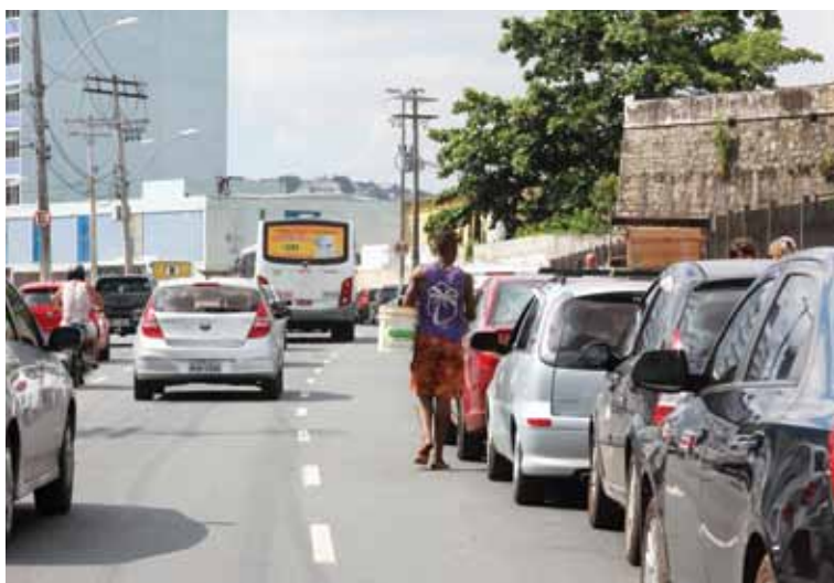
Quem tenta pegar o ferry é obrigado a lidar com longas filas de espera em Salvador

Questionada pela Metrópole sobre um eventual favorecimento a alguns carros na fila, a Internacional Travessias se limitou a dizer que “desconhece qualquer situação desta natureza e que o atendimento a qualquer pessoa que utilize o sistema é feito seguindo os trâmites formais”. A empresa disse ainda que “trabalha com o máximo respeito a todos os clientes e atua de modo a atendê-los com presteza, sem distinção”.