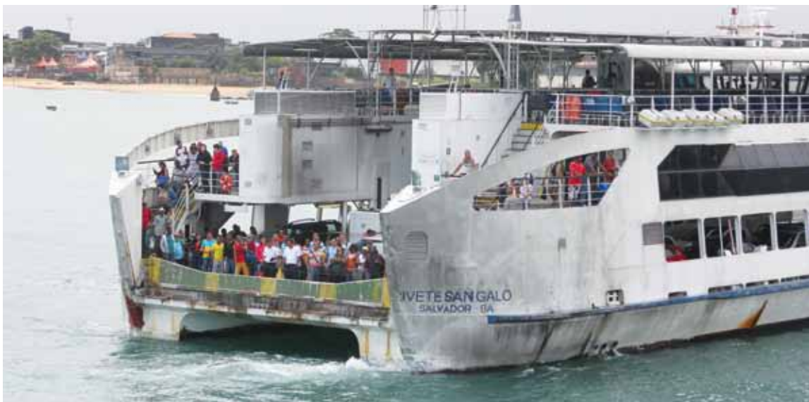
Entrada e saída de pedestres e carros pela mesma rampa causam ainda mais dificuldades aos usuários do serviço, que temem um acidente