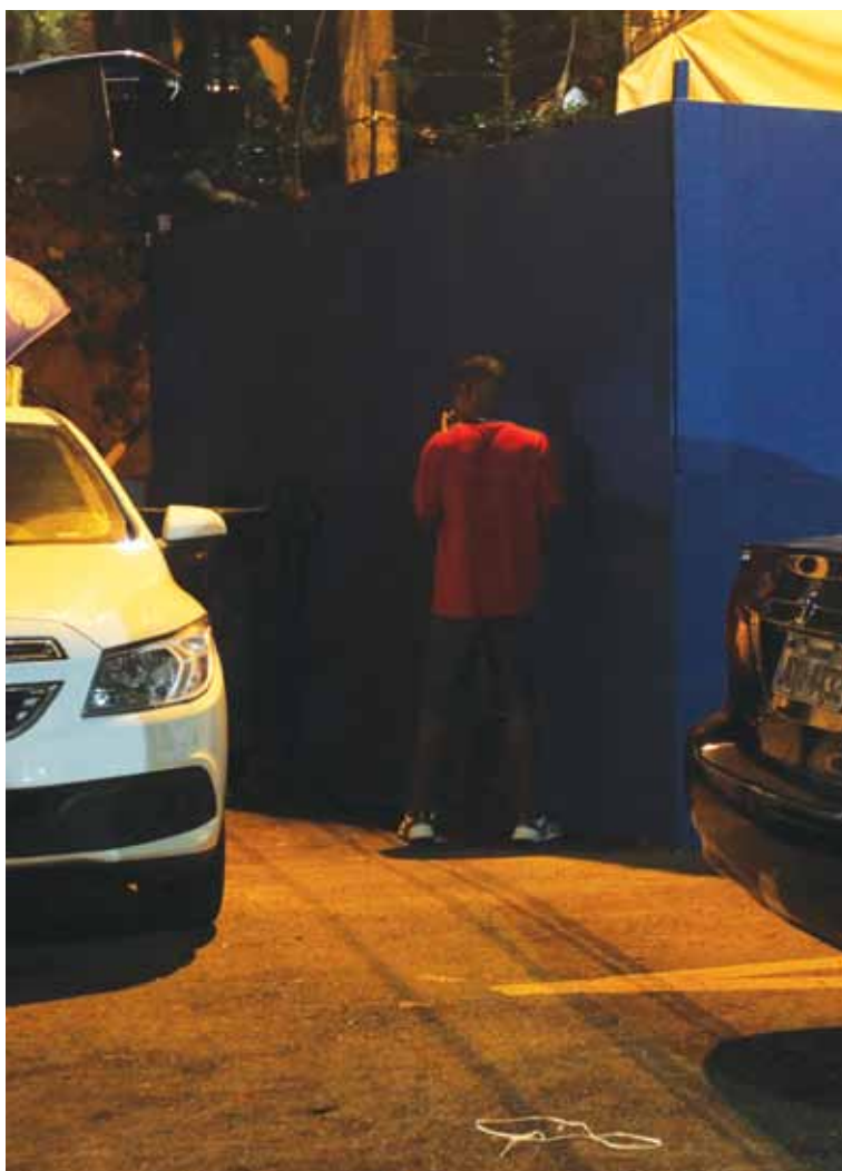
Limpurb se atrapalhou com o número das infrações e das punições efetivamente dadas