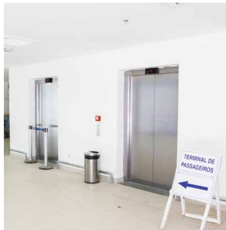
Pegadinha: placa aponta para o elevador, mas equipamento não leva ao terminal de passageiros