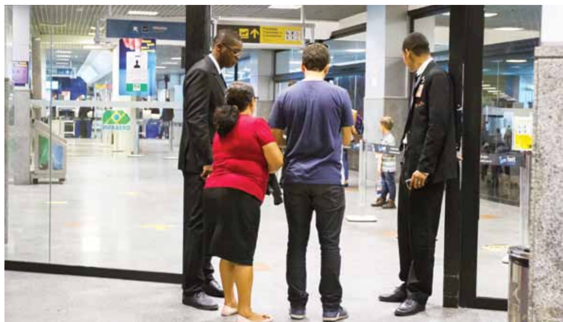
Situação do aeroporto de Salvador já é caótica, e o temor é que piore à medida que os remanejamentos e demissões na Infraero aconteçam