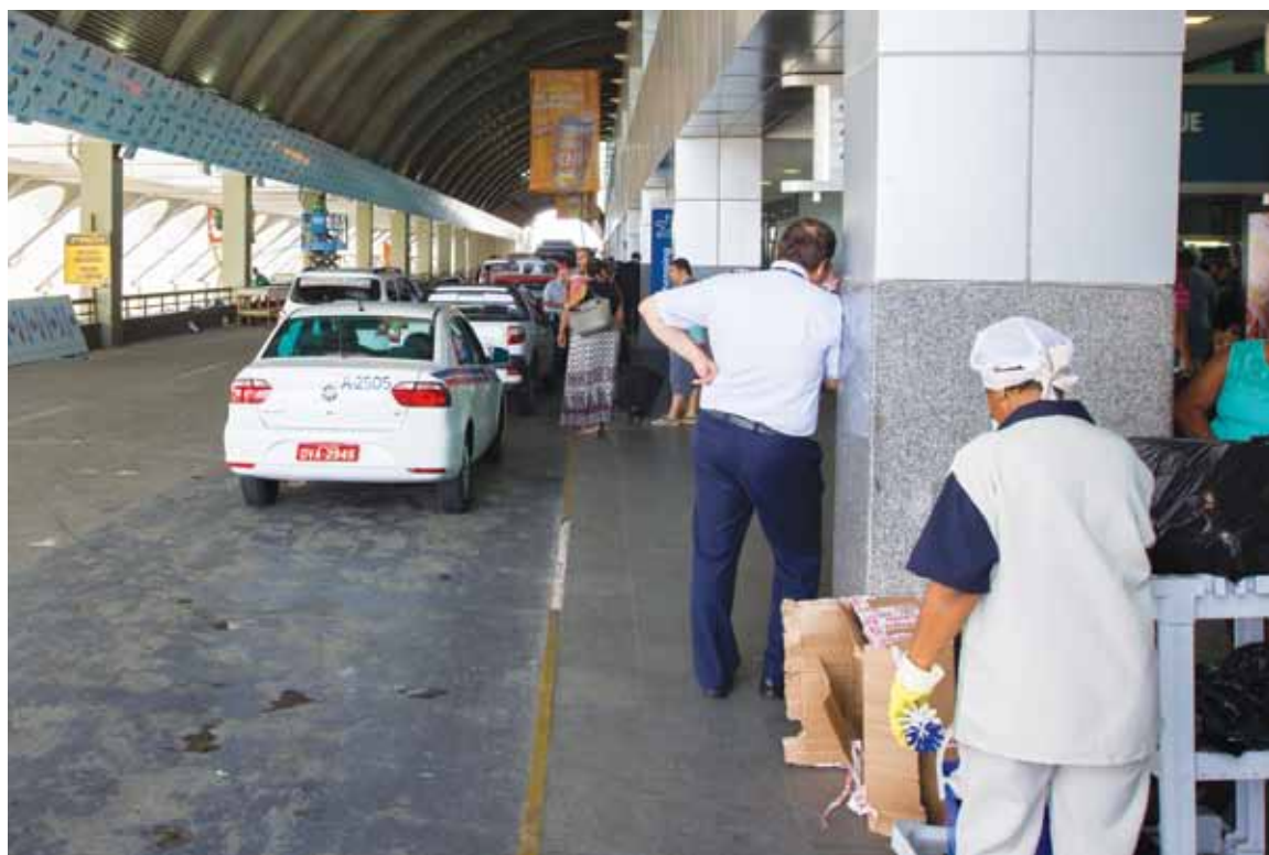
Desorganização já começa na chegada ao terminal de embarque: taxistas e acompanhantes de passageiros duelam por espaço

O gerente-geral da empresa, Gilson Costa, negou as denúncias. Ele garantiu que o efetivo foi aumentado para 210 funcionários e atende a necessidade do local no verão.