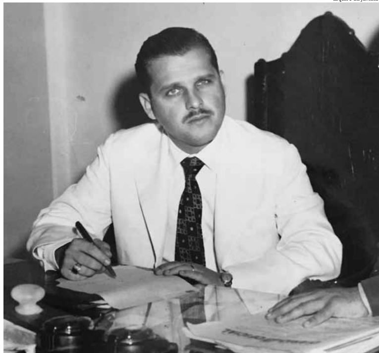
Ainda jovem, Afrísio Vieira Lima se destacou como vereador e deputado estadual pela Bahia