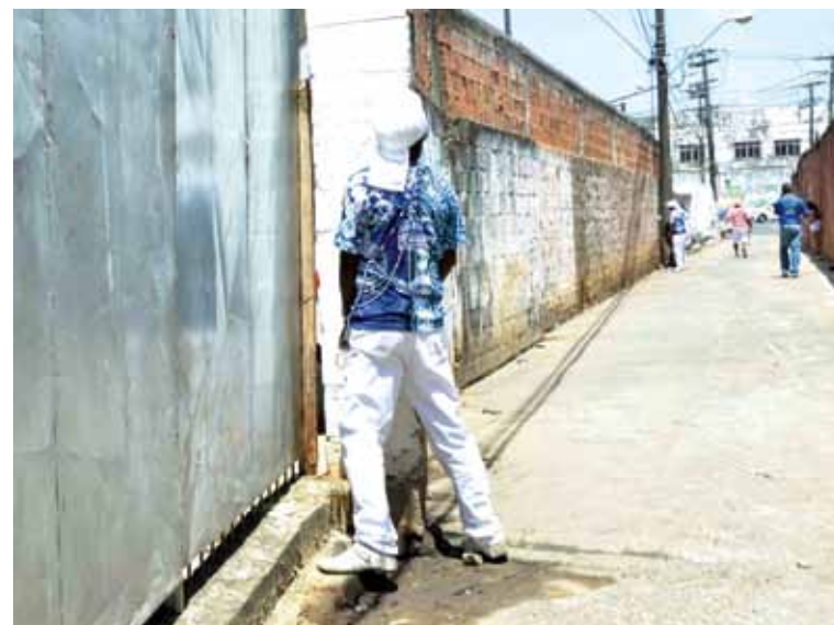
Nas festas de largo regadas a cerveja, os mijões fazem a festa pelos bequinhos da cidade

de atuação da Guarda Municipal em relação à fiscalização e aplicação dessa legislação”, explica o promotor Adriano Assis. Porém, questionada sobre o número de fiscais nas ruas, a Limpurb não mencionou a atuação da Guarda e disse apenas que “seis gerentes, 18 chefes do núcleo de limpeza e 12 agentes de fiscalização” realizam a tarefa.