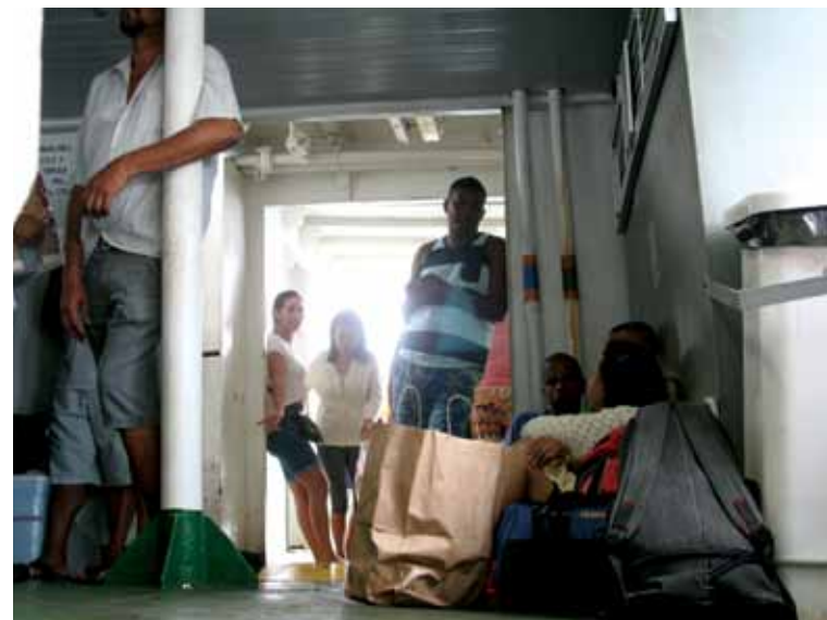
Dentro do ferry, passageiros se viram como podem com a lotação e o pouco conforto

“Os pedestres saem primeiro, os automóveis ficam parados, esperando para sair, porque o acesso é dado pelo mesmo local. Pode acontecer algum acidente se um motorista mais apressado resolver sair antes da hora, empurrando as pessoas”, criticou.