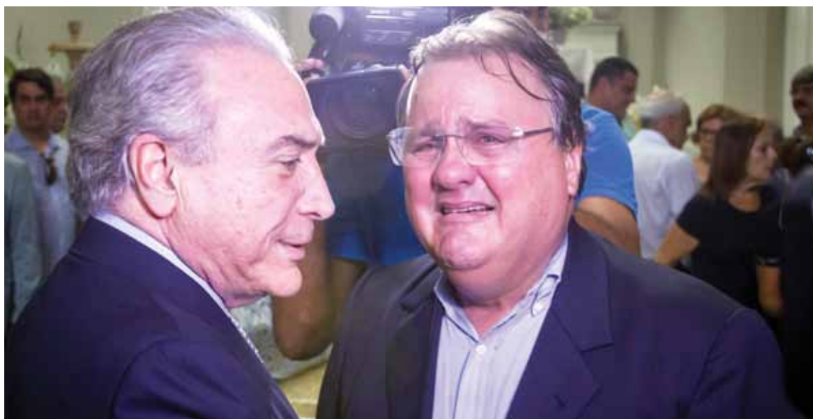
A cerimônia fúnebre teve a presença do vice-presidente do Brasil, Michel Temer, que demonstrou sua solidariedade a Geddel Vieira Lima