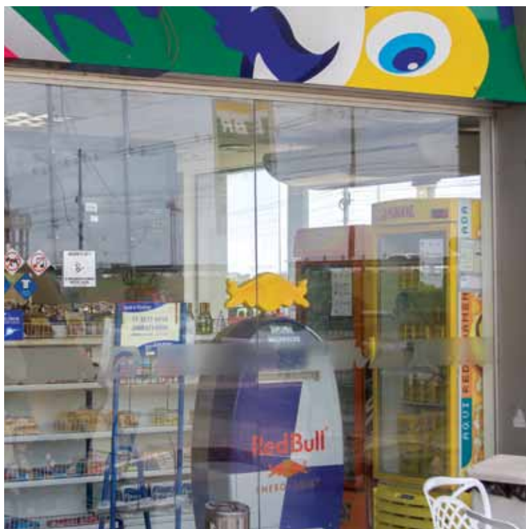
Nos postos, não é nada difícil ver o descumprimento da lei: basta pedir uma cerveja após as 22h