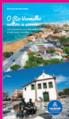
Anúncio Jornal e Comercial TV Rio Vermelho Prefeitura de Salvador