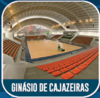
GINÁSIO DE CAJAZEIRAS