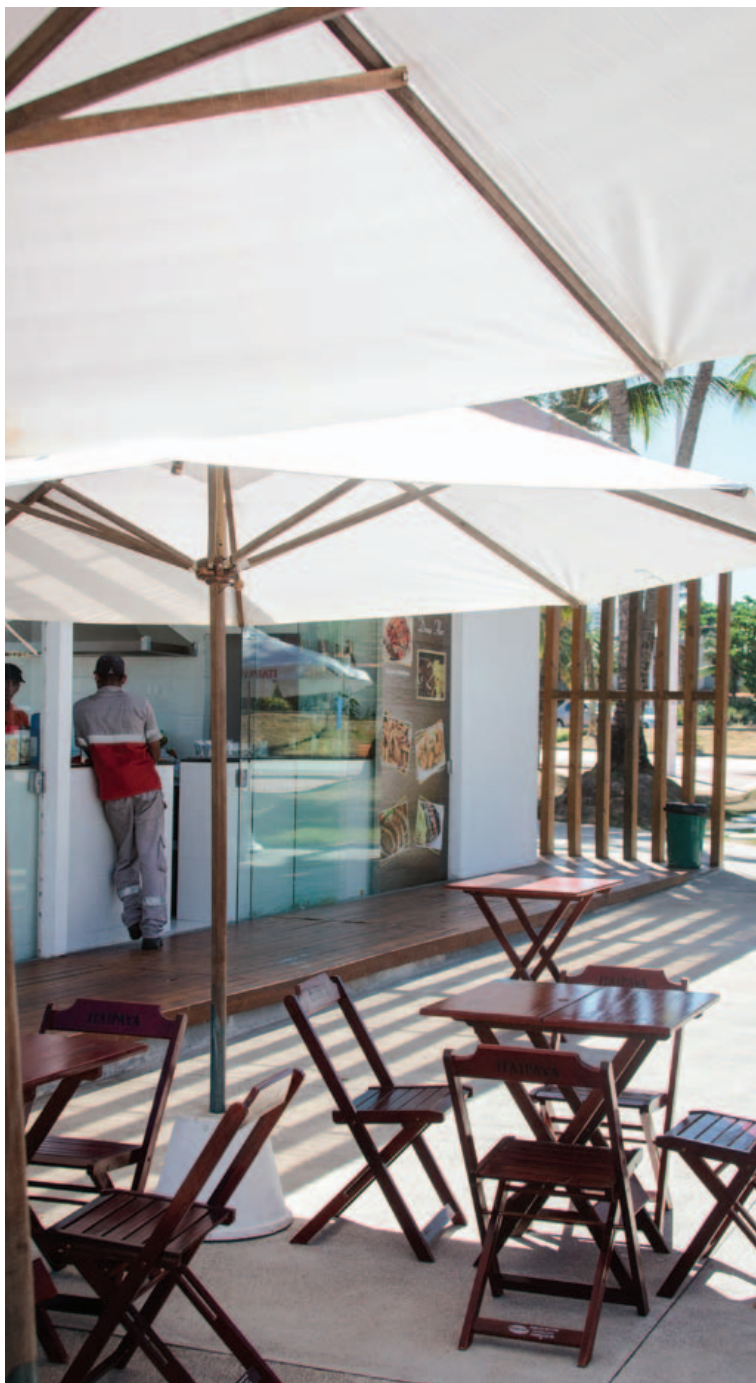
Durante a semana, quiosques ainda não atraem o público esperado. O tempo deve mudar isso

À Metrópole , a Coelba afirmou que todas as ligações solicitadas para Piatã já foram realizadas desde fevereiro deste ano. Em Itapuã, os reparos foram programados para iniciar dia 29 de março e terminar até 15 de abril.