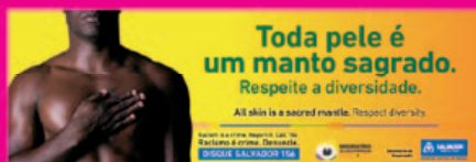
Outdoor contra racismo na Copa Prefeitura de Salvador