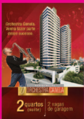
Anúncio Orchestra Canela Sertenge