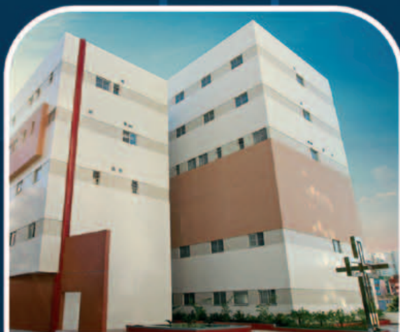
NOVO HGE 2