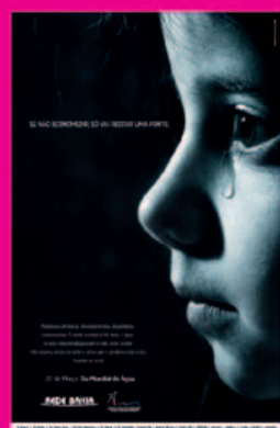
Anúncio Dia da Água Rede Bahia