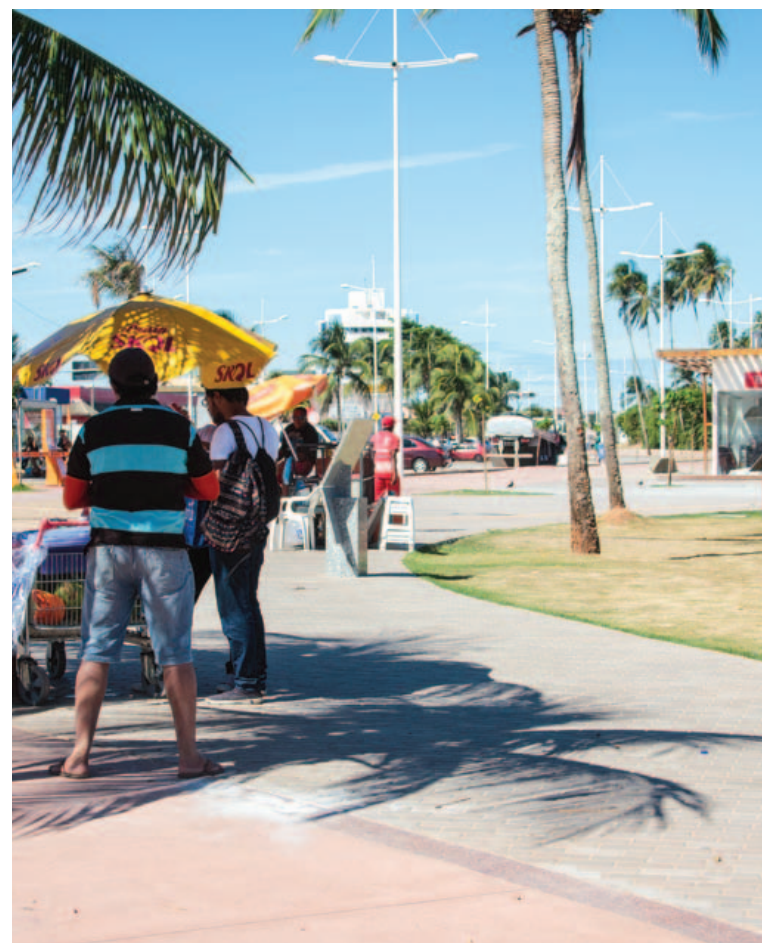
Os velhos ambulantes da Orla de Itapuã agora têm a companhia dos permissionários oficiais

de ligação da Embasa. Esse serviço não é de responsabilidade da Embasa. A concessionária responsável pelos quiosques já foi orientada, mas, até hoje, a adequação não foi providenciada. A Embasa aguarda a conclusão desse serviço para atender os pedidos de ligação de água”, afirmou em nota.