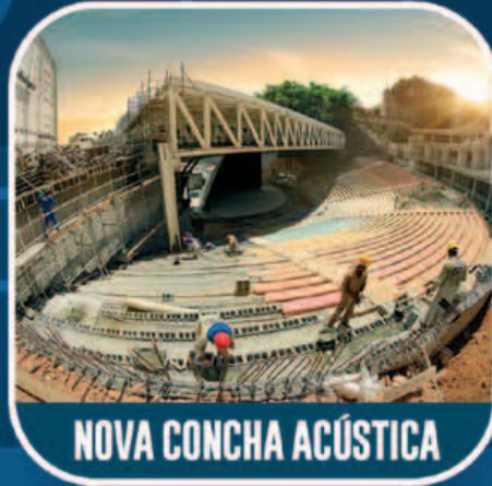
NOVA CONCHA ACÚSTICA