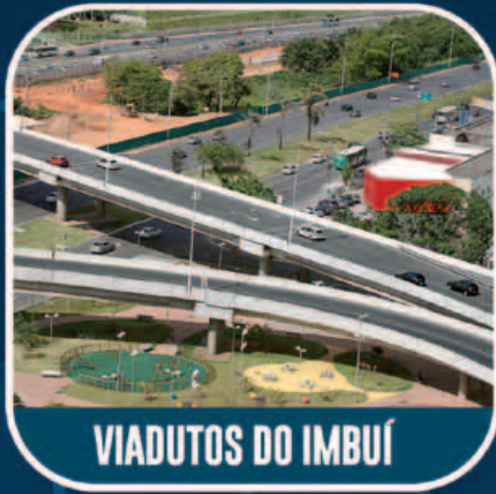
VIADUTOS DO IMBUÍ