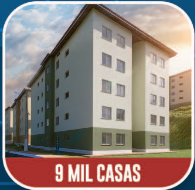
9 MIL CASAS