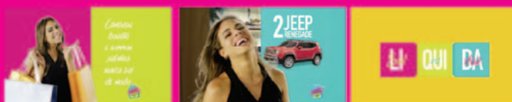
Comercial TV Liquida Salvador CDL Salvador