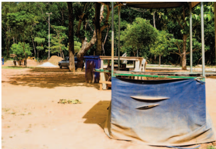
Cenário em parte do Parque da Cidade ainda é de terra arrasada. Obras serão retomadas