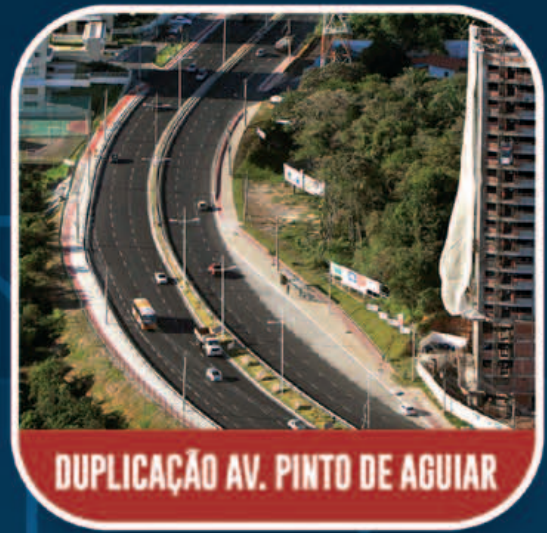
DUPLICAÇÃO AV. PINTO DE AGUIAR