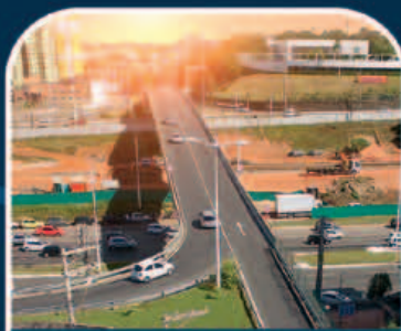
VIADUTO DE NARANDIBA