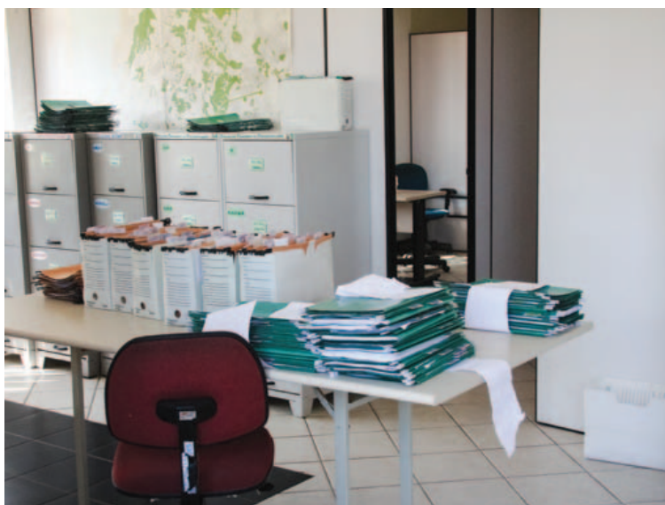
Antigo complexo de restaurantes do parque agora abriga documentos e projetos da Conder

Mas a própria Polícia Militar desmente a Conder. “A presença de pessoas em flagrante estado de vulnerabilidade social, as quais moram no Parque, fazem uso de substâncias entorpecentes e culminam na incidência da autoria de pequenos delitos, repercutem de forma muito negativa”, disse a PM em nota.