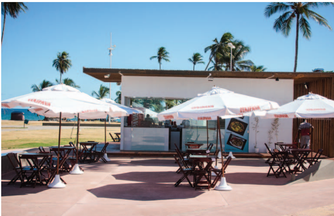
Com patrocínio de uma cervejaria, esta é um dos poucos quiosques que estão funcionando na orla de Salvador. Dez estão prontos e nada