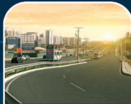
VIAS MARGINAIS DA PARALELA