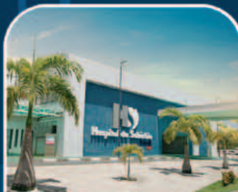
HOSPITAL DO SUBÚRBIO