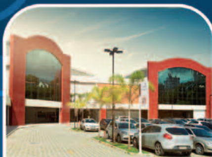
MERCADO DO RIO VERMELHO