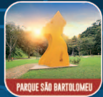
PARQUE SÃO BARTOLOMEU