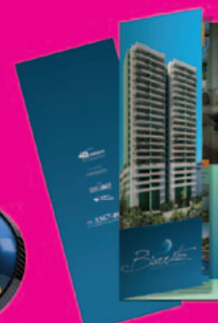
Folheto Biarritz Concreta