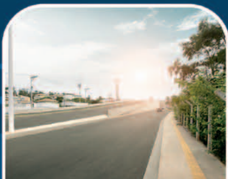
DUPLICAÇÃO AV. ORLANDO GOMES