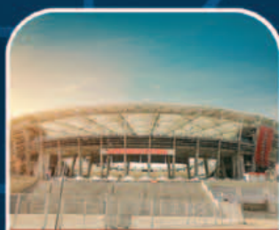
ARENA FONTE NOVA