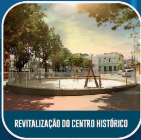
REVITALIZAÇÃO DO CENTRO HISTÓRICO