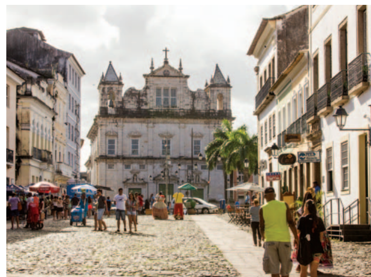
Renovada, Salvador está a seis meses de escolher seu gestor para período 2017-2020