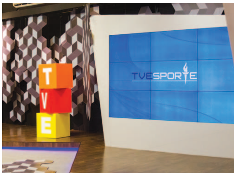
Estrutura conta com 298 funcionários e custa mais de R$ 9 milhões ao ano para o Estado

Segundo o diretor, a programação infantil ainda é o carro chefe: “Nós temos a melhor programação infantil do Brasil. Temos quatro horas pela manhã e quatro à tarde”.