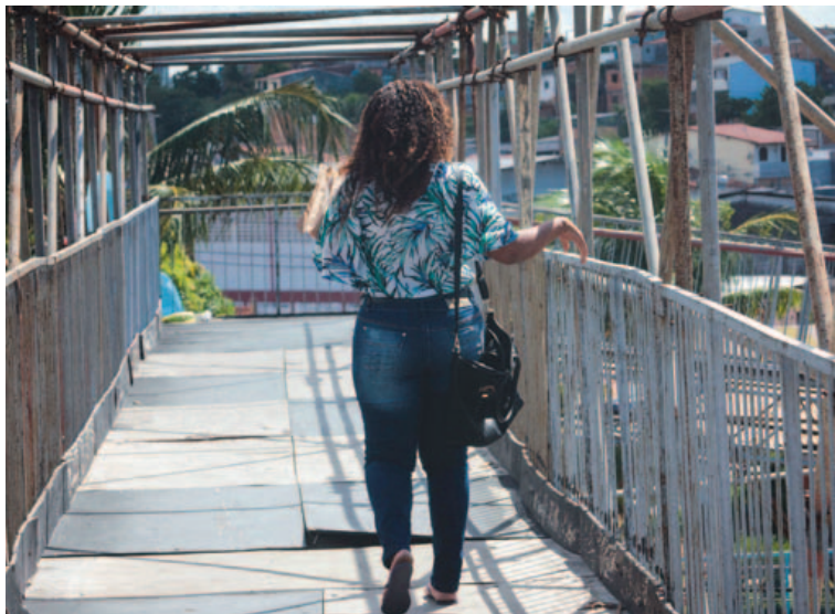
Nem precisa passar pela passarela pra saber que a estrutura não inspira qualquer confiança