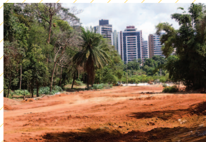
Depois de a AIF Engenharia atrasar em oito meses a entrega do Parque, as obras foram assumidas pela Metro. O prazo inicial de abril, porém, já foi descumprido. A previsão agora é junho