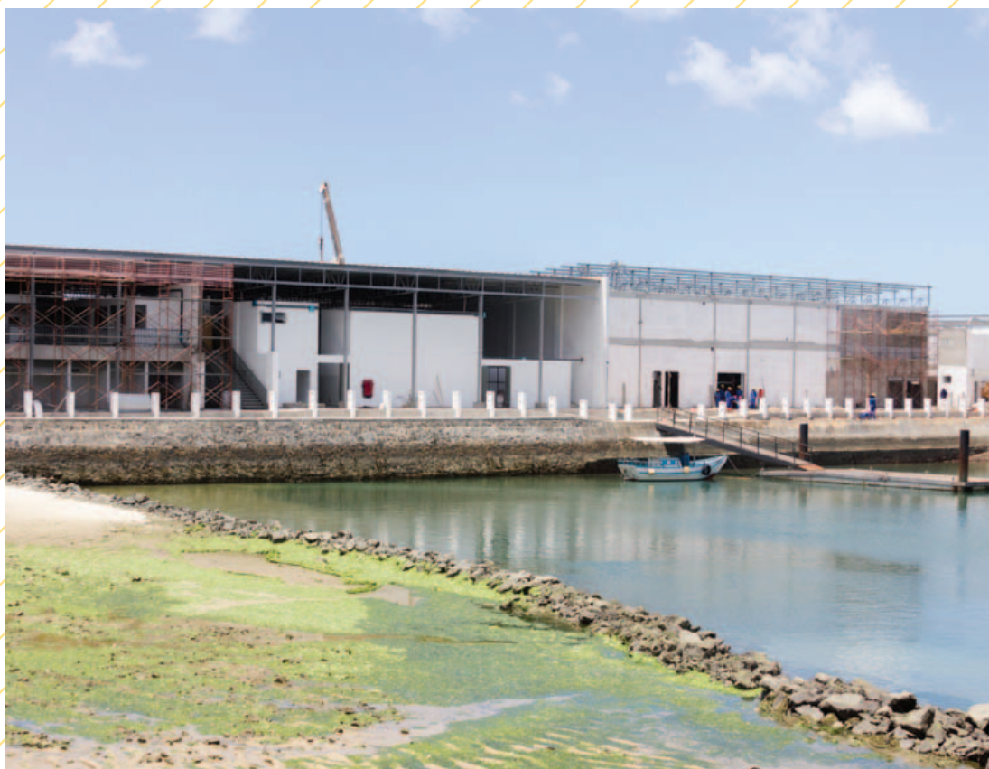
Enquanto os vendedores se apertam num galpão desde 2011, quatro empresas já passaram pela construção da nova Feira de São Joaquim. A Metro Engenharia é a atual comandante do projeto, que ainda terá novas licitações para as últimas fases da obra.