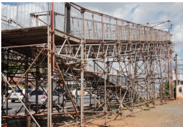
Fale sério: você se sentiria seguro ao subir e atravessar uma rua por esta passarela?