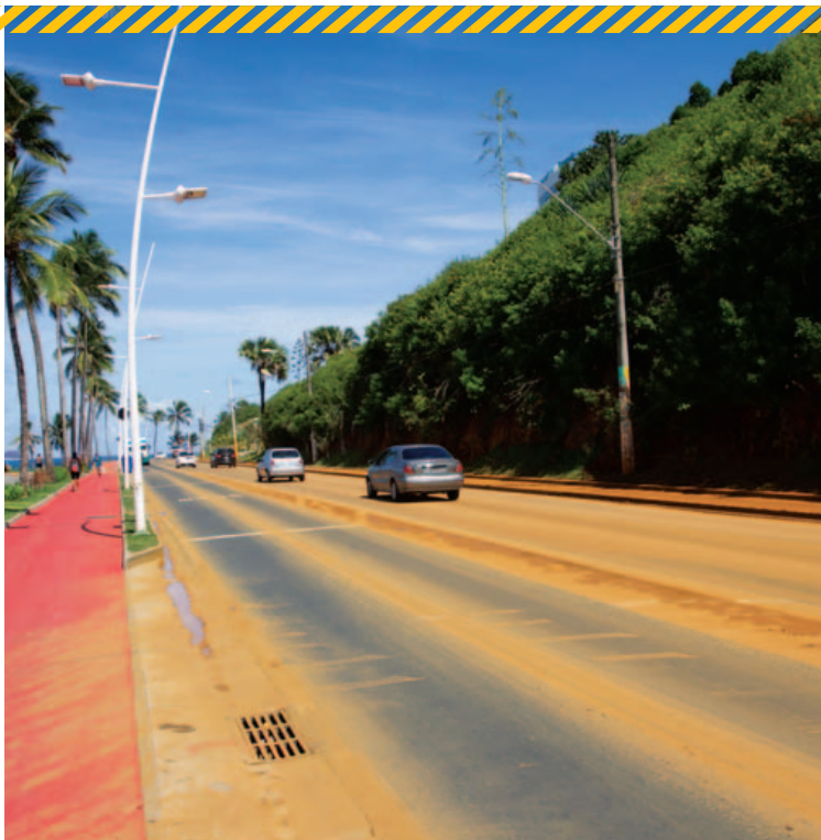
Durante toda a segunda-feira (3), a pista da Av. Oceânica, em Ondina, ficou deste jeito