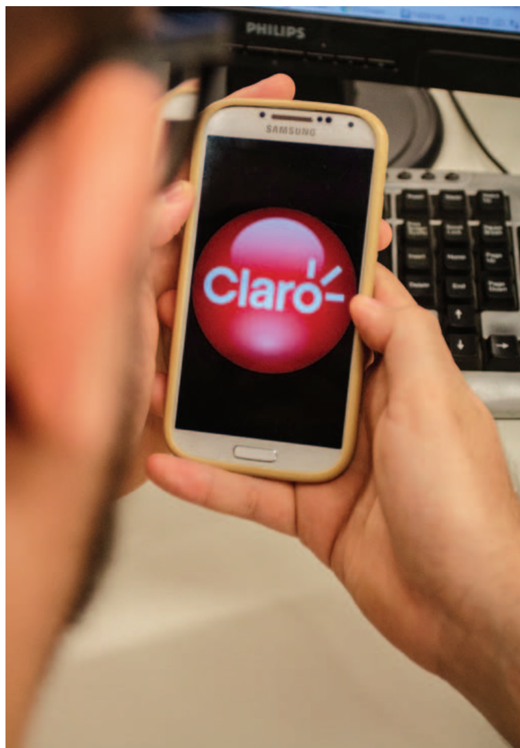
Na Claro, a alegria de conseguir se conectar à internet via celular dura muito pouco

Ao solicitar o relatório de uso do serviço, a resposta é negativa. “Eles dizem que não têm como entregar o relatório de consumo”, conta a pedagoga, que já passa pelo problema há alguns meses e afirma que vai procurar o Procon.