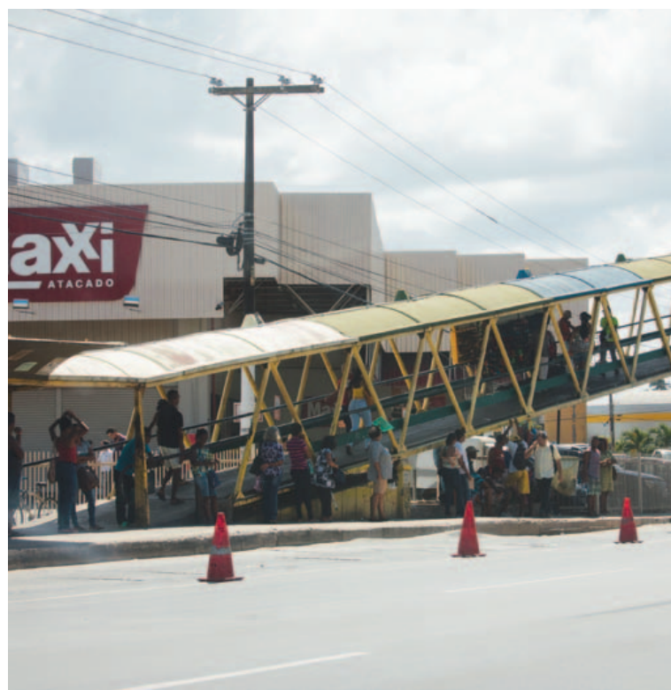
Outras passarelas de Lauro de Freitas também atemorizam a população por sujeira e riscos