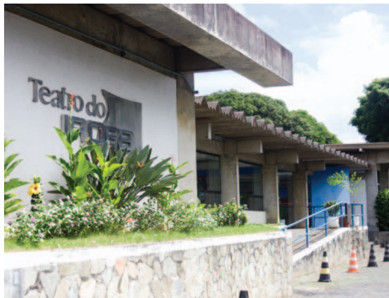
Integração do teatro do Irdeb com os outros setores do Instituto é um dos focos de Gonçalves