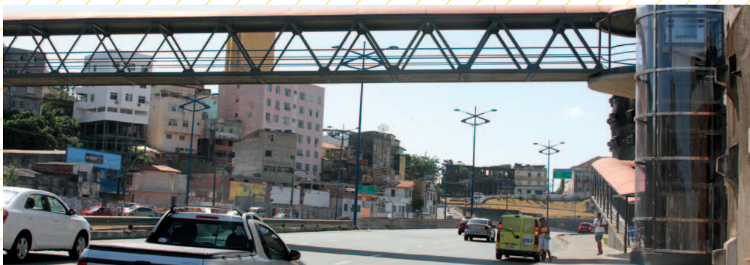
A estrutura de aço inox e policarbonato já foram concluídas em três das quatro torres de elevadores previstas para a Avenida Heitor Dias e em uma das duas torres da Avenida Barros Reis. Segundo a Conder, a Coelba identificou a necessidade de instalar dois postes e reordenar a distribuição subterrânea de energia nos dois locais. O prazo era abril.