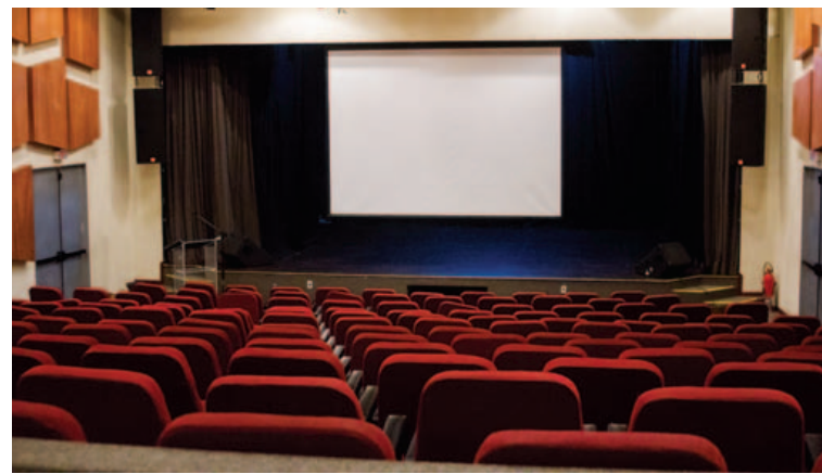
TVE terá transmissão especial dos shows de reinauguração da Concha Acústica do TCA

“Formar um espaço de convivência, de informação. Temos um potencial importante, temos o teatro, o espaço dentro da nossa própria estrutura. Trazer a juventude hoje é um desafio. A juventude hoje quer ficar muito na internet”, afirmou.