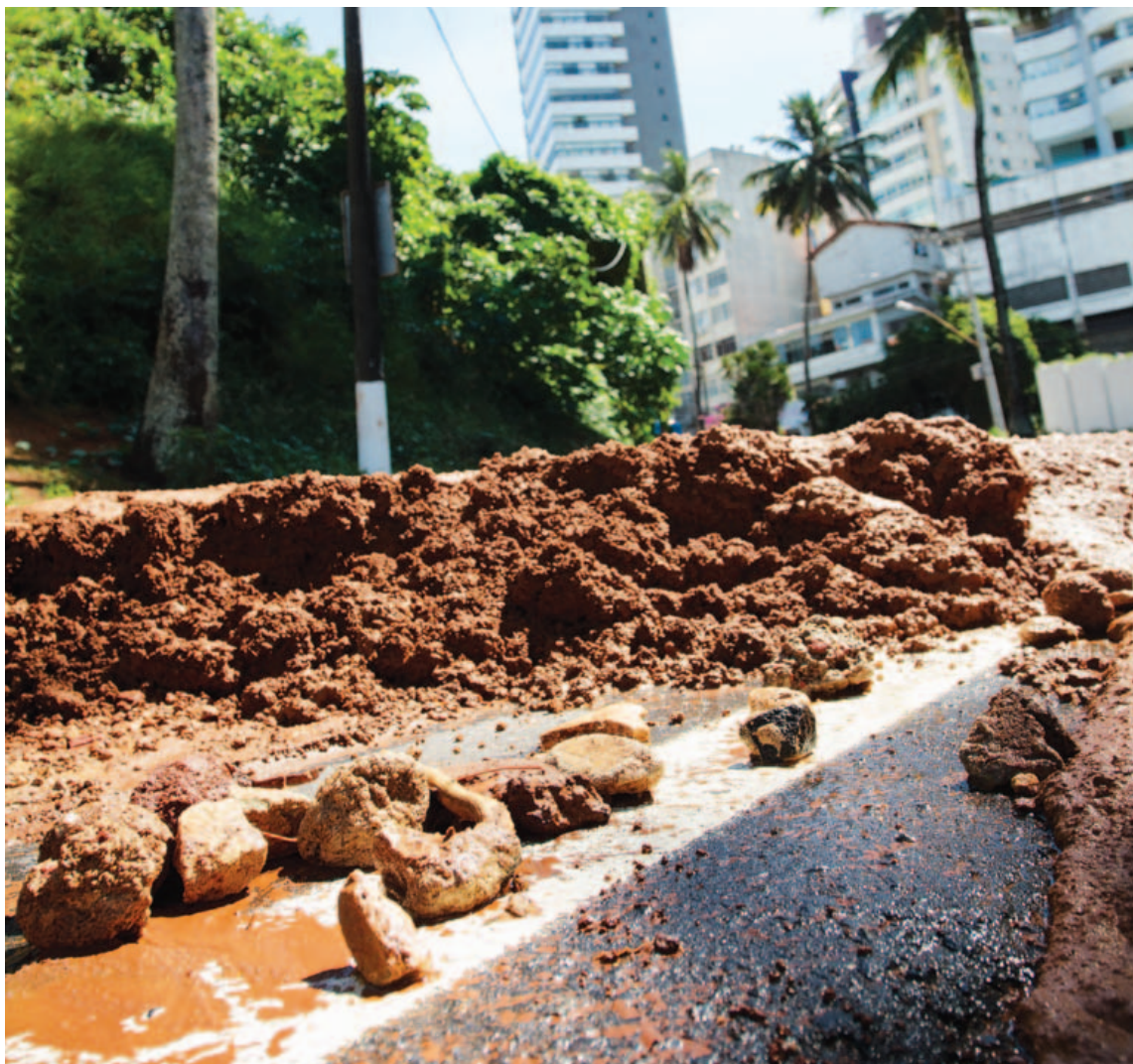
Quebra da adutora no Morro do Ipiranga, em Ondina, sujou as ruas e mar da região, além de prejudicar também o trânsito da cidade

E essa não foi a primeira vez que o soteropolitano ficou impedido de frequentar as praias por culpa da Embasa. No dia 23 de março, um acidente de trânsito deixou sem energia a estação de tratamento da Av. Lucaia, que processa cerca de 80% do esgoto da cidade. Resultado? Os dejetos jorraram na praia do Rio Vermelho por três dias, levando uma mancha de coliformes fecais e bactérias até a praia da Barra. Mas a rotina de “acidentes” pode estar com os dias contados.