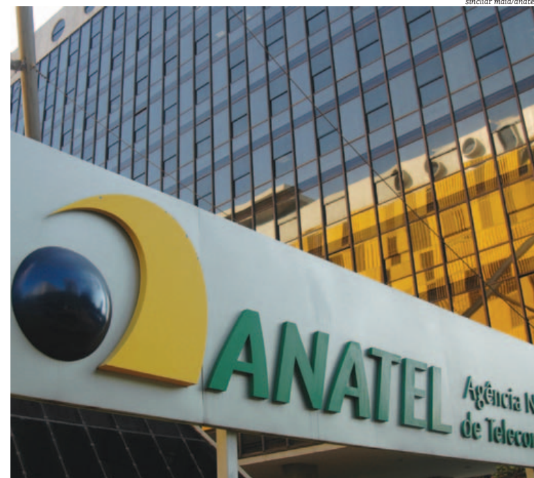
Anatel se exime de fiscalizar a falta de transparência na informação relativa aos dados móveis

No entanto, a liberdade no estabelecimento de modelos de negócios deve respeitar a legislação e a regulamentação da Anatel”, disse, em nota, afirmando ainda que uma aferição do serviço de internet é feita de forma amostral por estados, porém com validade apenas estatística.