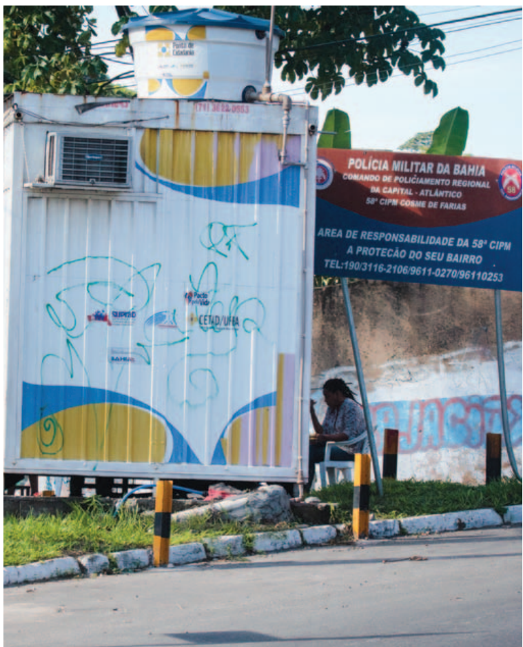
Parceria do Cetad com o governo, o Ponto de Cidadania é único suporte de quem vive ali