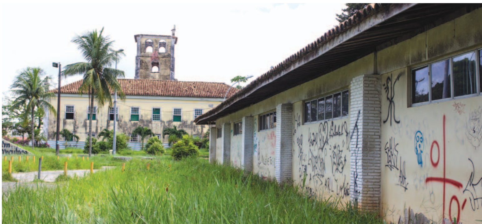
Parcialmente destruído, Solar Boa Vista vive abandono há anos, mas condições pioraram muito depois que um incêndio consumiu a sede da Secretaria Municipal de Educação

Em janeiro de 2016, o governo do estado culpou a prefeitura de Salvador pela morosidade na obra de revitalização do espaço. Mas, quatro meses depois, parece que o impasse, enfim, será solucionado.