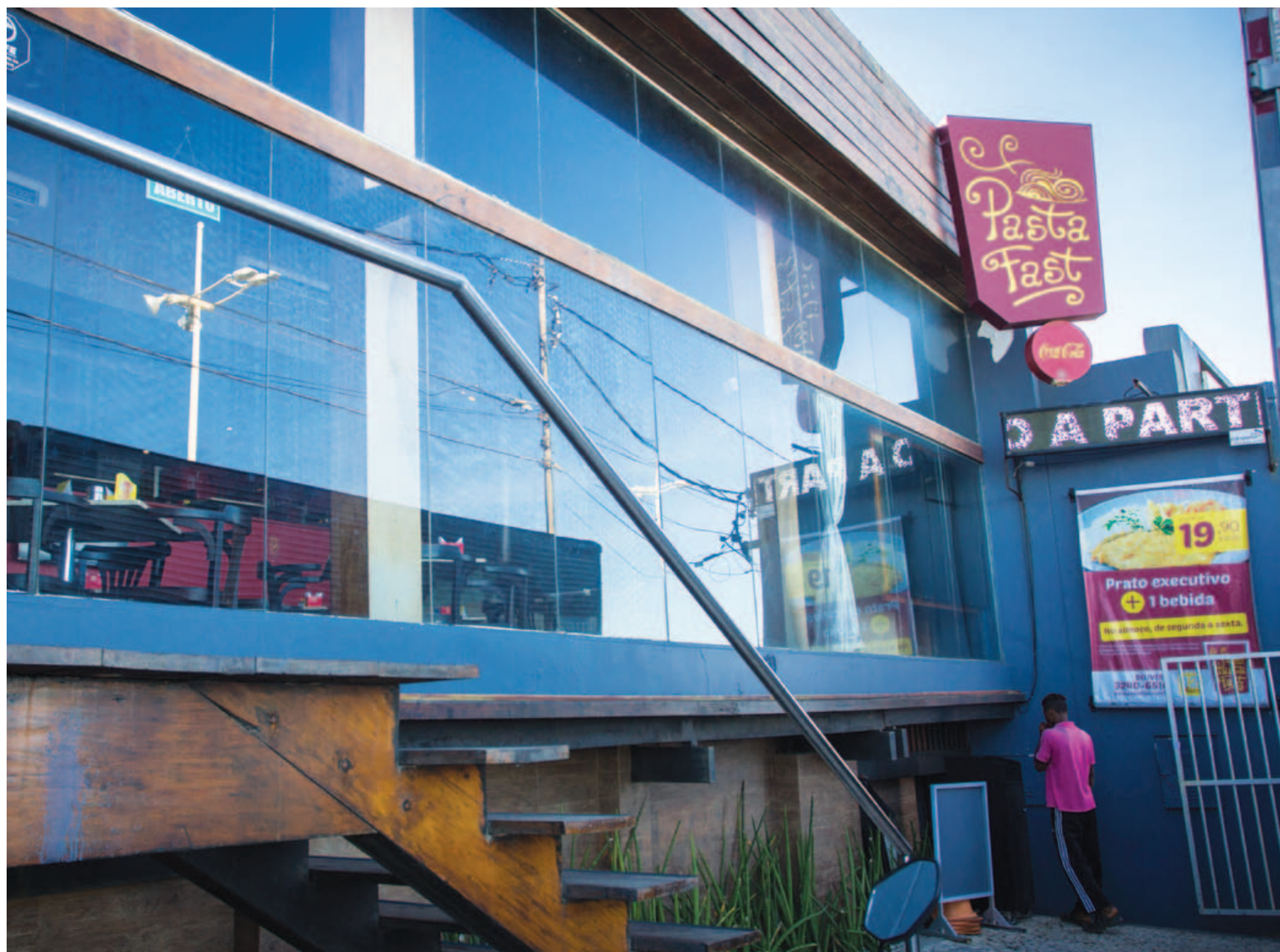
Restaurante Pasta Fast, localizado na Av. Octávio Mangabeira, é um dos que mais sofrem com as constantes quedas no fornecimento de energia. Restaurante sem luz é sinônimo de prejuízo

“É frequente a falta de energia. Eu já tive prejuízo com equipamento, perda de produto e matéria-prima. Já estamos sofrendo com a Coelba há um bom período”, conta, listando ainda quatro protocolos abertos na empresa. E o restaurante não é o único prejudicado na região.