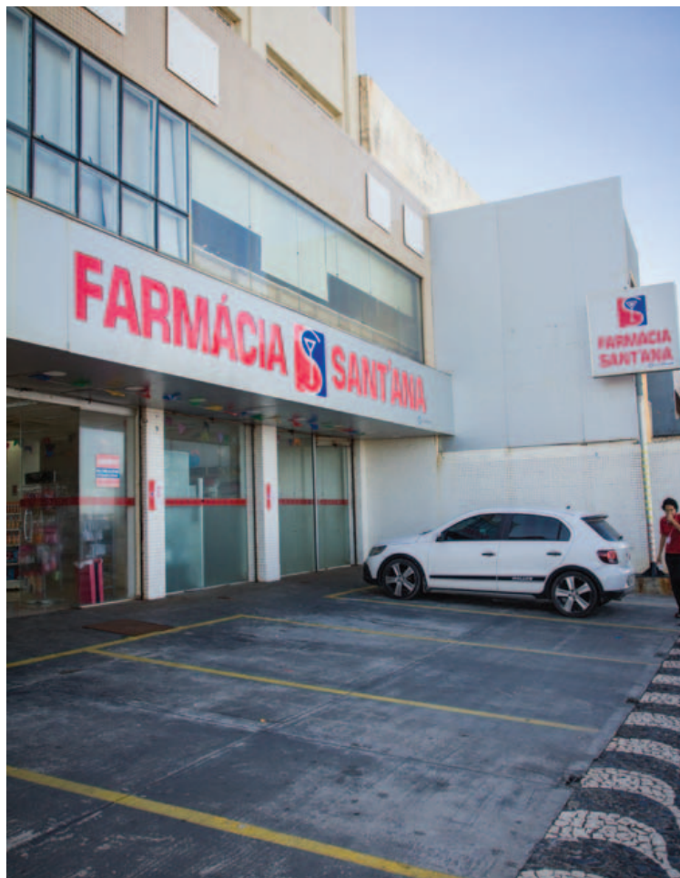
Farmácia Santana, que fica ao lado do Pasta Fast, também sofre com a falta de energia