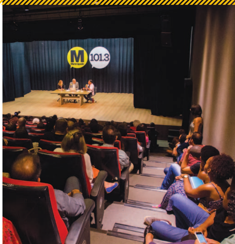
A procura foi tanta que teve gente sentada nos degraus da escadaria do Eva Herz

A escritora ressaltou o papel do historiador e exaltou as riquezas de Salvador. "O que é bonito aqui é que cada esquina, cada rua e cada paisagem é de um coração. Eu acho fabuloso é que o Brasil e a historiografia nos permitem revisitar o encontro do novo com o velho. Não falaria em saudosismo, falaria em busca do tempo perdido. Eu acho que essa é a tarefa do historiador: buscar no tempo alguma coisa que nos fale ao coração", falou.