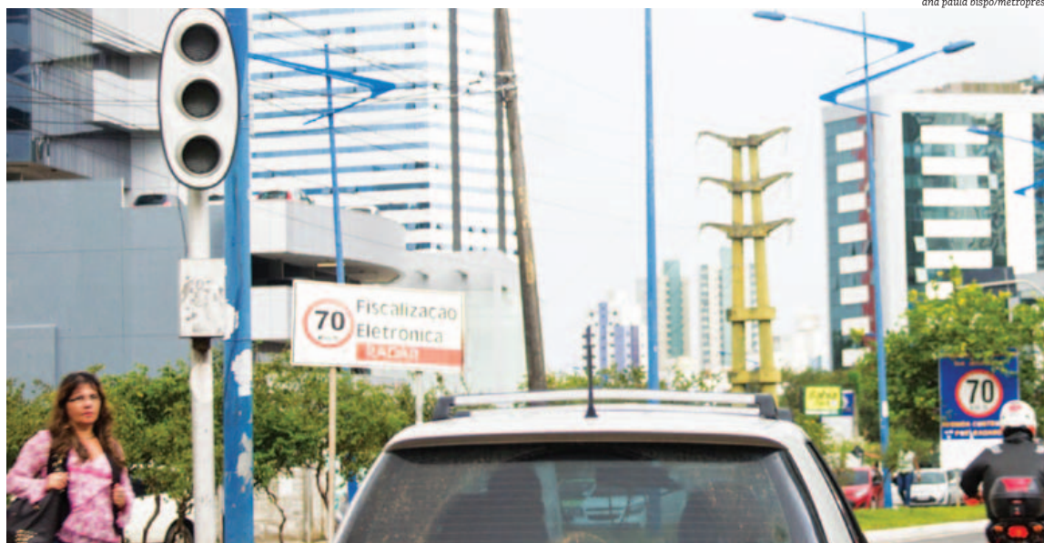
Além da falta de energia em estabelecimentos, há outro velho problema da Coelba na Pituba inteira: os semáforos que param de funcionar

Com tantos protocolos de atendimento abertos na Coelba, o empresário também reclama do serviço. “Toda vez que a gente liga, são três horas para dar o retorno”, afirma.