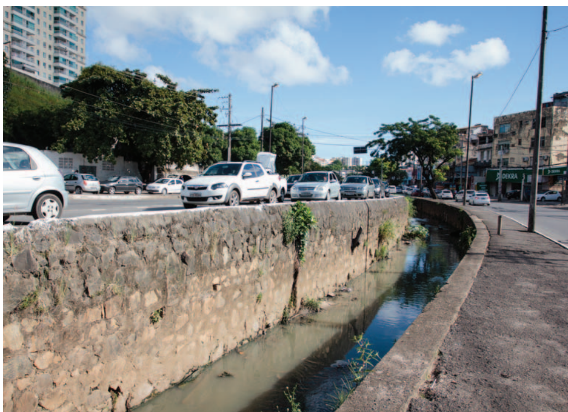
Definitivamente, o canal pluvial que passa pela região das Sete Portas não ajuda a valorizar a região. Falta cuidado da Prefeitura

tem o Cetad, principal responsável pelos Pontos de Cidadania