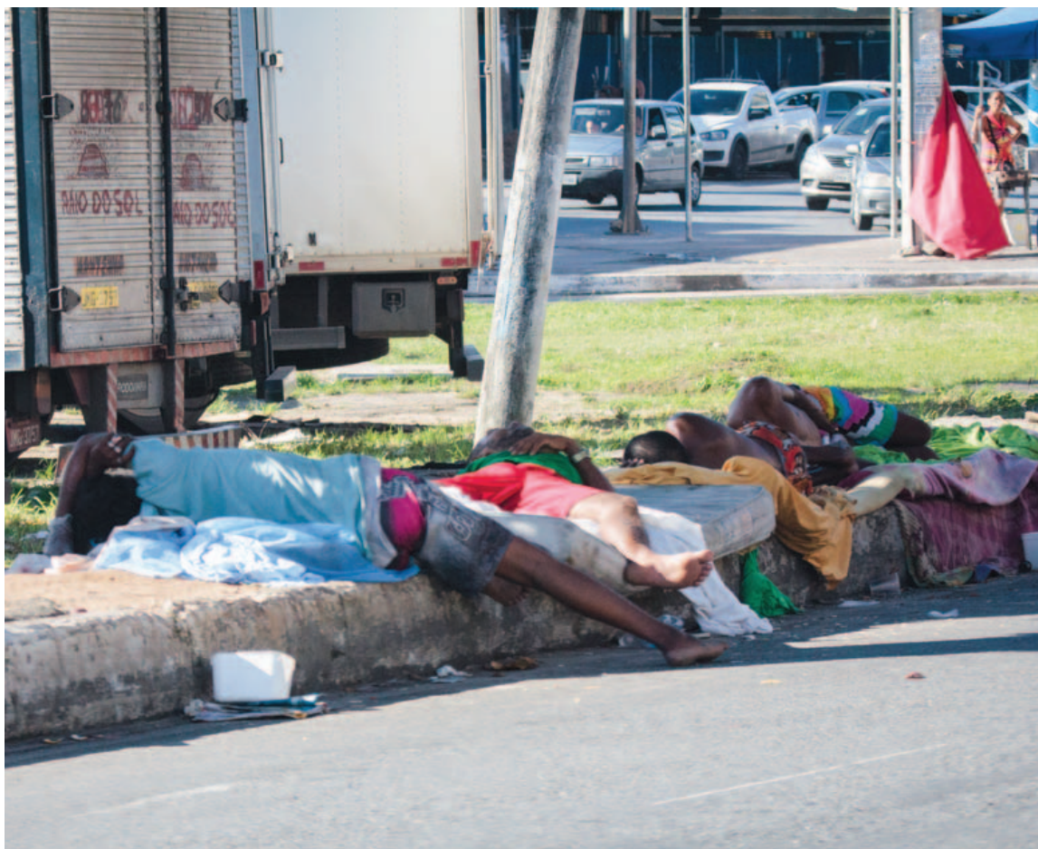
Longe dos principais cartões-postais da cidade, região da Rua Cônego Pereira reúne uma Salvador que ninguém mais quer ver