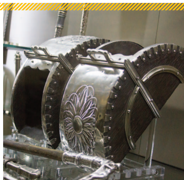
Peças são divididas em 12 coleções, entre Cristal, Escultura, Porcelana, Prataria e outros

A casa em estilo Colonial Americano, onde está instalada o museu, foi aberta ao público em 1969, durante o governo de Luís Viana Filho. Apesar da grande importância para a cidade, até então, o museu tinha pouco apoio e uma frequência de público menor do que deveria, chegando a suspender atividades.