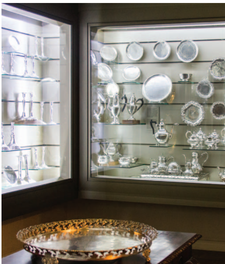
Museu proporciona ao visitante um retrato da Bahia nos períodos Colonial e Imperial