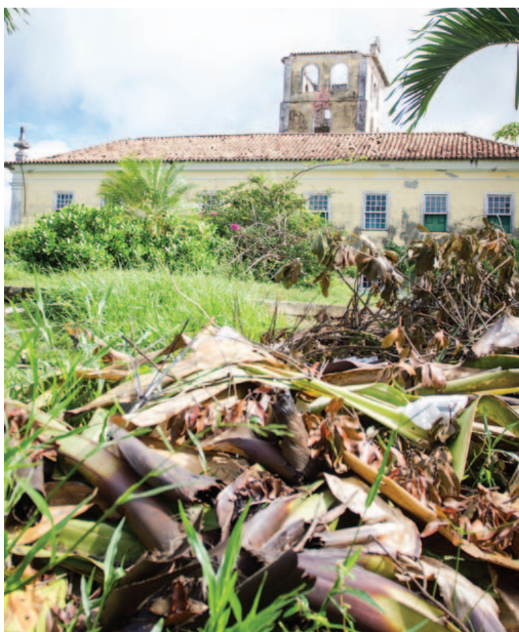
Situação do Solar Boa Vista reflete o porquê de ele ter frequência cada vez menor