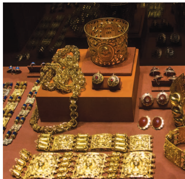
Vindas de uma coleção fechada, as peças retratam a rotina da aristocracia açucareira