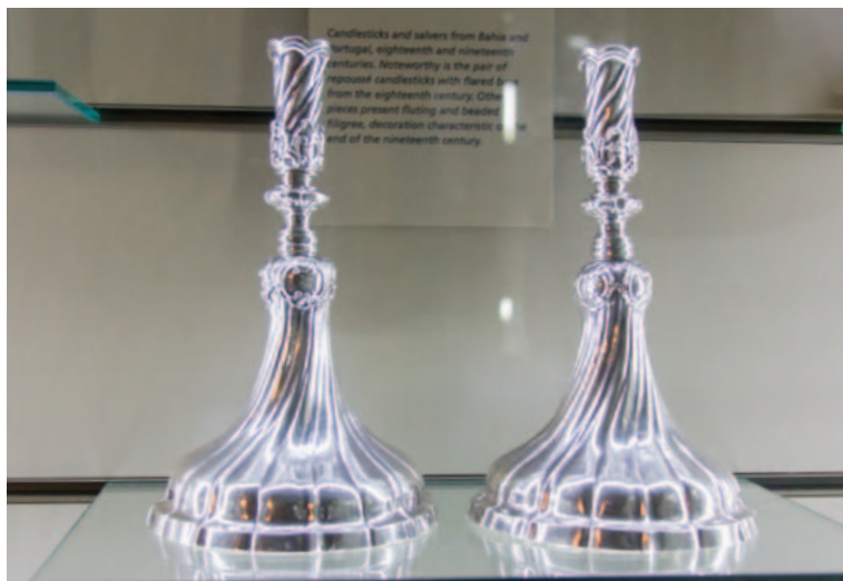
Maior parte dos objetos do acervo do museu pertenceu a famílias nobres baianas

O prefeito ACM Neto destacou os esforços para manter o apoio ao segmento em tempos de recessão econômica. “Temos feito um esforço enorme para economizar, e tenho procurado preservar os investimentos na cultura. Não permito que se tire um centavo do que estava desenhado para a política cultural em Salvador. Para mim, a cultura não pode ser prejudicada, como não podem ser prejudicadas a saúde e a educação”, disse.