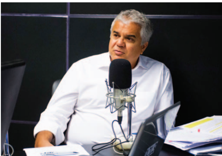
Guanabara afirmou que temor dos moradores de Patamares não tem fundamento

Ainda segundo ele, a Av. Atlântica está prevista para "um dia, se houver necessidade". No entanto, o antigo projeto está parado.