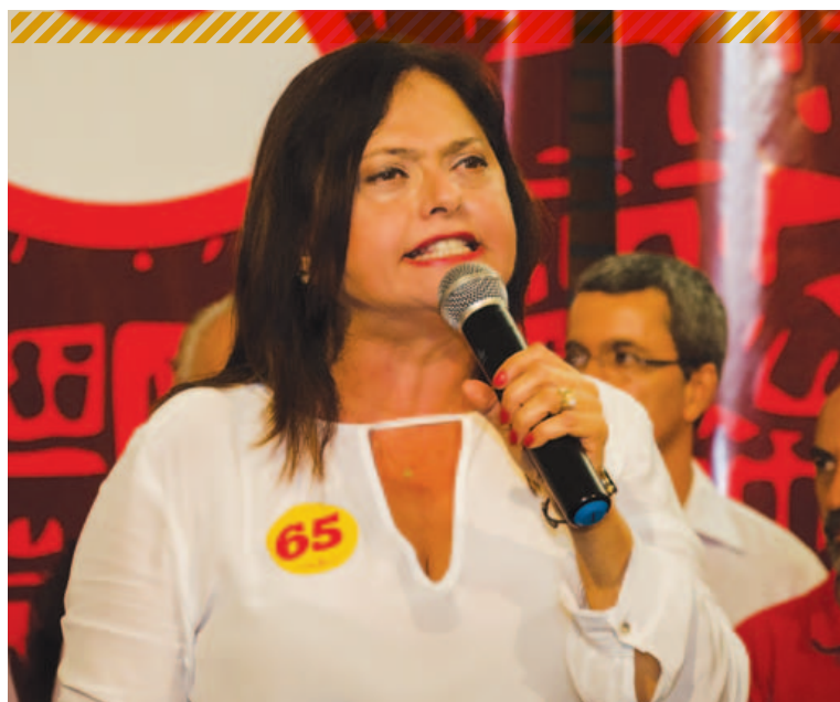
Deputada Alice Portugal deve ser a principal adversária de ACM Neto em outubro