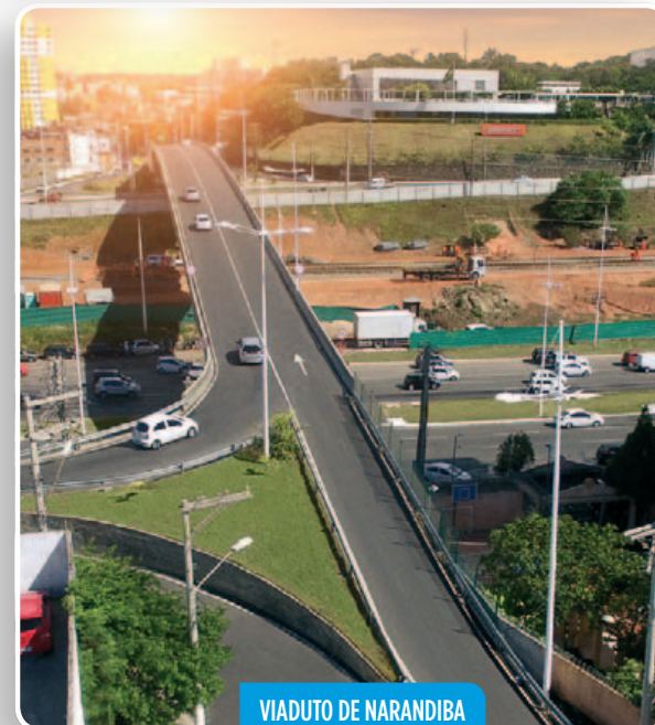
VIADUTO DE NARANDIBA