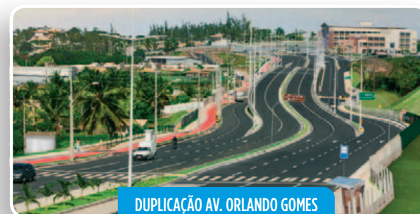
DUPLICAÇÃO AV. ORLANDO GOMES