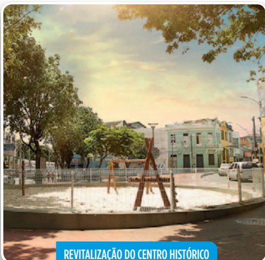
REVITALIZAÇÃO DO CENTRO HISTÓRICO