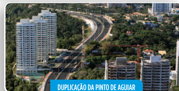
DUPLICAÇÃO DA PINTO DE AGUIAR