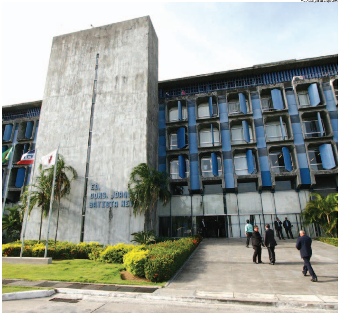
Após decisão polêmica do Supremo Tribunal Federal, o Tribunal de Contas dos Municípios corre o risco de perder sua função primordial

gestão praticados em desconformidade com a legislação, e que produzam danos ao erário público”. Netto ainda lembrou que “nos pequenos municípios o prefeito atua, simultaneamente, como chefe de governo e ordenador de despesas”, o que daria poder ao gestor em relação à Câmara de cada cidade.