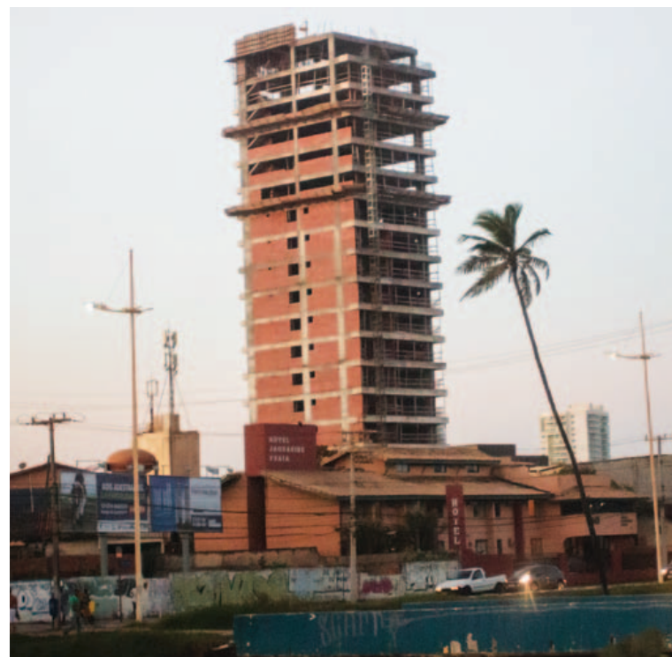
Segundo moradores, grandes espigões vão se tornar cada vez mais comuns no bairro