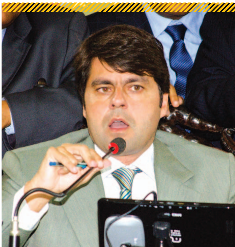
Presidente da Câmara ressalta posição do Legislativo Municipal como “palavra final”