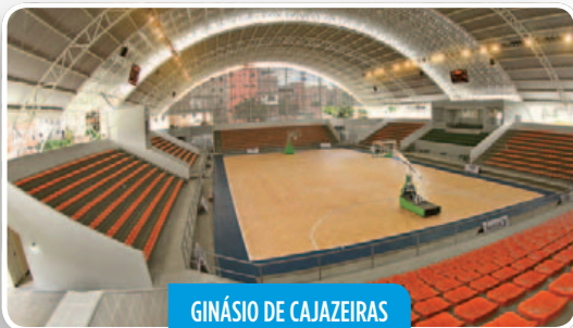
GINÁSIO DE CAJAZEIRAS