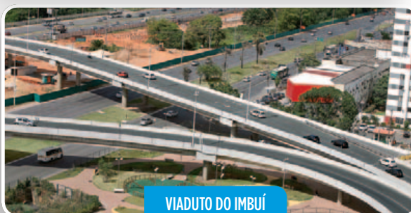
VIADUTO DO IMBUÍ