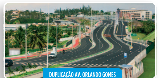
DUPLICAÇÃO AV. ORLANDO GOMES