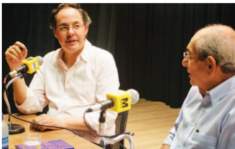
A necessidade de se construir uma identidade brasileira olhando para o futuro foi tema da conversa

O economista ressaltou a necessidade de não copiar modelos identitários de outros países. "As relações de trabalho no Brasil são muito diferentes, as pessoas têm afetividade. Temos que usar nossa originalidade, sem arrogância", declarou.