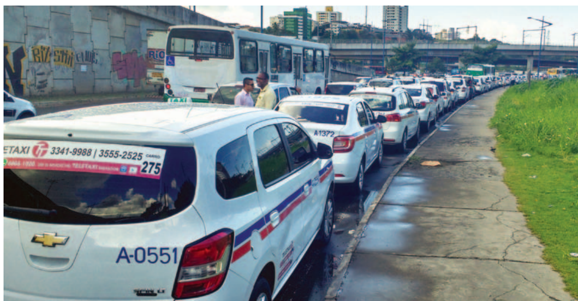
Carreata organizada pelos taxistas causou um grande engarrafamento na região da Avenida Mário Leal Ferreira, a Bonocó, na terça-feira

4 MESES é o tempo de operação do aplicativo Uber em Salvador