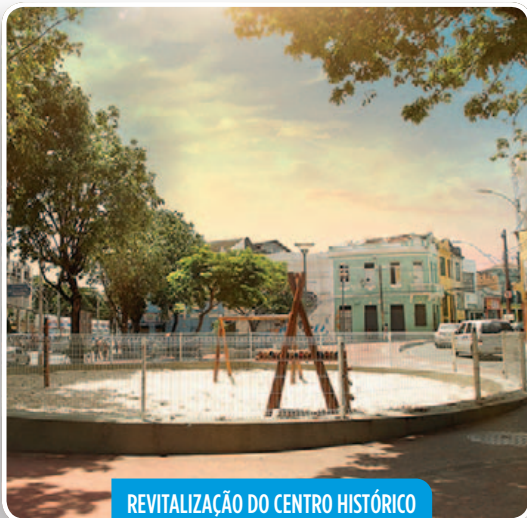
REVITALIZAÇÃO DO CENTRO HISTÓRICO