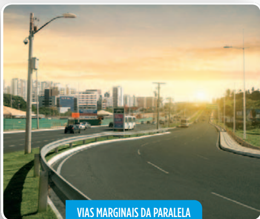
VIAS MARGINAIS DA PARALELA