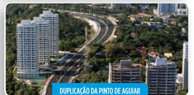
DUPLICAÇÃO DA PINTO DE AGUIAR