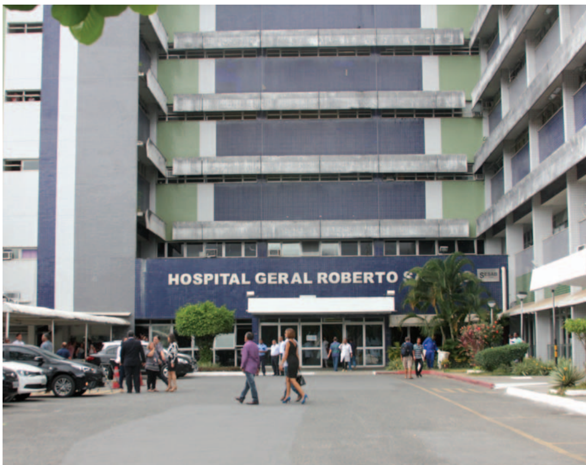
Daqui a pouco mais de duas semanas, a empresa DSA Refeições deve assumir o fornecimento de alimentação do Hospital Roberto Santos

A idoneidade da Sabore começou a ser questionada após uma série de denúncias de falsificação de documentos e prática de ato fraudulento para a obtenção do contrato no Roberto Santos. Cinco meses depois, na última terça (23), uma publicação no Diário Oficial do Estado definiu o futuro da Sabore, que está proibida de contratar com o estado pelos próximos cinco anos, após ser considerada inidônea e culpada pela fraude. Com isso, todos os contratos da Sabore serão cancelados.