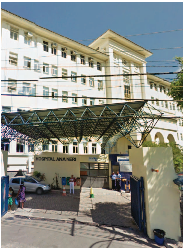
No Ana Nery, Sabore vai ficar até que seja realizada uma licitação emergencial