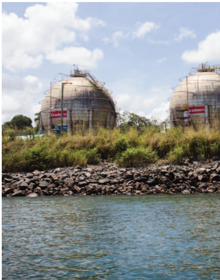
Projeto em Aratu começou ainda na antiga Copene e avança há mais de uma década com a Braskem