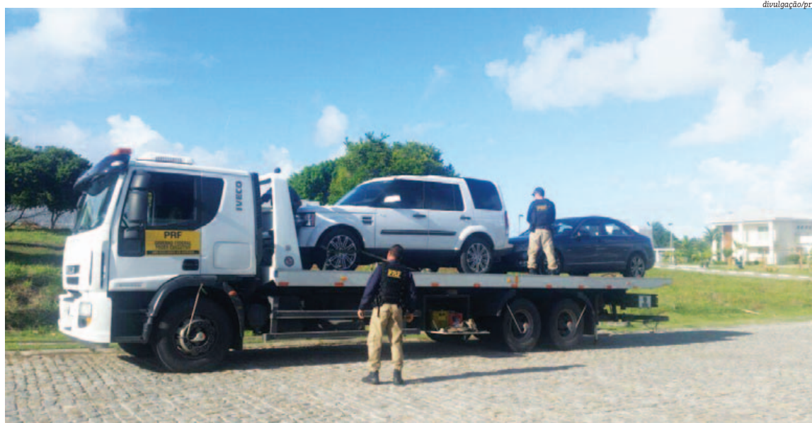
Na segunda fase da Operação Adsumus, deflagrada nesta semana, carros de luxo foram apreendidos pela Polícia Rodoviária Federal

1,8 BILHÃO foi o valor movimentado pelo esquema, de acordo com o Ministério Público