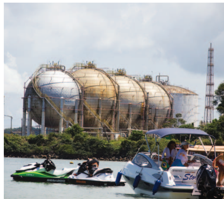
Há anos, barcos e jet skis dividem o cenário com as grandes instalações petroquímicas em Aratu