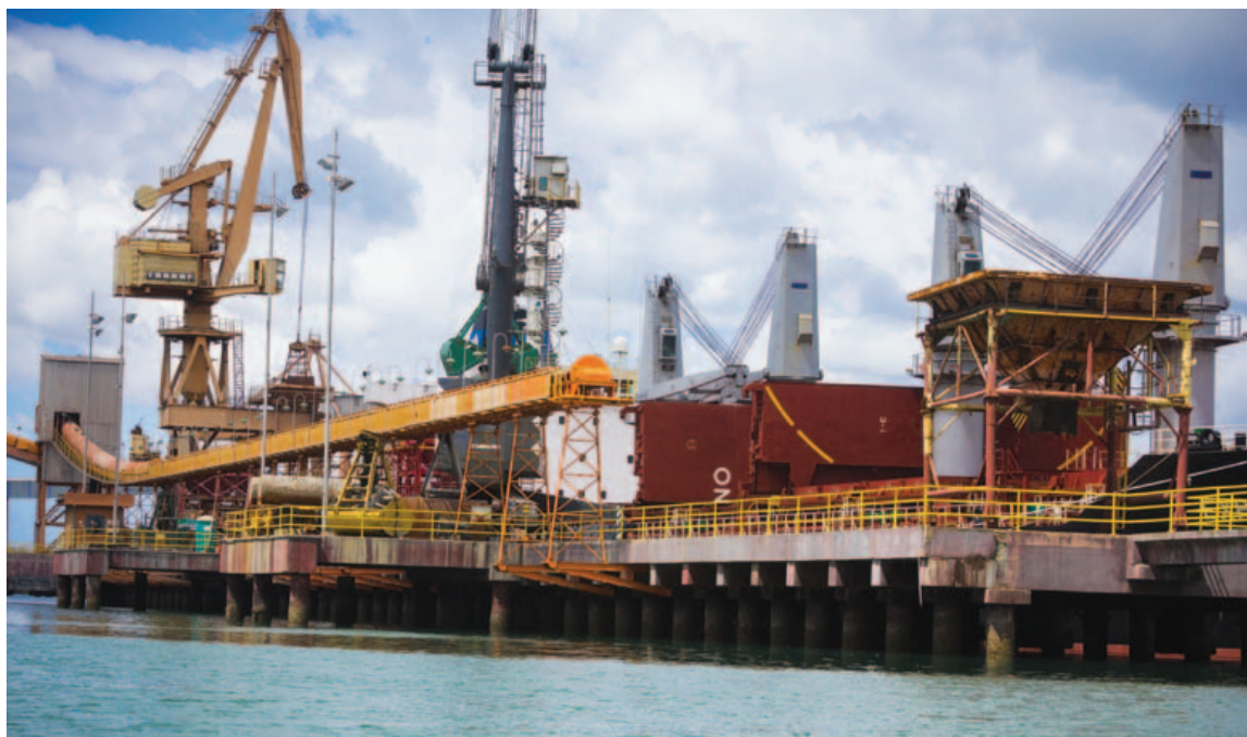
Com autorização de novo terminal, área portuária se estenderia à Prainha, acabando com uma das últimas regiões de lazer natural de Candeias

novo terminal submete a região à degradação. “Se revela absolutamente conflituosa a manutenção das atividades portuárias da Braskem e a utilização da ‘Prainha’ como área de lazer e recreação, razão pela qual uma das duas hipóteses deve ser sobrestada cautelarmente pelo Poder Judiciário”, diz o texto.