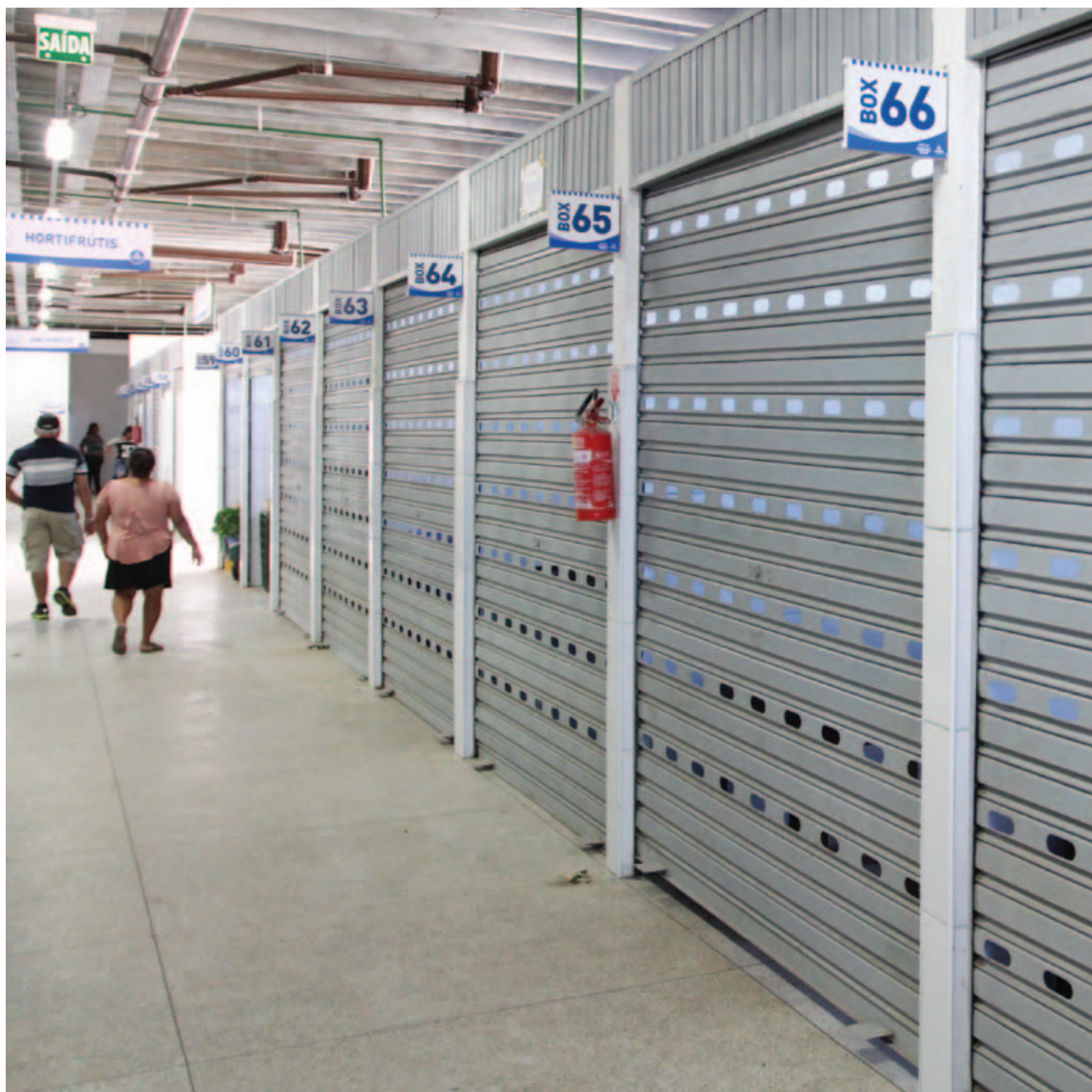
Para os poucos que vão ao Mercado de Cajazeiras, o cenário é este: muitos boxes fechados. E acredite: tem mais feirante do que cliente