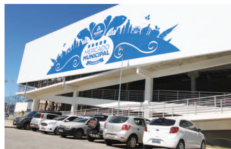
A beleza da fachada não reflete a situação em que vivem os comerciantes do mercado