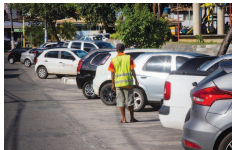
Segundo opositorista, prefeito de Lauro de Freitas recuou após denúncia; vamos acompanhar