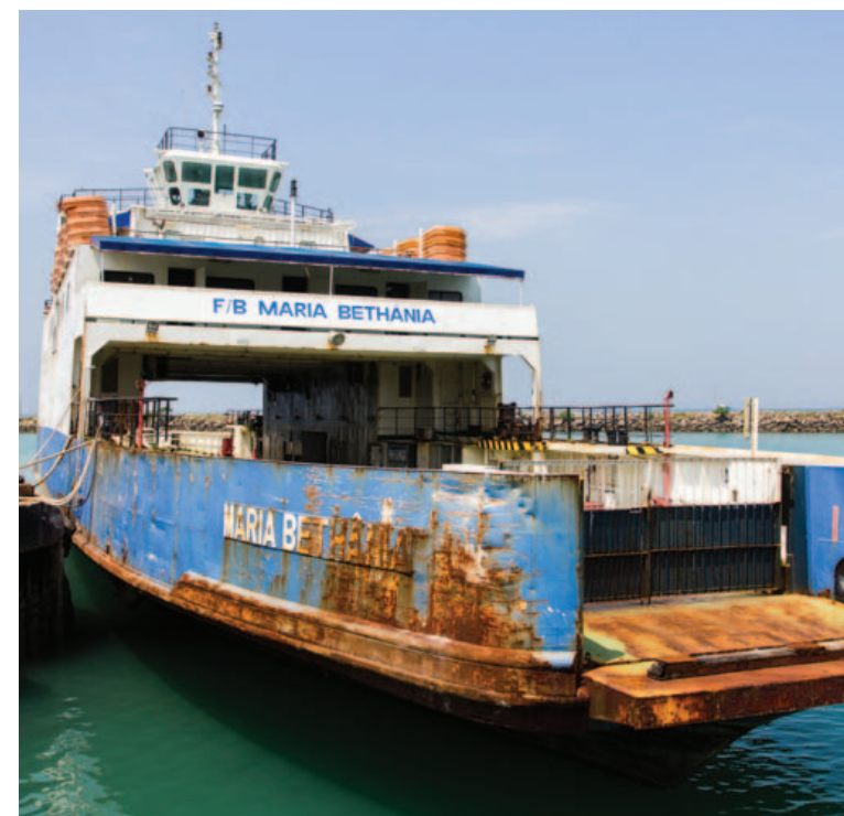
O Maria Bethânia é um dos quatro ferries que estão parados para manutenção