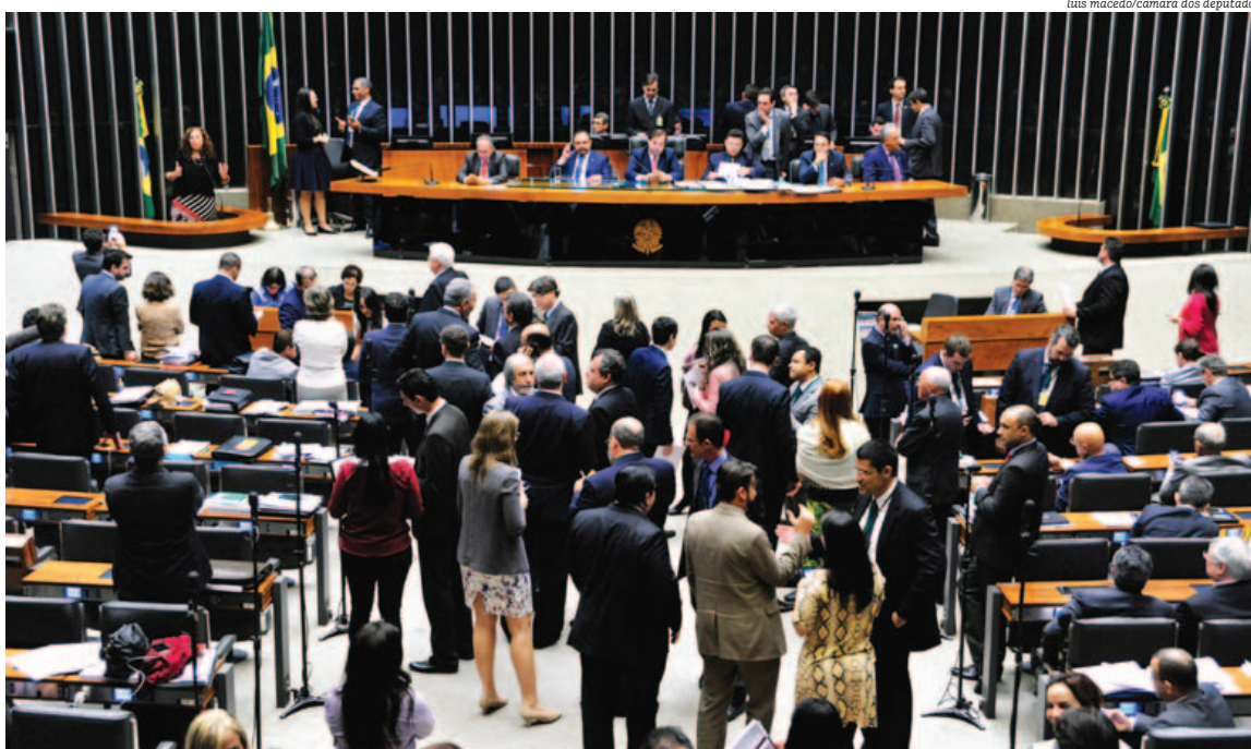
PEC foi aprovada em primeiro turno na Câmara, já passou por comissão especial e vai a votação em segundo turno no plenário da Casa

fique em um patamar bom, mas é preciso baixar os juros. Nós precisamos de capital externo para fazer investimento na área de portos, estradas e vias”, explicou.