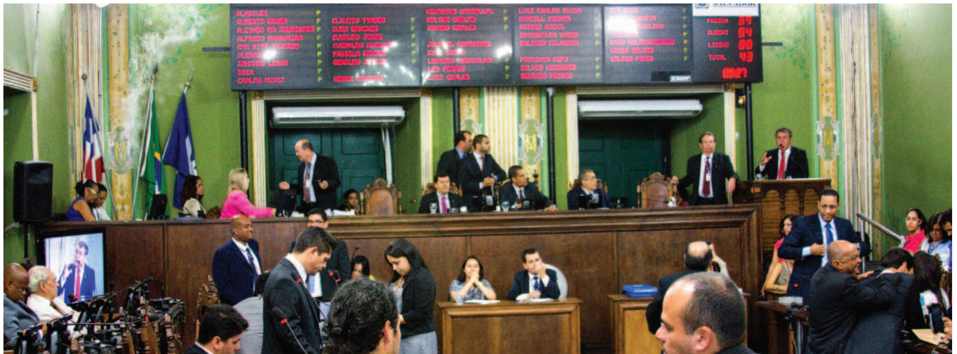
Grupo que se lançou contra candidatura de Paulo Câmara diz ter apoio de vereadores da oposição; ao mesmo tempo, o atual presidente da Casa se reúne com opositores em busca de apoio para sua reeleição no cargo