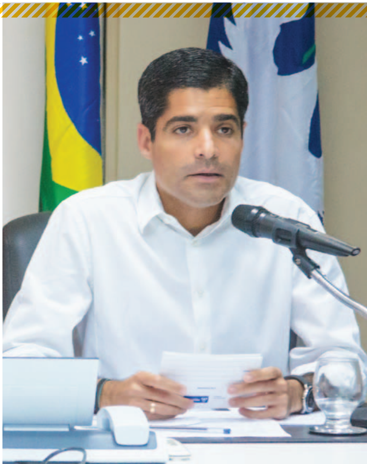
Segundo Paulo Souto, gestão de ACM Neto ficou “sem pão e sem água” no governo Dilma

Souto ressaltou ajuda de Geddel ao Município