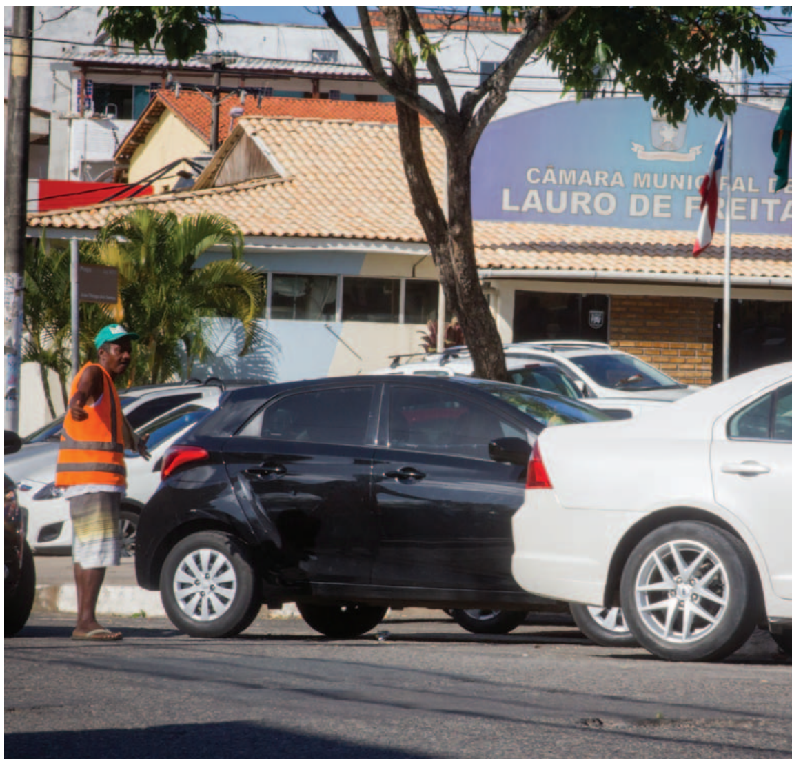
Prefeitura prometeu polêmico edital de privatização da Zona Azul para esta semana; a Procuradoria do Município não se pronunciou