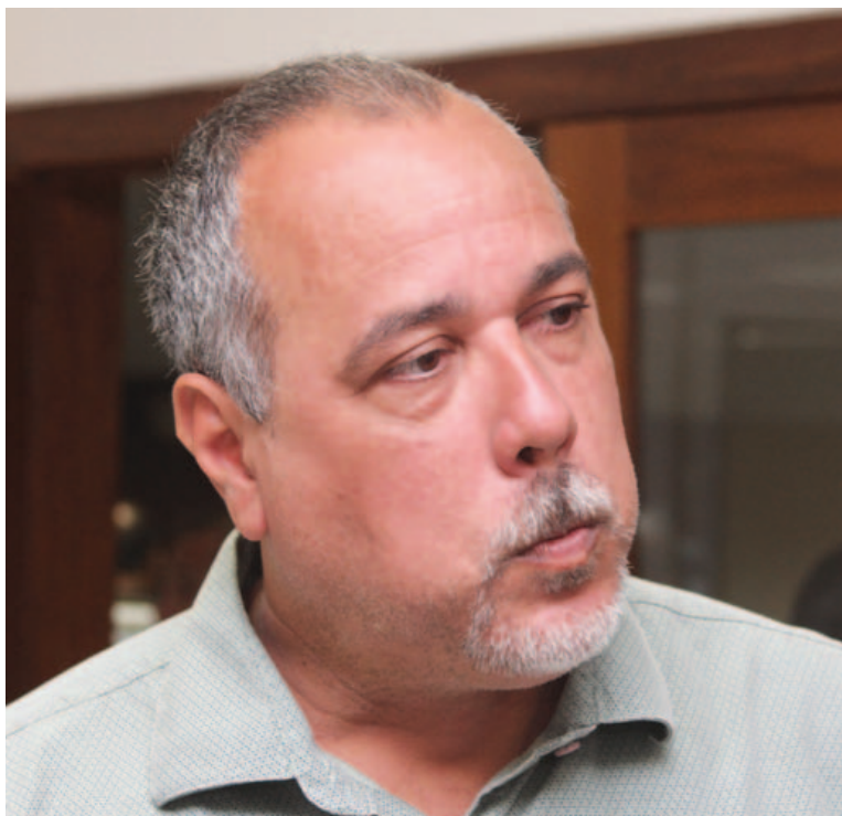
Impopular, prefeito de Lauro de Freitas sequer tentou reeleição e deixa cargo em dezembro