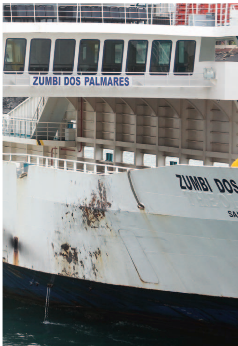
Casco do Zumbi está sendo reparado. Segundo a Agerba, danos não são graves e são resultado do uso