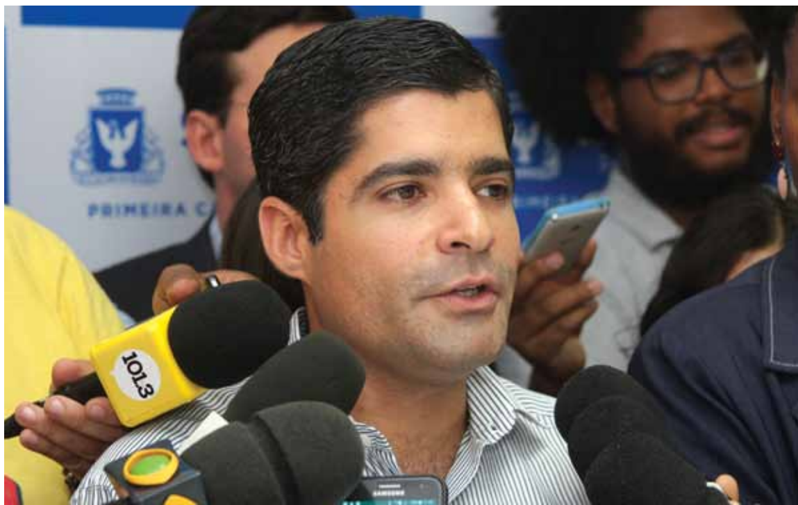
O prefeito ACM Neto reconheceu que já conversou com Paulo Câmara sobre sua situação. O teor da conversa, porém, não foi revelado

2 DE janeiro é o dia da eleição para a presidência da Câmara Municipal