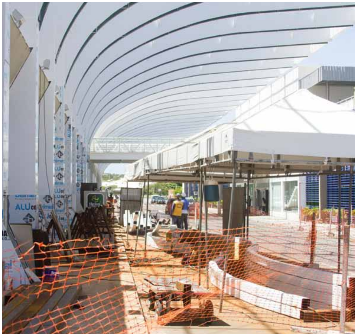
Clima de obras é comum há cerca de quatro anos; mas, no quesito melhorias, de fato muito pouco aconteceu. Concessão é uma esperança