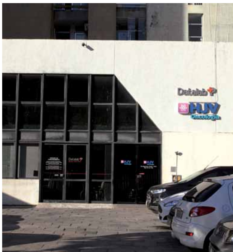
Promédica afirma que fez mais do que o previsto em contrato e que não negligenciou paciente