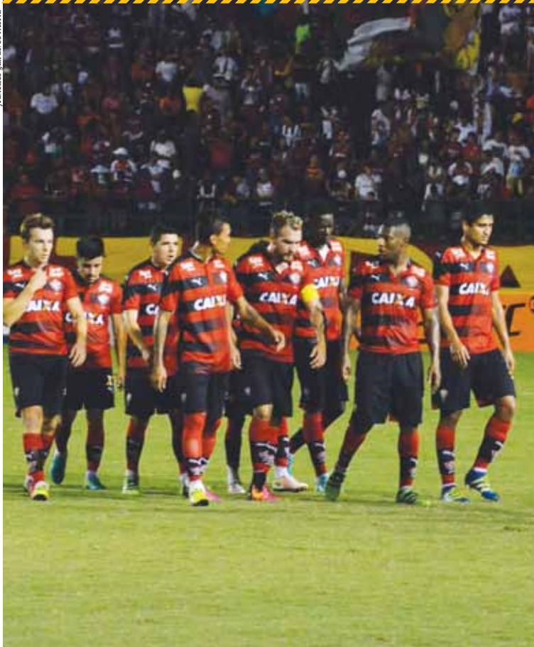
Segundo Carneiro, sem ele, o Vitória caminhou para se tornar um clube comum