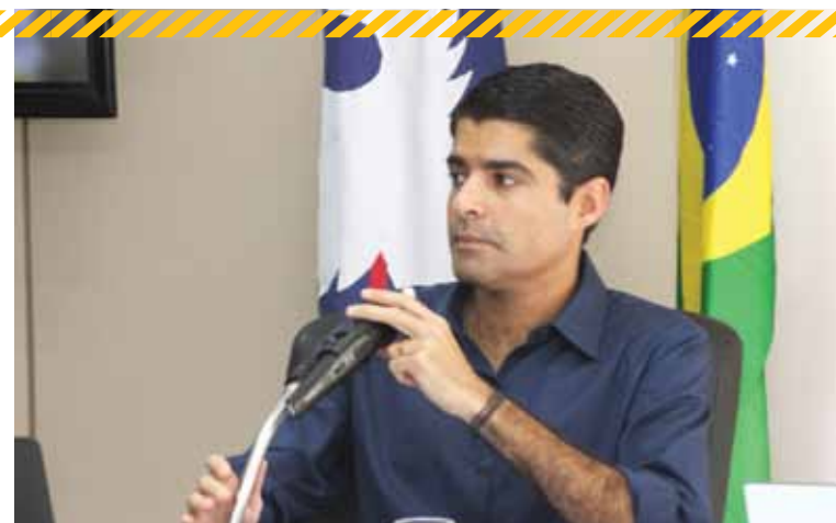
Neto negou que algum secretário vá ter privilégios ou se impor durante a administração

sições partidárias. Quando tentaram fazer, se deram mal. Comigo isso não cola. Mas eu ouço as pessoas que estão próximas a mim, as lideranças políticas. Eu acho que a democracia só é feita dessa forma”, disse o prefeito.