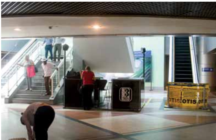
Nem as vendedoras de assinaturas de revista, comuns no aeroporto, estão marcando presença

Depois de tantas promessas descumpridas pela Empresa Brasileira de Infraestrutura Aeroportuária (Infraero), o passageiro quer agora uma solução definitiva para o equipamento, que entrou em obras em meados de 2012 e depois de incríveis quatro anos continua ostentando banheiros sujos e equipamentos como escada rolante e elevadores sem funcionar. Será que agora, finalmente, vai?