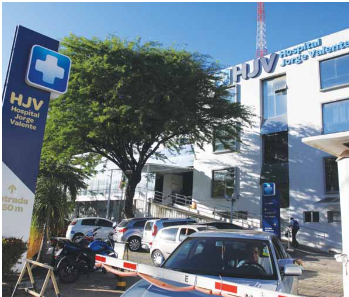
A paciente está internada no Hospital Jorge Valente, e a família se recusa a assinar a alta enquanto não receber o que considera justo

levá-la para casa eles estão querendo dar. Perguntaram se a gente tinha Vitalmed. O plano se posiciona da forma mais fria. Nem o colchão casca de ovo, que a gente precisa colocar por conta das escaras, eles estão querendo dar. Ela está tomando medicamento venoso. No momento que for transferir para casa, vão trocar por pílula, que o plano não cobre”, lamenta.