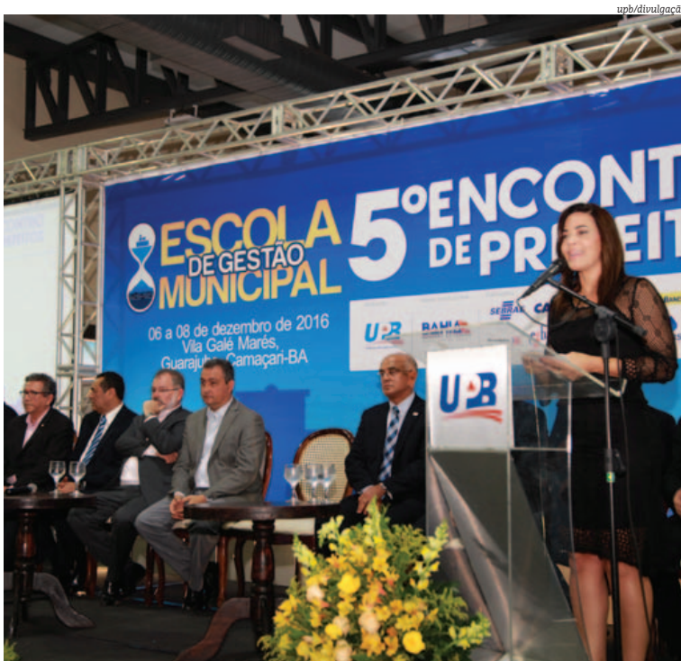
Enquanto Cardeal da Silva sofria, a prefeita da cidade comemorou no Encontro de Prefeitos