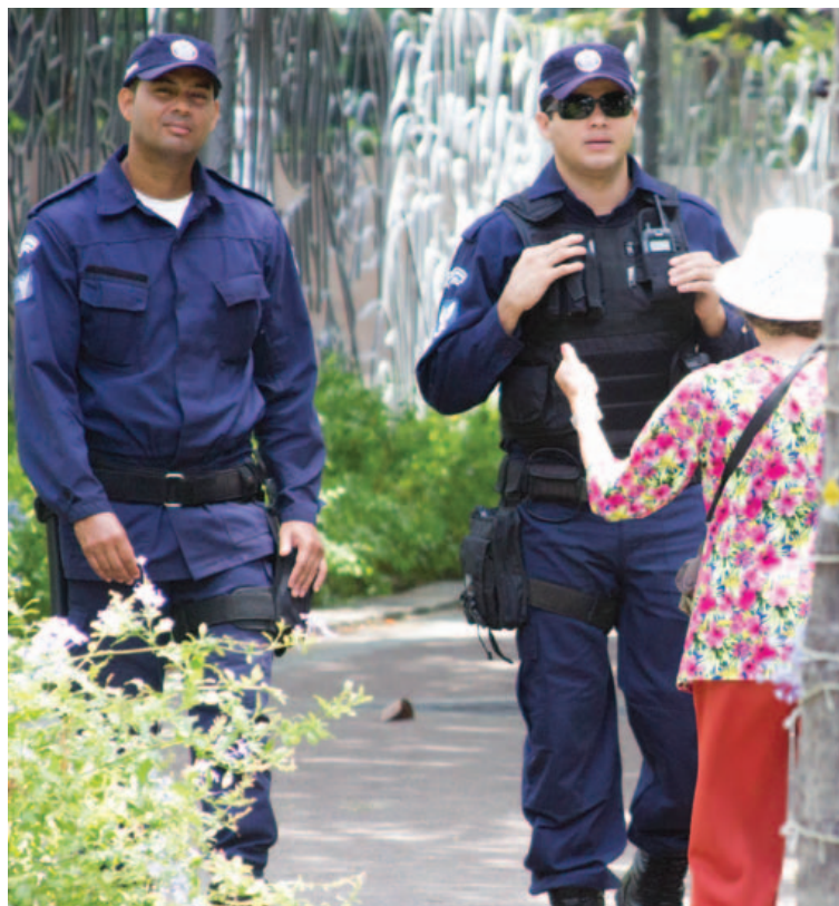
Não se pode confundir agentes que erram com os que fazem seu trabalho e ajudam a população