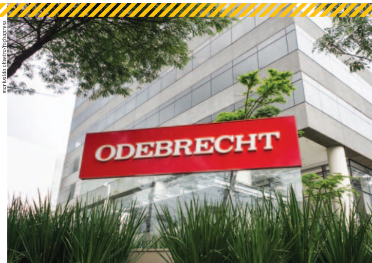
Primeira delação da Odebrecht estremeceu a política brasileira; futuro é incerto

dólares custava o relógio com que Wagner foi presenteado, a R$ 2,01 à época