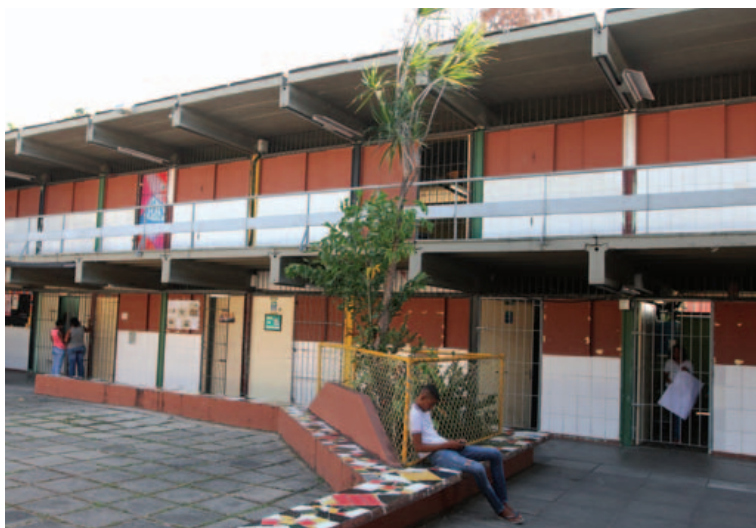
Escolas do interior do estado estão prejudicadas pela falta de pagamento de professores

Enquanto os prefeitos fazem festa, o Sindicato dos Trabalhadores em Educação da Bahia (APLB-BA) denuncia 122 cidades baianas por atrasarem salários de professores. Além disso, várias delas não têm previsão para pagar o 13º. “Fomos ao Ministério Público e eles se comprometeram a passar para todas as comarcas do interior, para que sejam instaurados inquéritos civis públicos contra essas prefeituras. Temos que fazer alguma coisa”, falou.