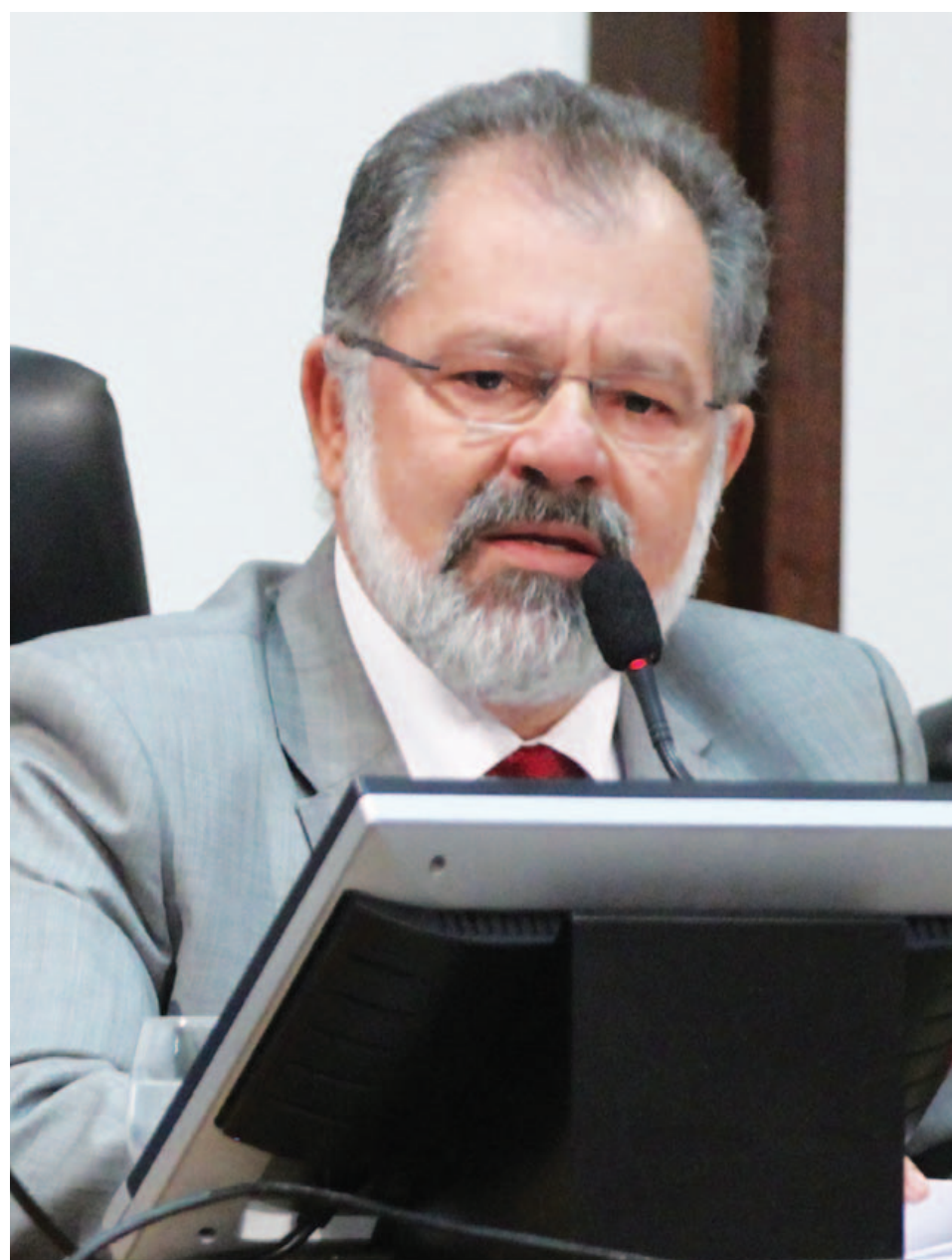
Coronel fortalece sua candidatura e caminha para desidratar as de Pastor Sargento Isidório (PDT) e Luiz Augusto (PP). Nilo, por sua vez, garante que já tem mais de 30 apoios entre governo e oposição. Ele quer ser senador em 2018

Texto Matheus Morais matheus.morais@metro1.com.br