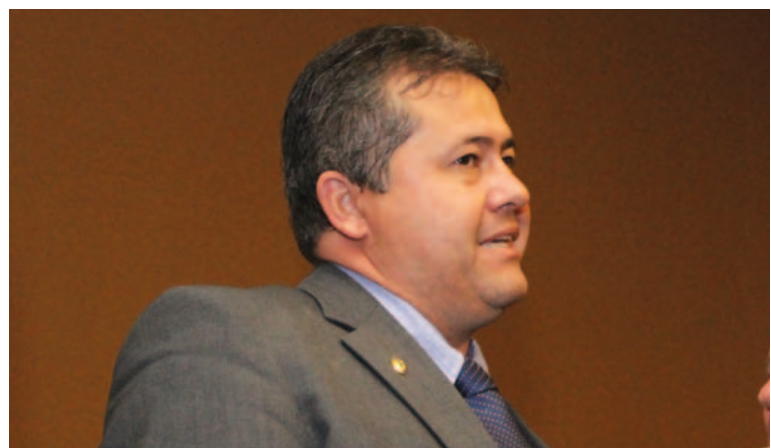
Alex da Piatã acredita que Coronel pode rivalizar com Marcelo Nilo de igual para igual