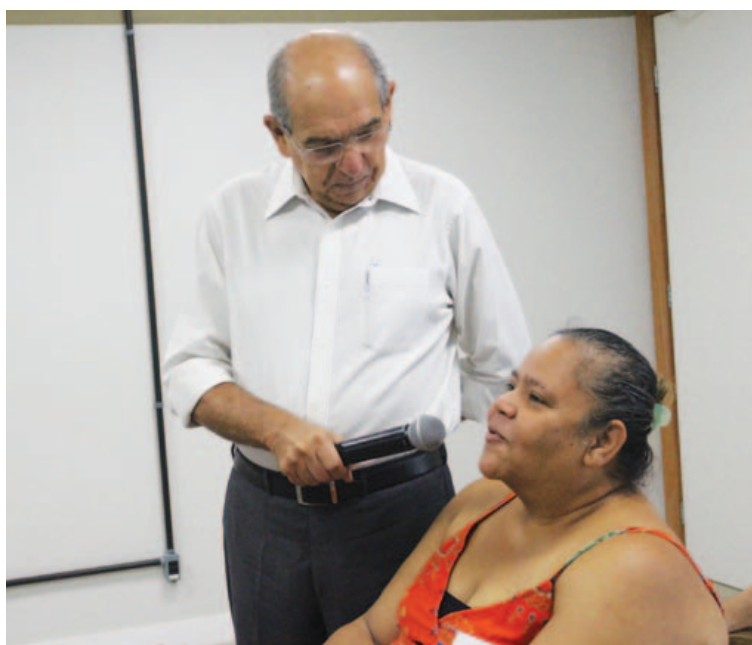
Participação dos ouvintes, por telefone, mensagem e até pessoalmente, é marca da rádio