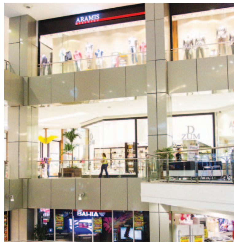
Shopping Salvador preferiu não ser claro sobre o que faz da taxa de condomínio algo tão caro

O Shopping da Bahia e o Bela Vista não se posicionaram até o fechamento da matéria.