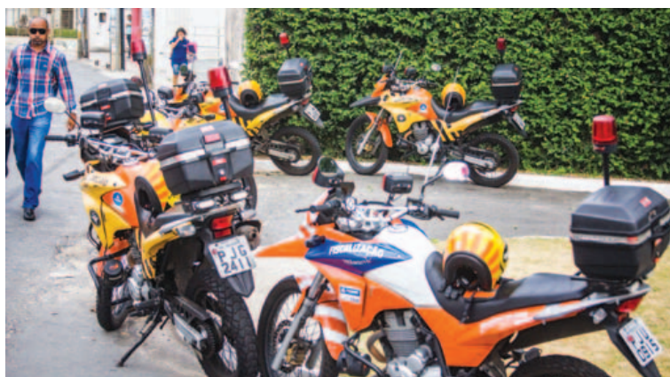
De moto, agentes monitoram, fiscalizam e aplicam multas aos motoristas infratores

Muller afirmou à Metrópole que enviou para a Gurilândia uma equipe especializada em problemas de trânsito causados por escolas e pais de alunos. A intenção é não só reprimir as infrações, como multar os motoristas. Para isso, agentes e várias motos da autarquia estiveram na frente da escola entre segunda e quarta-feira (8).