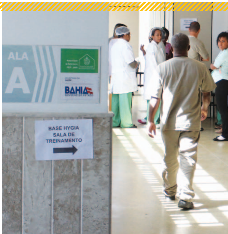
Chegada do Instituto Hygia causou polêmica e continua cercada de suspeitas

Ex-funcionária da Maternidade José Maria de Magalhães Netto