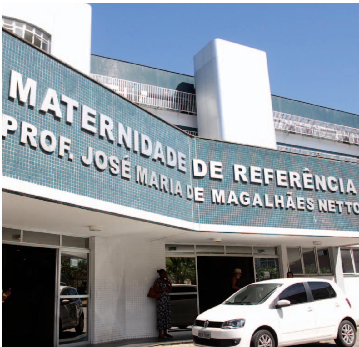
Desde o fim de janeiro, a Maternidade José Maria de Magalhães Netto é administrada pela Hygia, que tem um histórico de problemas

Mas segundo apurou a Metrópole , o corte mirou os profissionais com experiência. “Quem está lá vai ganhar um salário menor que no edital. Por exemplo, há muitas nutricionistas trainee, recém-formadas”, disse uma fonte que pediu anonimato.