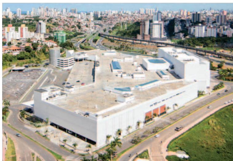
O Shopping Bela Vista foi um dos que não respondeu aos questionamentos da Metrópole